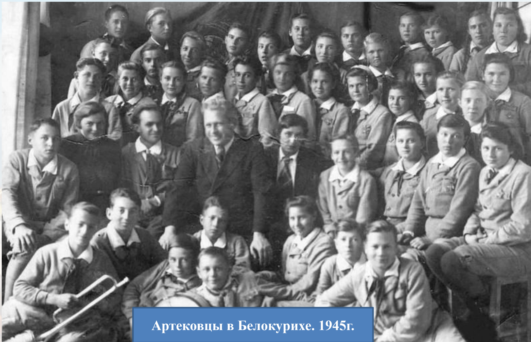
Артековцы в Белокурихе. 1945г.

12 января 1945 года в алтайском "Артеке" торжественно спустили флаг. Самая долгая и тяжелая смена в истории лагеря закончилась.