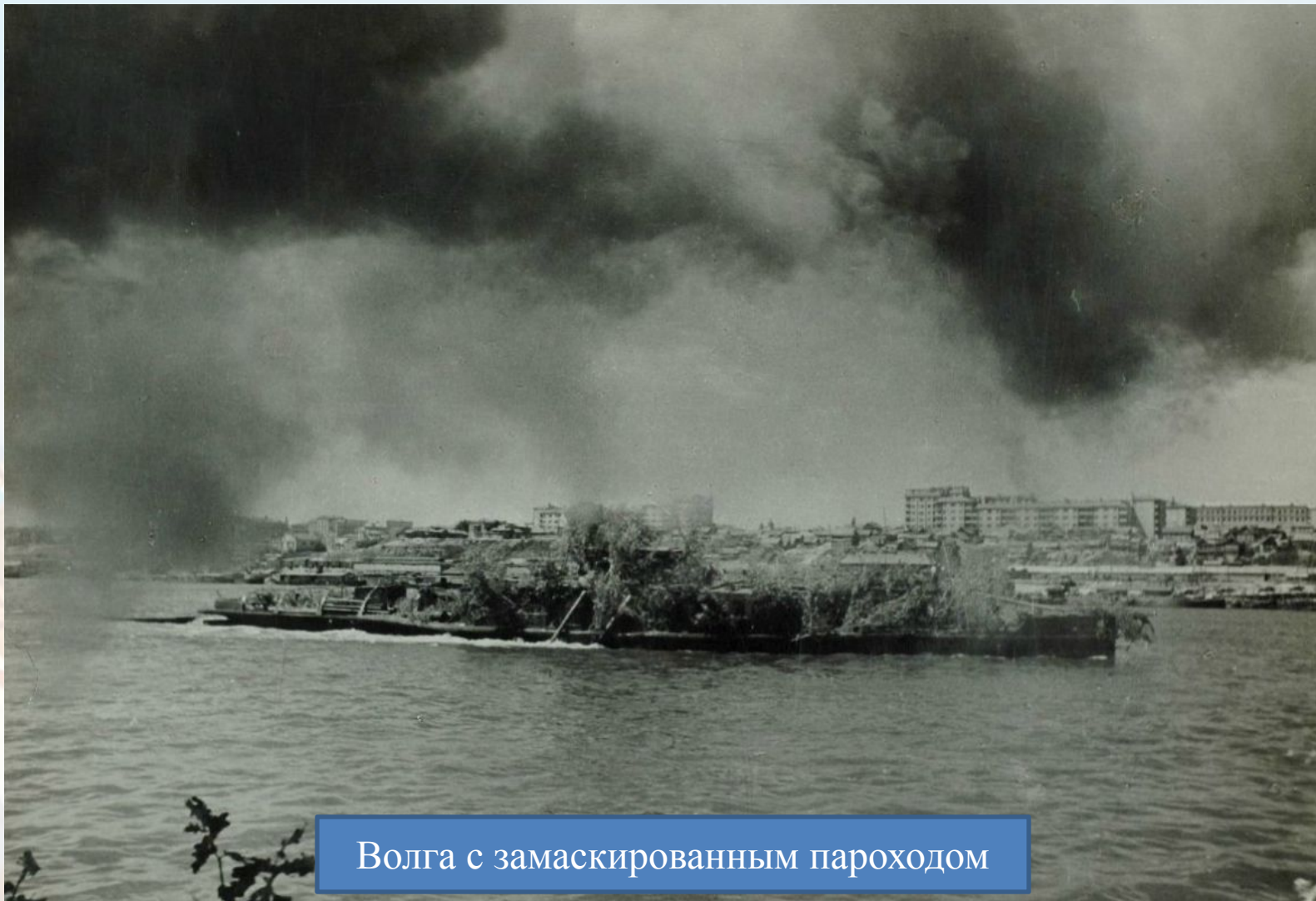
Волга с замаскированным пароходом

Погрузились на пароход, пошли вверх по Волге, подальше от фронта. С воздуха пароход был похож на островок, каких на Волге предостаточно: верхняя палуба утыкана молодыми березками и зелеными ветками - маскировка. Вечером причаливали к берегу, и пионеры шли в степь на ночевку. А вдруг налет?