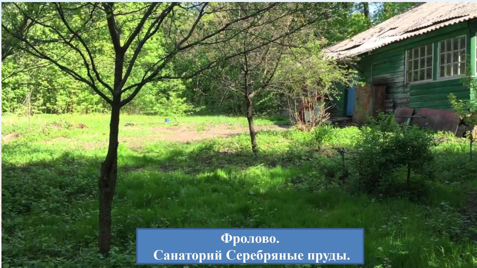
Фролово. Санаторий Серебряные пруды.

Артековский флаг подняли в санатории "Серебряные пруды". Уже привычно втянулись в работу: доили коров, водили трактор, работали на электростанции, косили сено и убирали хлеб. Но летом начались налеты немецкой авиации. Фашист подошел к Дону. Было принято решение вывозить лагерь на Алтай.