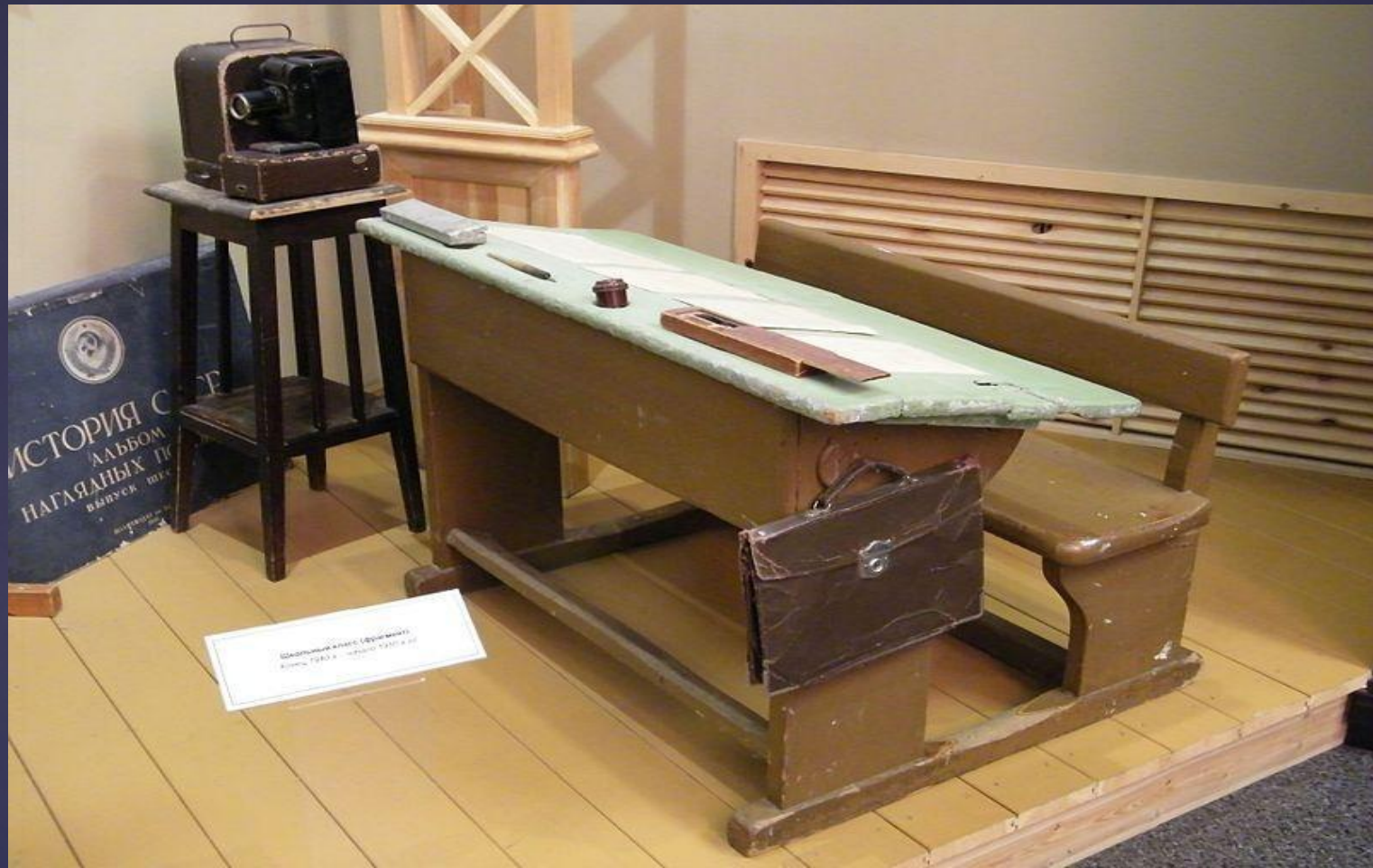
Школьный класс (Финляндия) Конец 1920-х - начало 1930-х гг.