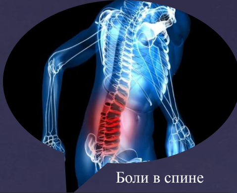
Боли в спине