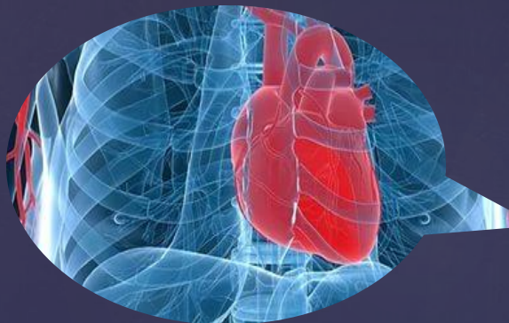
Нарушение работы, боли