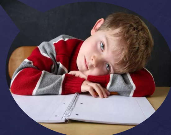
Повышенная утомляемость, снижение работоспособности