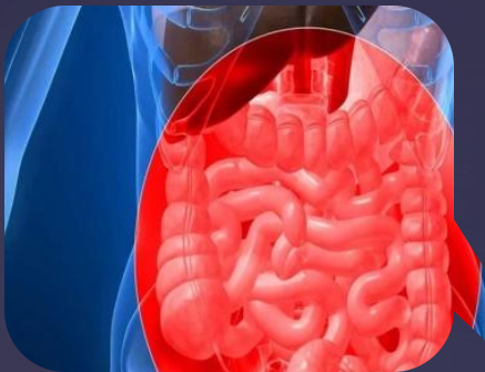
Нарушение работы кишечника