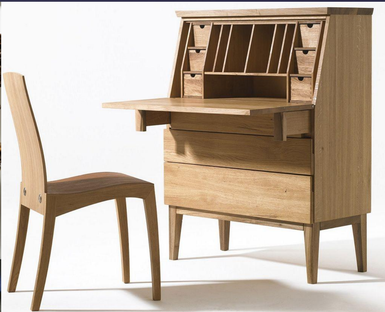
Поставец и Секретер