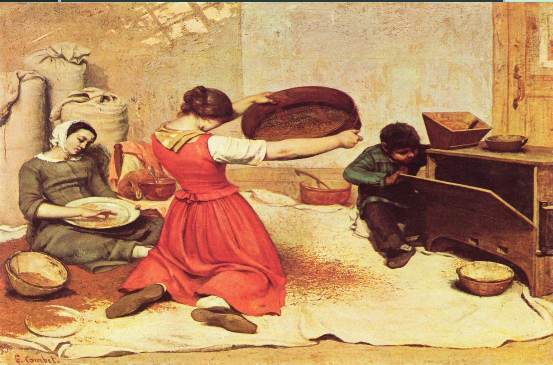
Курбе Г. «Веяльщицы», 1853