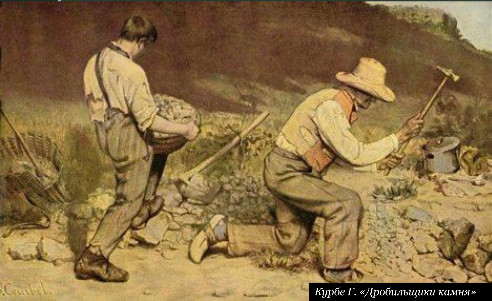
Курбе Г. «Дробильщики камня»