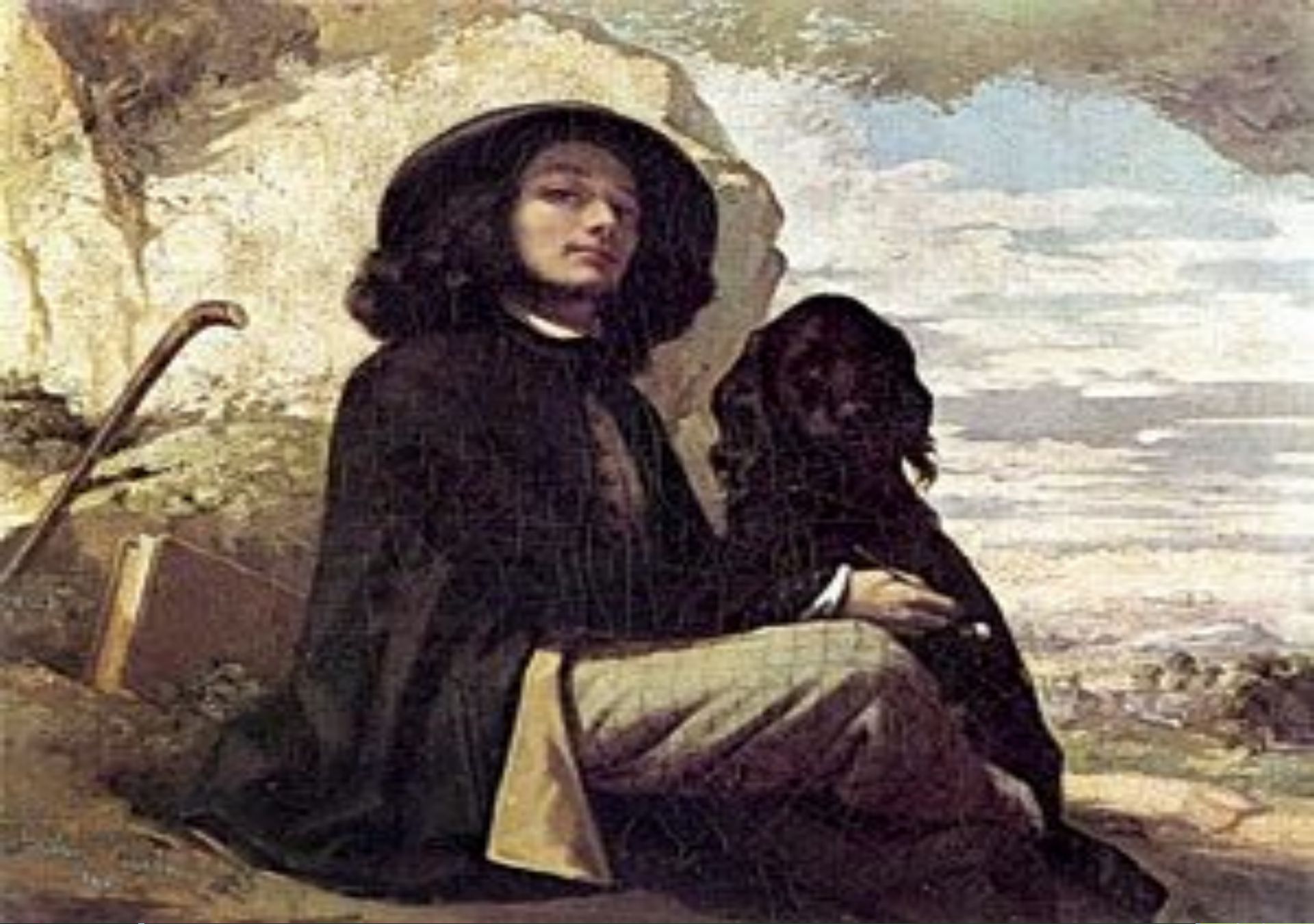
Г.Курбе «Автопортрет с чёрной собакой»