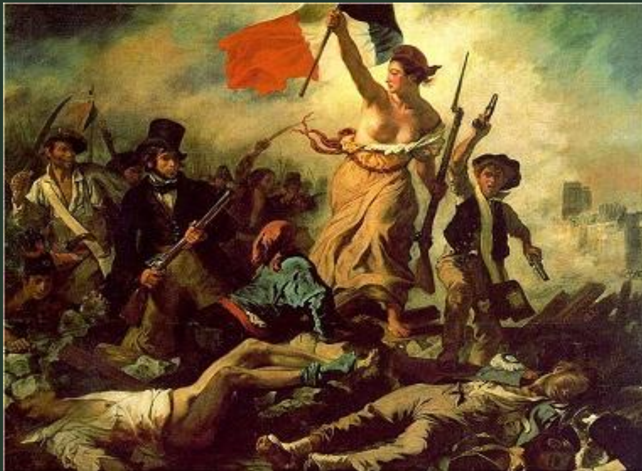
Э. Делакруа «Свобода, ведущая народ», 1830

«Девятнадцатый век будет отличаться от всех предшествовавших веков точным и пламенным изображением человеческого сердца». Стендаль