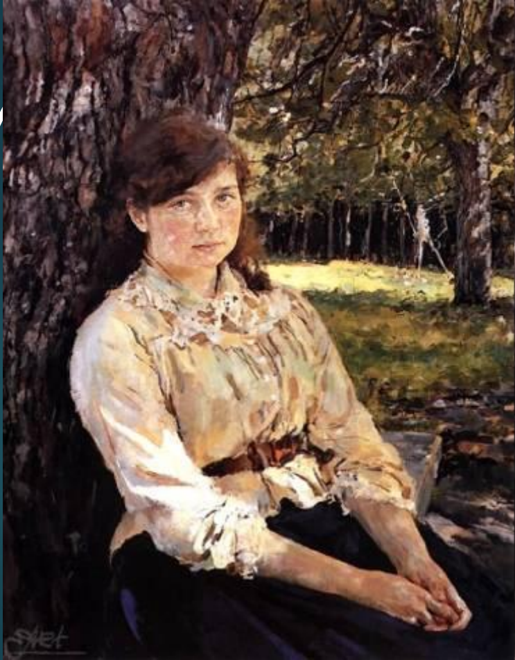
Серов В. А. Девушка, освещенная солнцем