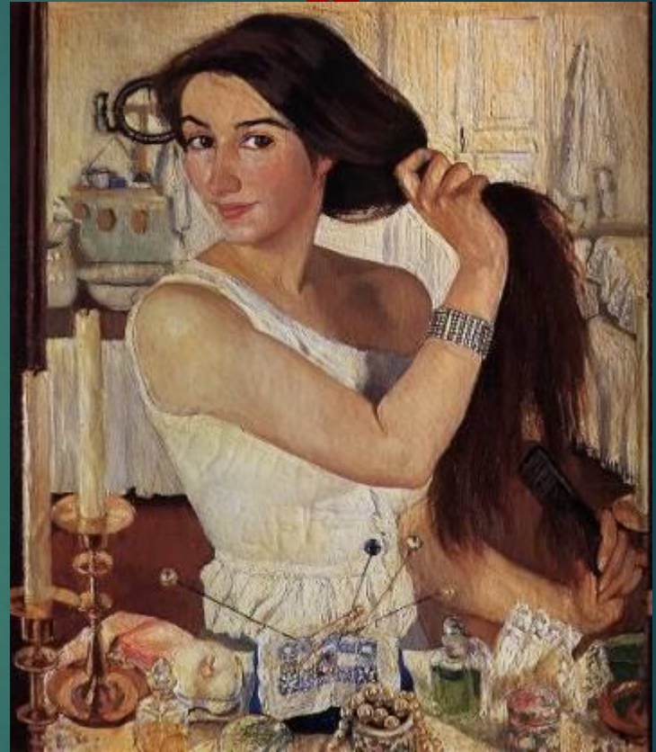
Зинаида Серебрякова За туалетом .Автопортрет.