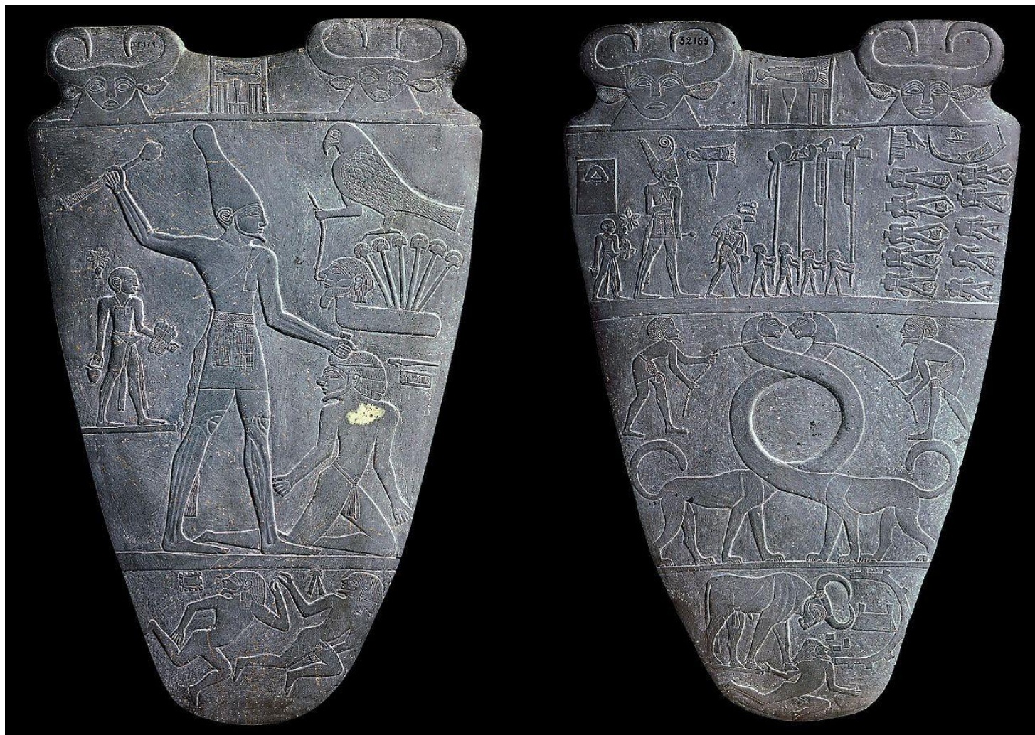
Стела-палётта царя Нармёра (середина XXXI века до н. э.). Каирский музей