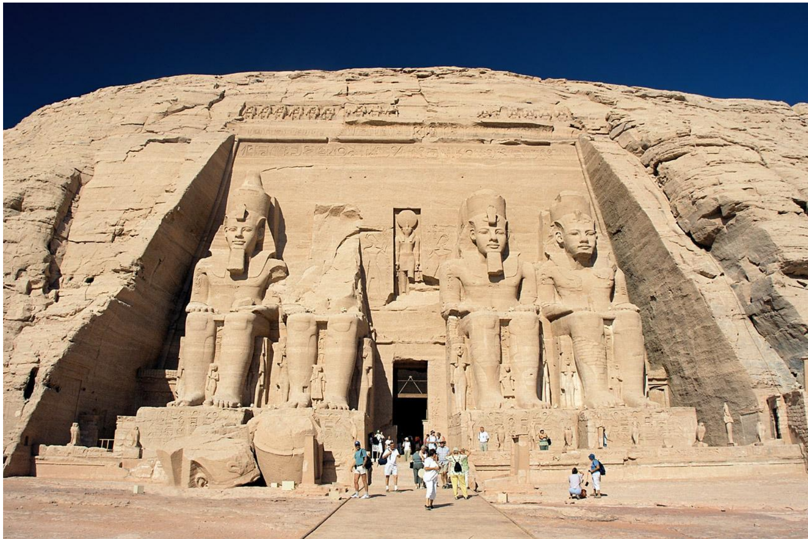
Храм фараона Рамзеса II в Абу-Симбеле (XIII век до н. э.)