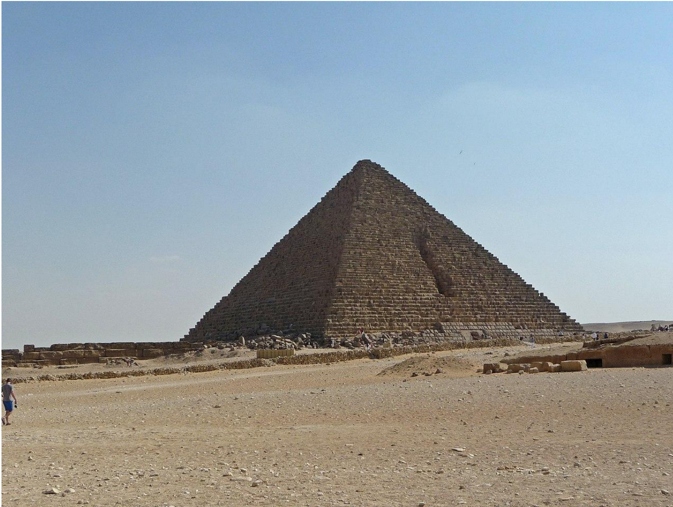
Пирамида фараона Микеріна (Менкаўра) в Гізе (последняя треть XXVI века до н. э.)