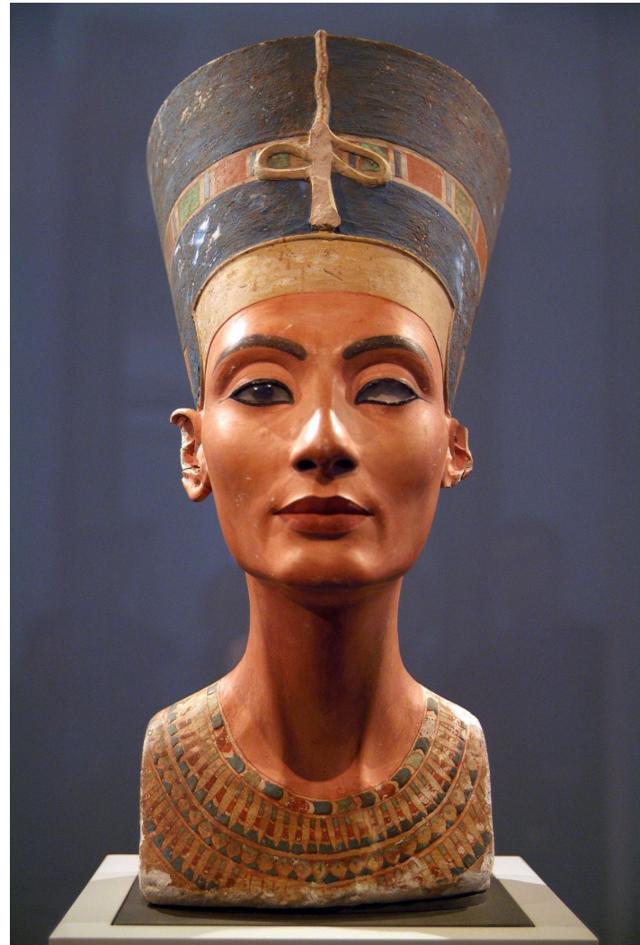
Портрет Неферт́ити из Ахетат́она (3-я четверть XIV века до н. э.) Скульптор – Т́утмос. Новые музеи, Берлин