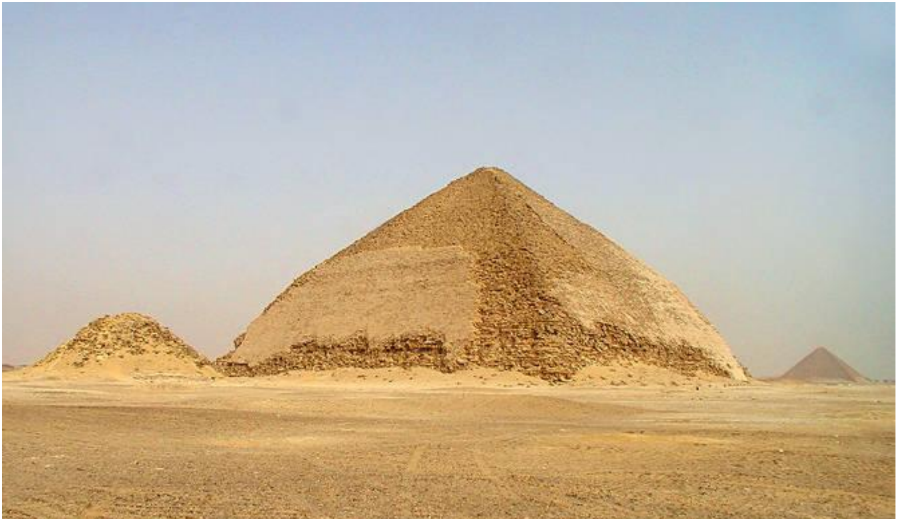
2-я «ломаная» («ромбовидная») пирамида фараона Сно́фру в Мейдúме (начало XXVI века до н. э.)