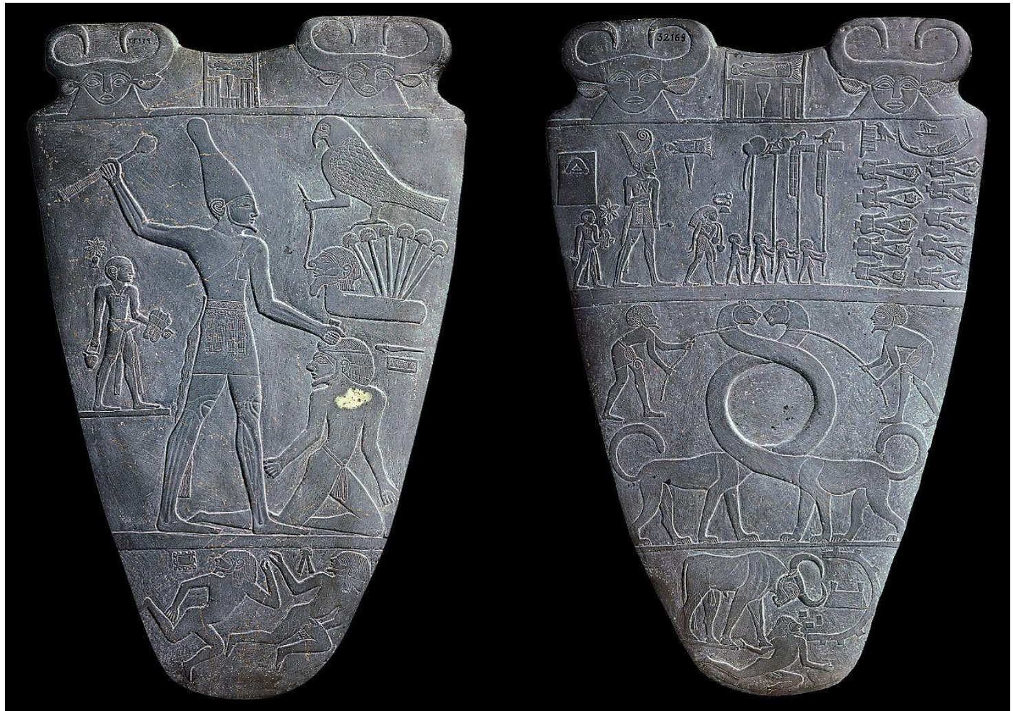
Стела-палётта царя Нармёра (середина XXXI века до н. э.). Каирский музей