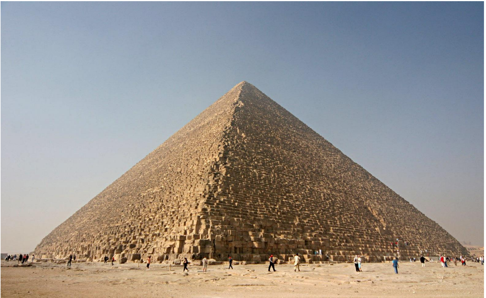
Пирамида фараона Хе́опса (Ху́фу) в Гі́зе (2-я четверть XXVI века до н. э.). Архитектор – Хемиу́н