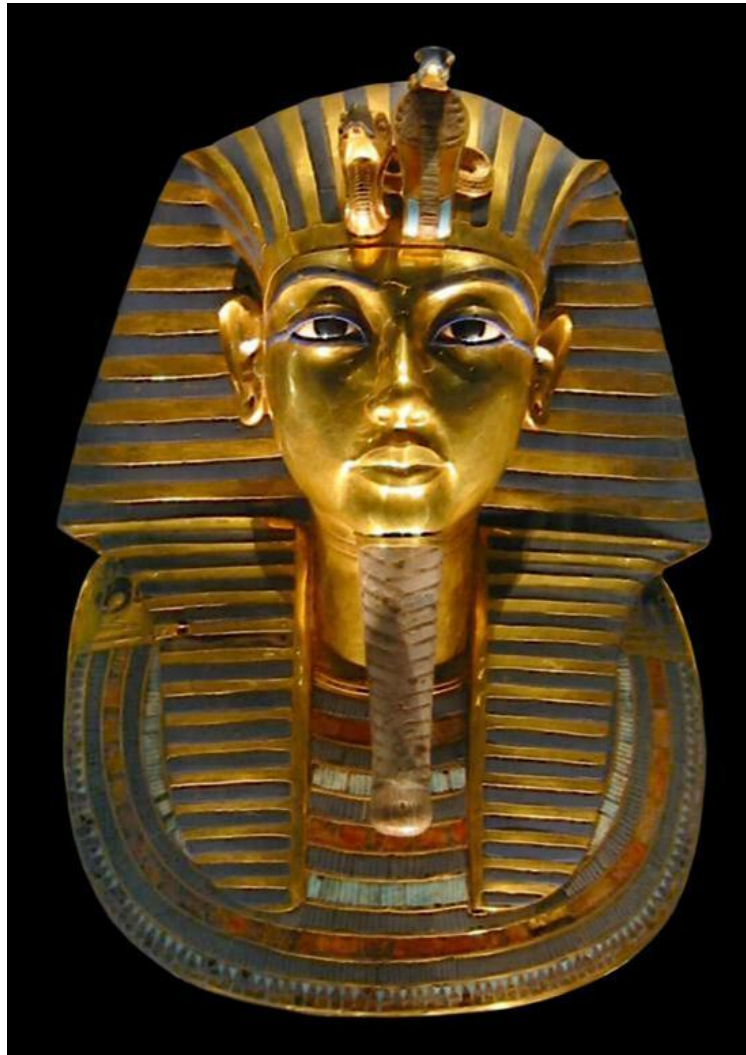
Погребальная маска фараона Тутанхамона (2-я половина XIV века до н. э.). Каирский музей