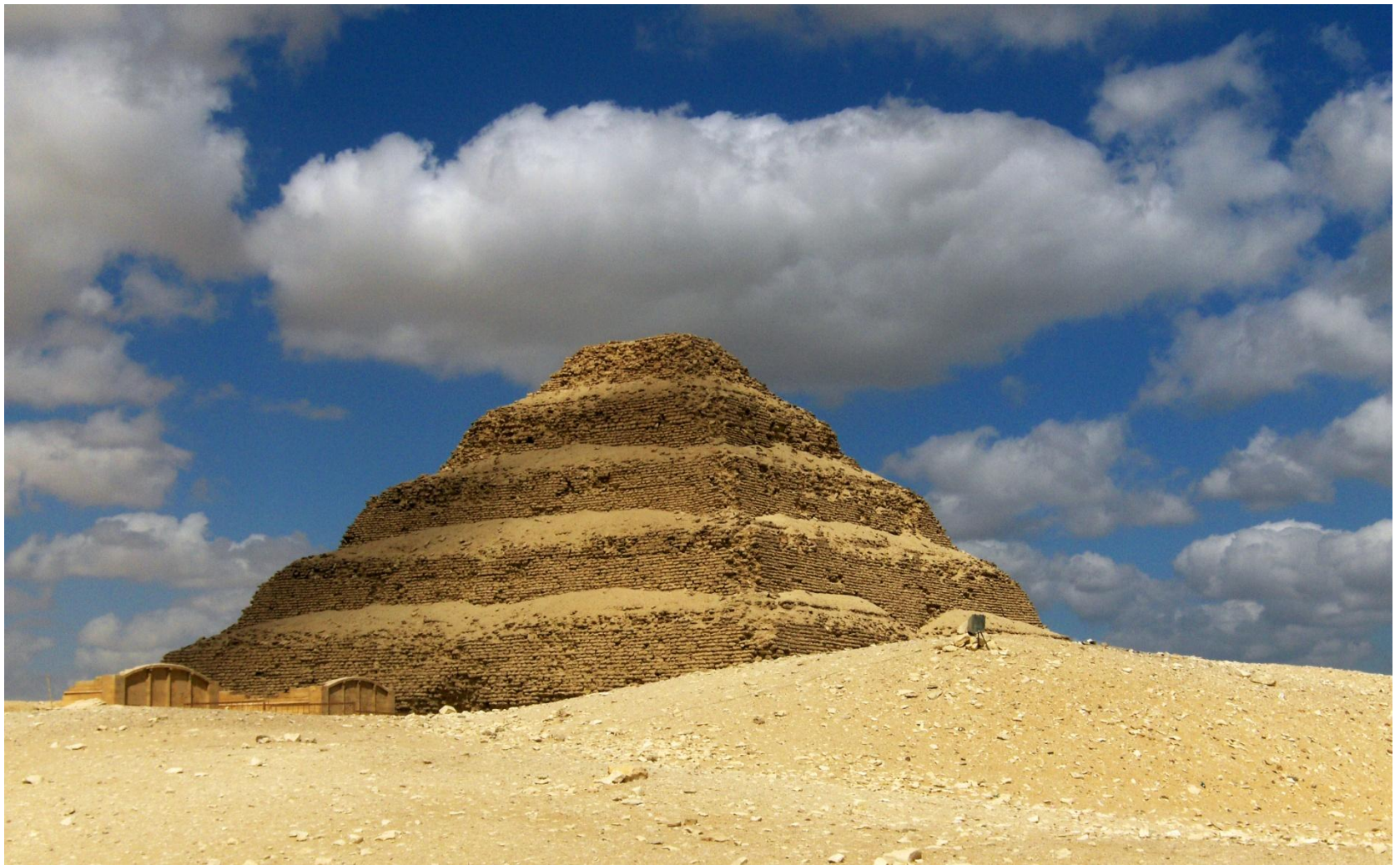
Пирамида фараона Джосера в Саккаре (XXVII век до н. э.). Архитектор – Имхотеп