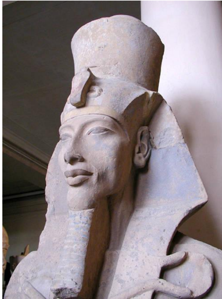
Статуя фараона Аменхотéпа IV (Эхнатóна) из Карна́ка. (1340-е годы до н. э.). Каирский музей