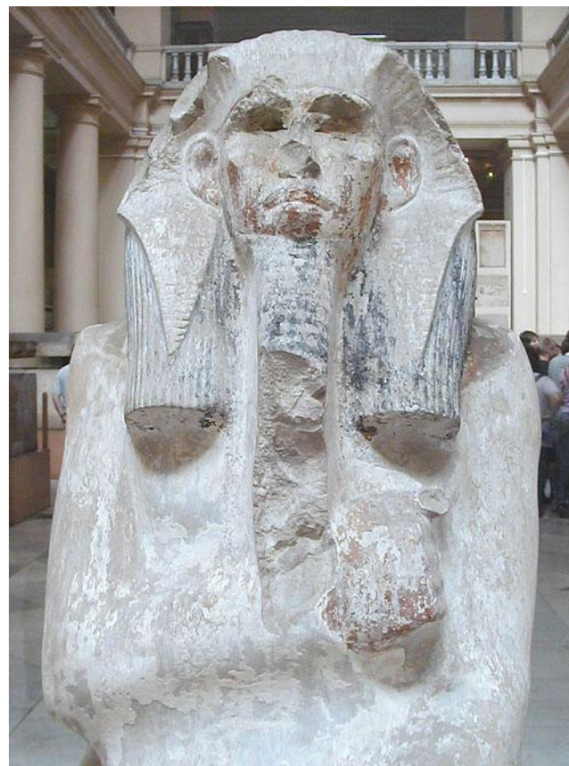
Портретная статуя фараона Джосера (XXVII век до н. э.). Каирский музей