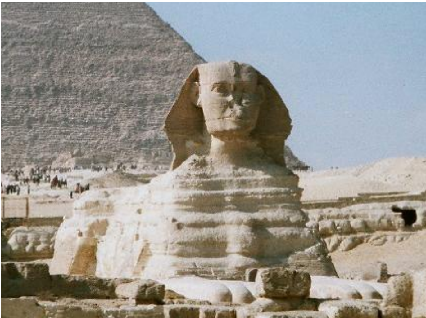
Великий Сфинкс фараона Хефрэна (Ха́фра) в Гíзе (2-я треть XXVI века до н. э.)