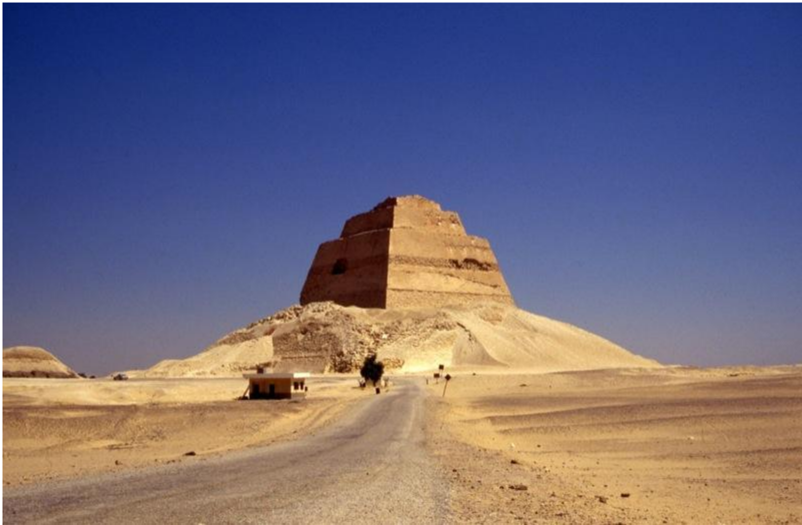
1-я «ступенчатая» пирамида фараона Сно́фру в Мейдúме (конец XXVII – начало XXVI веков до н. э.)