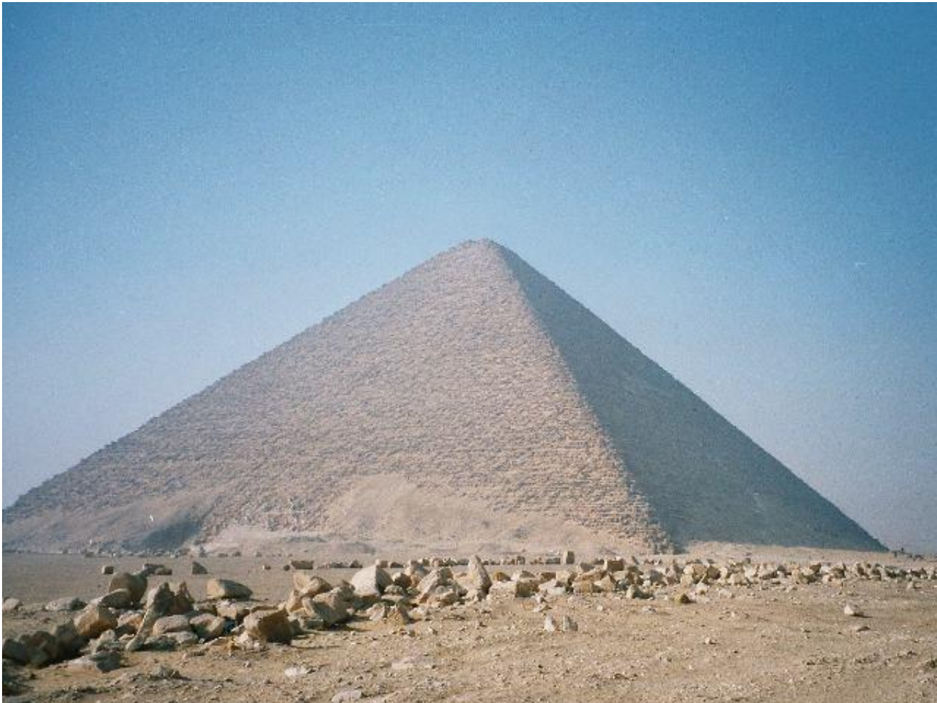
3-я «красная» пирамида фараона Сно́фру в Дахшуре (начало XXVI века до н. э.)