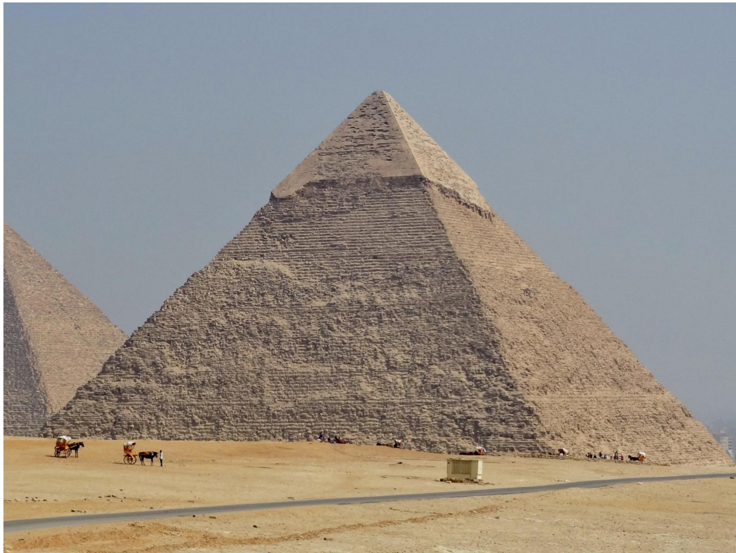
Пирамида фараона Хефрэна (Хáфра) в Гíзе (2-я треть XXVI века до н. э.)