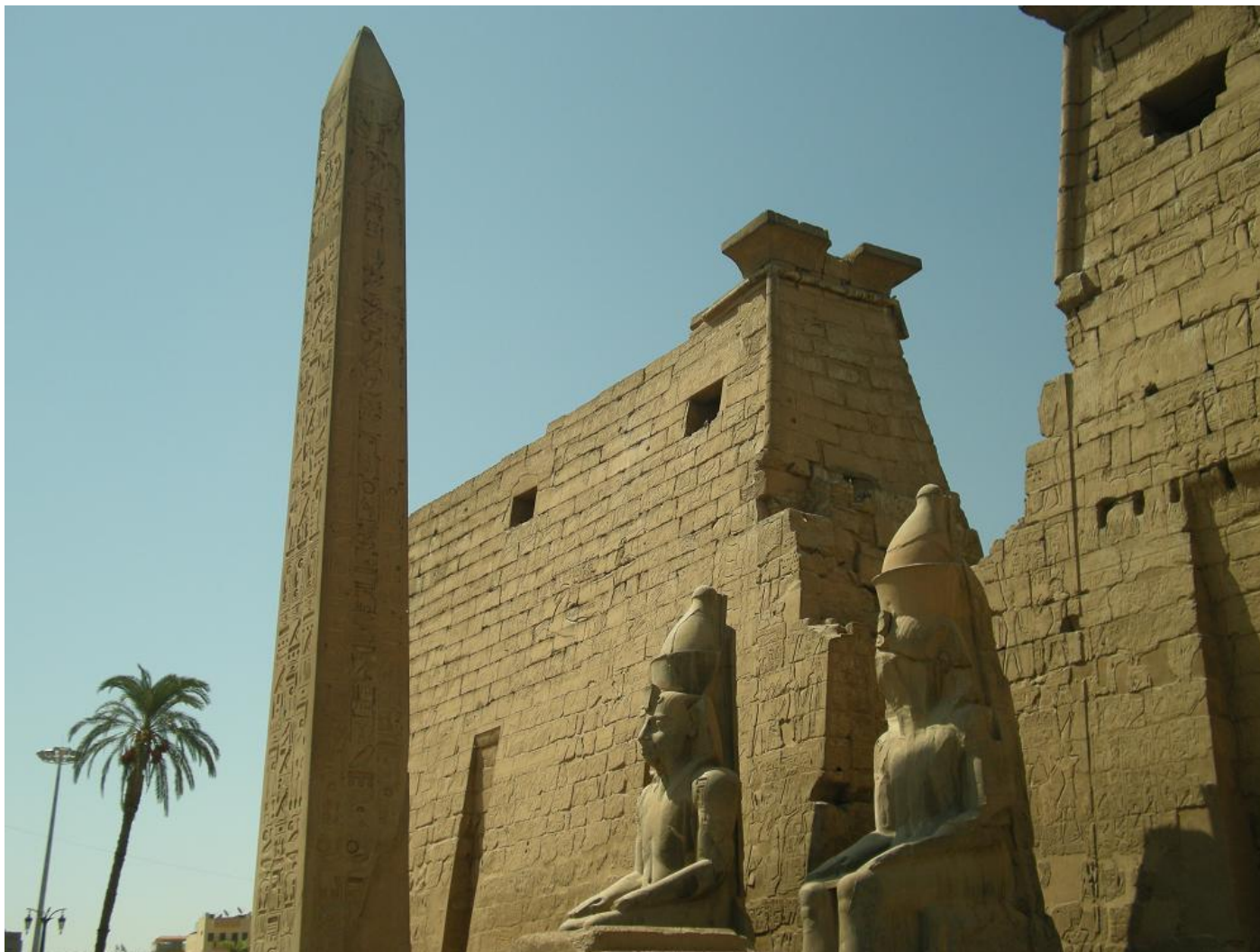
Храм Амона-Ра в Луксоре (XV-XIII века до н. э.)