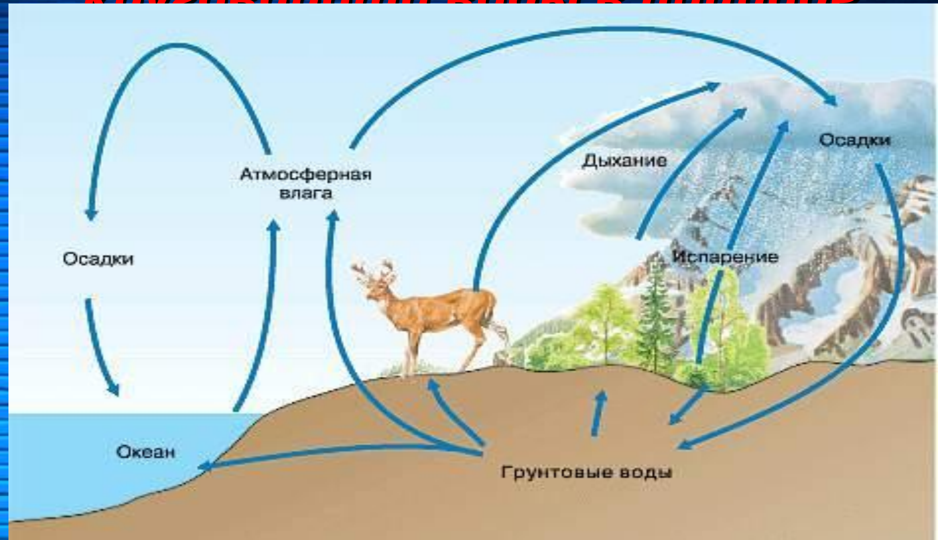
Схема Мирового круговорота воды в природе