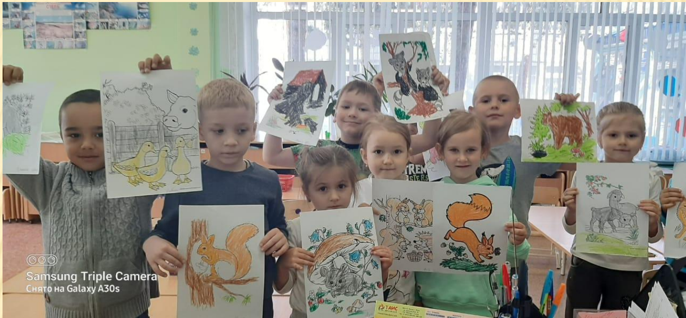
© © © Samsung Triple Camera Снято на Galaxy A30s