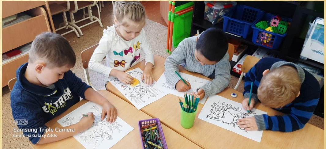
© © © Samsung Triple Camera Снято на Galaxy A30s