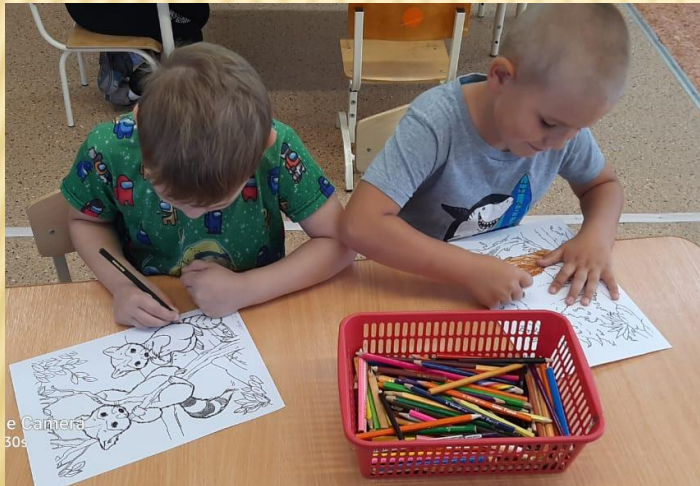
© © © Samsung Triple Camera Снято на Galaxy A30s