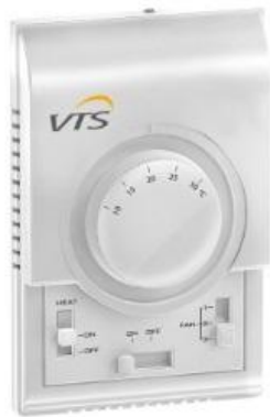
Настенный контроллер WING/ VOLCANO