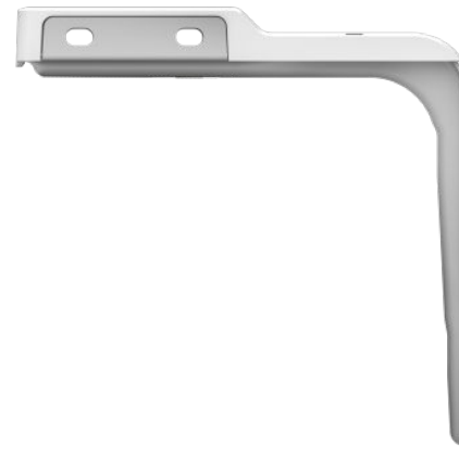
Монтажные крепления - кронштейны