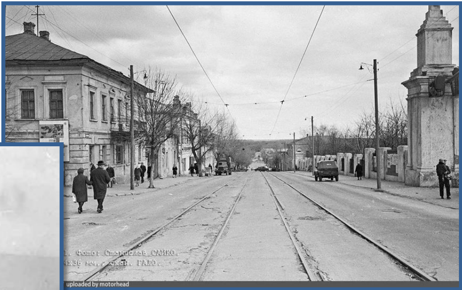
1. Фото: Станислав САЙКО. 4X36 мм, 1/125 с., F1.8, ISO 100. uploaded by motorhead