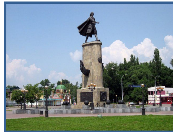
Площадь Петра Великого