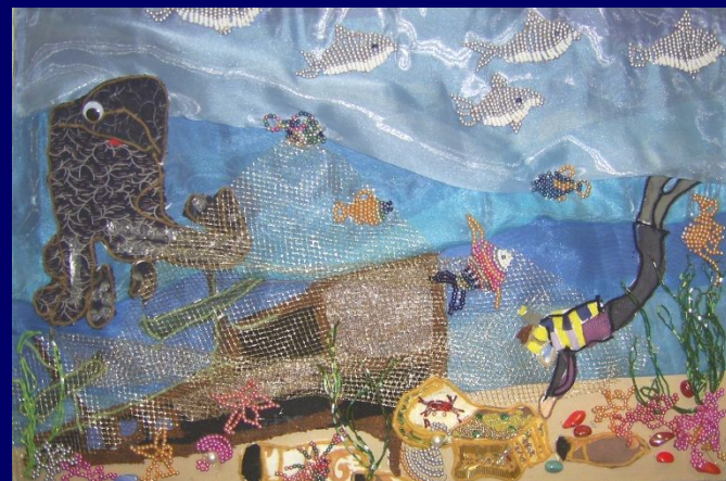
Триптих «Человек и море» выполнен учащимися вторых классов в ходе реализации проекта «В мире природы» по аналогичной схеме. 2009 г.