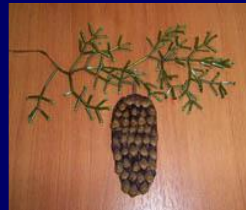
Образцы работы учащихся 2 В класса