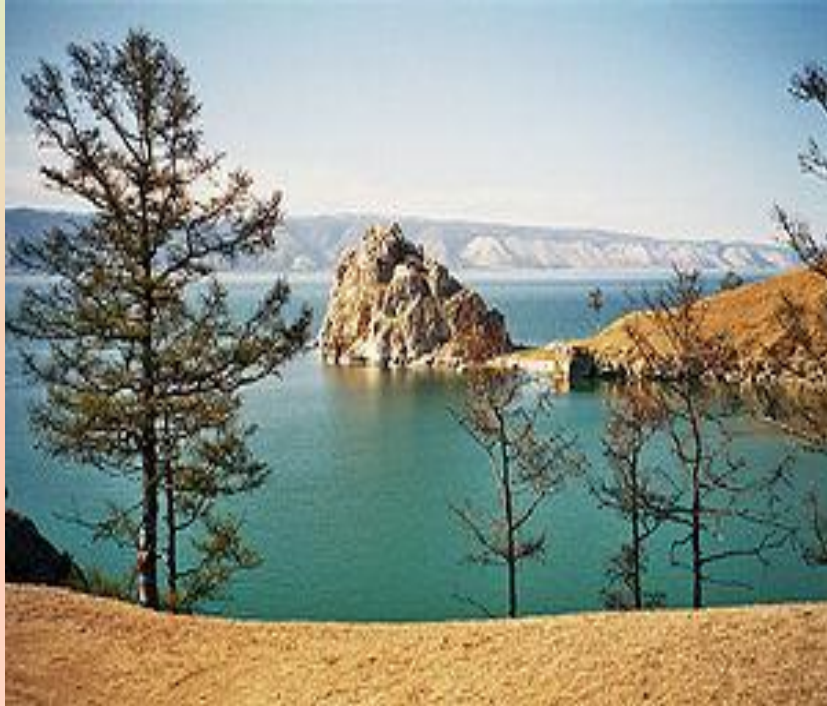
Шаман-скала на острове Ольхон

Байка́л(бур. Байгал далай , Байгал нуур) —озеро тектонического происхождения в южной части Восточной Сибири , глубочайшее озеро планеты Земля, крупнейший природный резервуар пресной воды. Озеро и прибрежные территории отличаются уникальным разнообразием флоры и фауны, бо́льшая часть видов эндемична. Местные жители и многие в России традиционно называют Байкал морем.