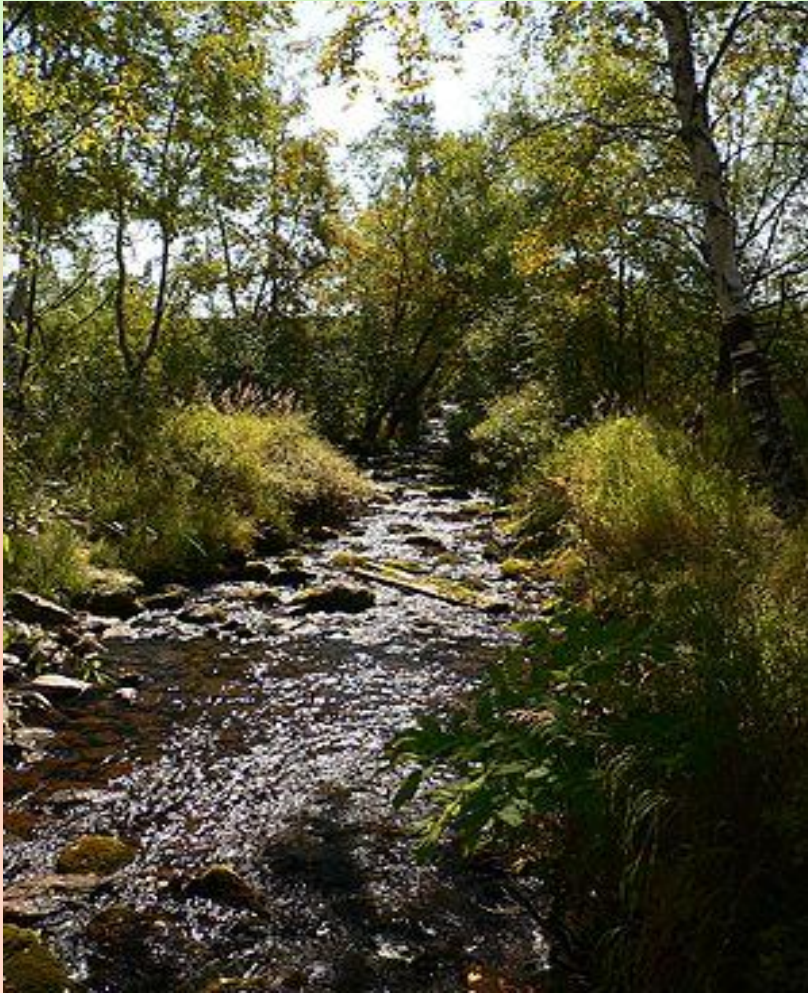
Один из ручьёв, впадающих в Байкал

Запасы воды в Байкале гигантские — 23 615,39 км 3 (около 19 % мировых запасов пресной воды — во всех пресных озёрах мира содержится 123 тыс. км 3 воды). По объёму запасов воды Байкал занимает второе место в мире среди озёр, уступая лишь Каспийскому морю, однако в Каспийском море вода солёная. В Байкале воды больше, чем во всех вместе взятых пяти Великих озёрах, и в 25 раз больше, чем в Ладожском озере.