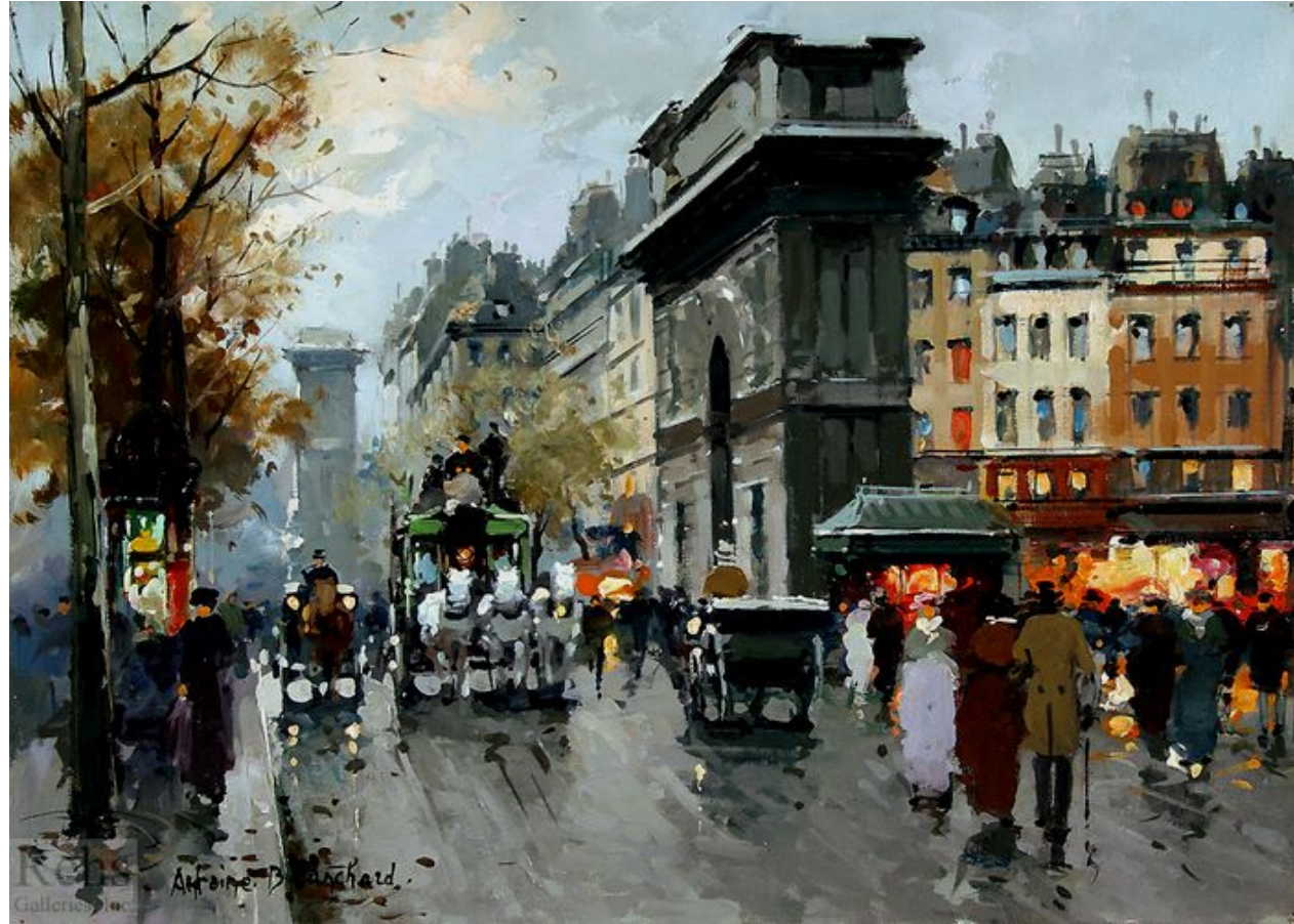
Осенний закат в Париже.