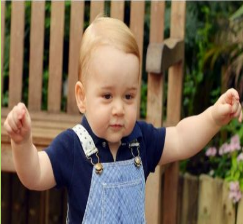
Son [sʌn] ОҒЛУ