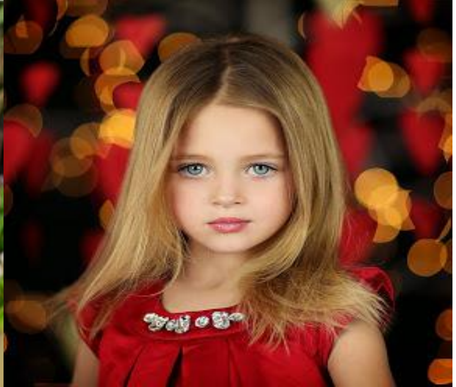
DAUGHTER ['dɔ:tər] УРУУ