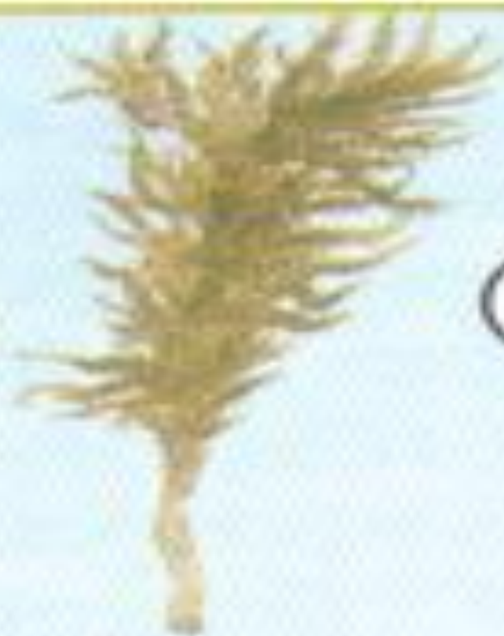
Золотистые водоросли: 1. Тетраспоропсис сетчатый; 2. Гидрурус звонный.