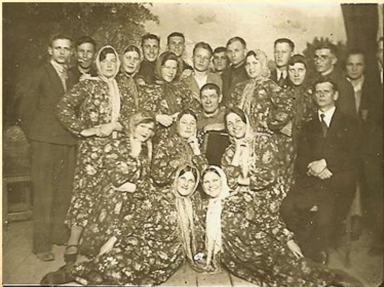
Репетиция художественной самодеятельности. 1939 г.

Кроме студенческого театра, в техникуме работал кружок художественной самодеятельности. Ребята выступали на тематических вечерах, на встречах с работниками базового предприятия.