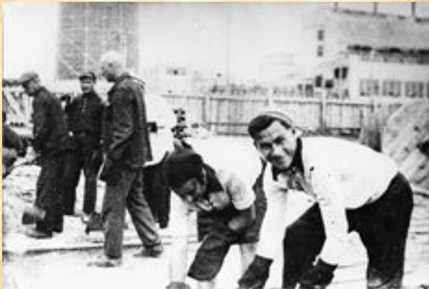
Снимок 1931 года