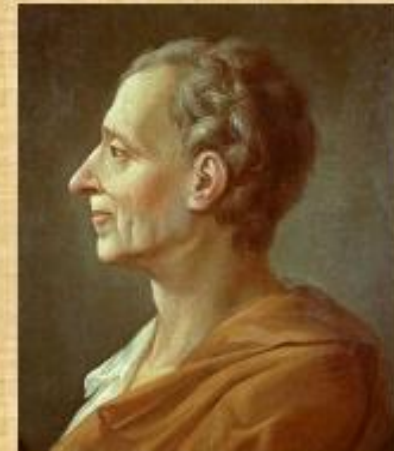
Шарль Луи Монтескье

- изложил теорию разделения властей: исполнительную, законодательную, судебную; - выделял 3 формы правления: республику, монархию, деспотию.