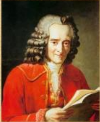
Франсуа Мари Аруэ Вольтер

Вольтер – сторонник просвещенной монархии.