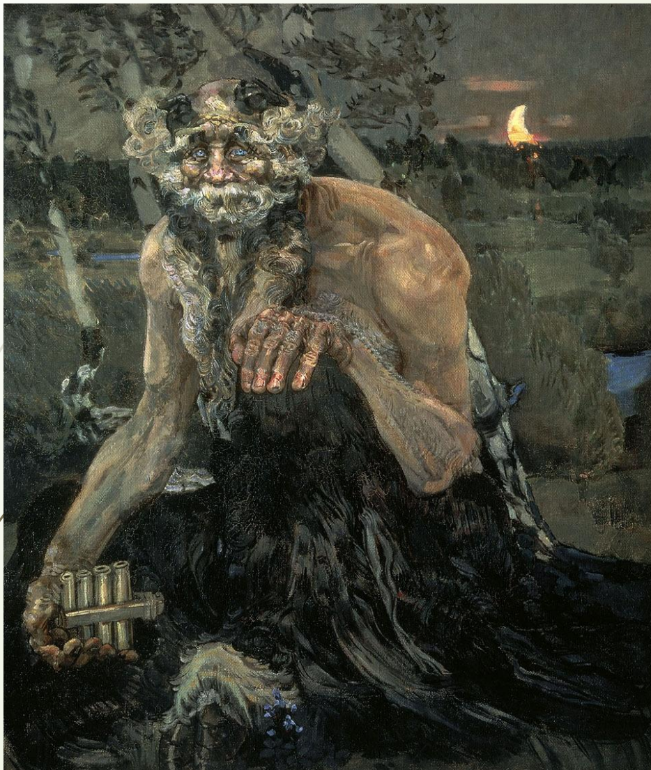
Врубель Михаил Александрович, Пан. 1899, Холст, Масло. 124 × 106 см, Государственная Третьяковская галерея, Москва

□ Врубель в своём творчестве ставил морально-философские вопросы о добре и зле, о месте человека в мире, обращается к «вечным» темам и мотивам, почерпнутым из античности, эпохи средних веков и Возрождения, русского фольклора. Налёт таинственности, загадочности в воплощении этих тем («Пан» 1899г) сближает его творчество с установками представителей символизма.