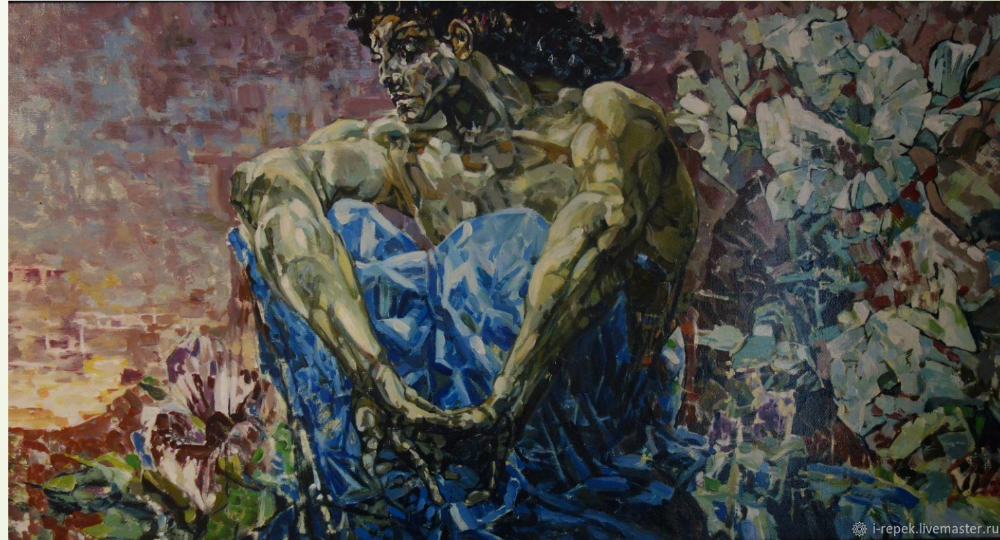
Врубель Михаил Александрович, Демон сидящий, 1890, Холст, Масло. 114 × 211 см, Третьяковская галерея, Москва

□ Картина Врубеля «Демон сидящий» полна символических обобщений. В них идеалы и мечты самого автора. Полотно созданное на сюжет лермонтовской поэмы, было буквально выстрадано художником. Вот как он сам описывает своего «Демона»: «Полуобнажённая, крылатая, молодая, уныло –задумчивая фигура сидит, обняв колени, на фоне заката и смотрит на цветущую поляну, с которой ей протягиваются ветви, гнущиеся под цветами».