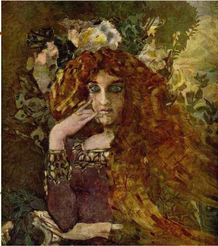
Врубель Михаил Александрович, Муза, Холст, масло, 1896год , Третьяковская галерея.

Реализм Врубеля сочетался с символизмом. В большинстве живописных работ художника двусмысленность ведения и символичность образа всегда присутствовали в ясности сюжетного выбора. Врубель как основоположник неореализма и символизма в живописи был причастен к тому, что получило названия русского модерна. В искусстве Врубеля модерн не определяет высших ценностей ни содержания, ни формы его образов, он несравненно выше и общечеловечнее. Врубель был великим художником. Его творчество помогает нам взглянуть на мир по-новому, помогает понять истинные ценности. Он всё выражал в символе: композицию, цвет. Он был единственный в русской живописи, который дал новую жизнь великим поэтическим символам. Мир Врубеля пронизан «токами духовного напряжения». В этом тайна его долговечности. У Врубеля не было прямых последователей. Символизм в России развивался самостоятельно. Но черты символизма, основы заложенные Врубелем можно увидеть у художников «Голубой розы».