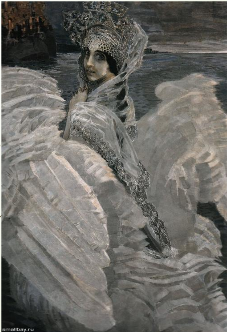
Врубель Михаил Александрович, Царевна-Лебедь. 1900, Холст, масло. 142,5 × 93,5 см, Государственная Третьяковская галерея, Москва