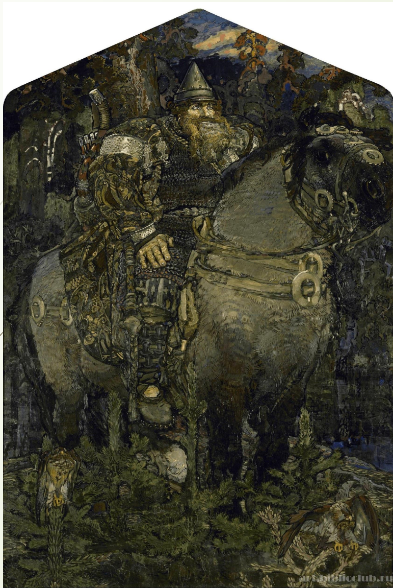
Врубель Михаил Александрович, Богатырь. 1898–1899. Холст, масло. 321,5 x 222 (верх треугольный). Русский музей