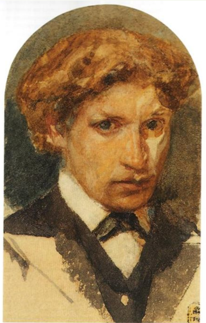
Михаил Александрович Врубель, Автопортрет, Государственный Русский музей, Санкт-Петербург, Автопортрет, 1882, 12.5×8.6 см • Акварель, Бумага