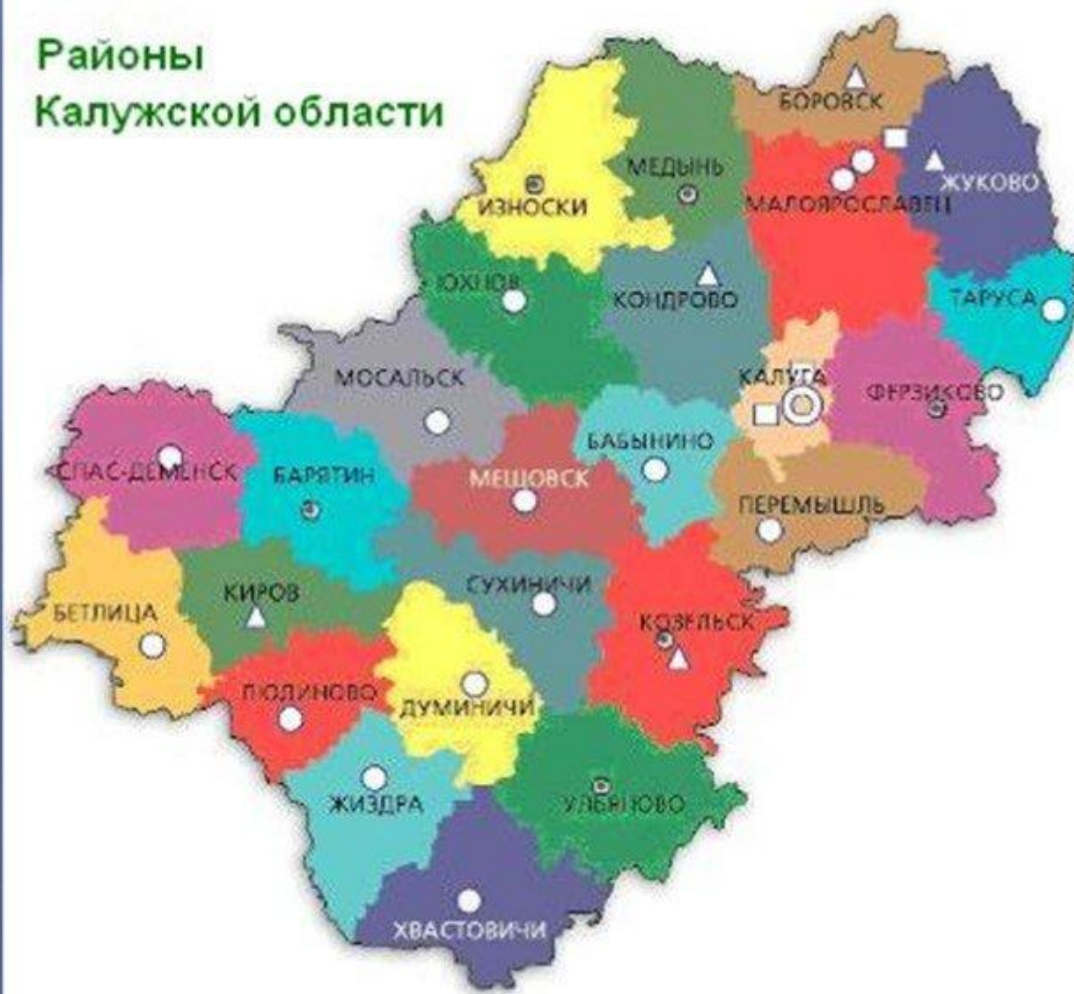
Районы Калужской области