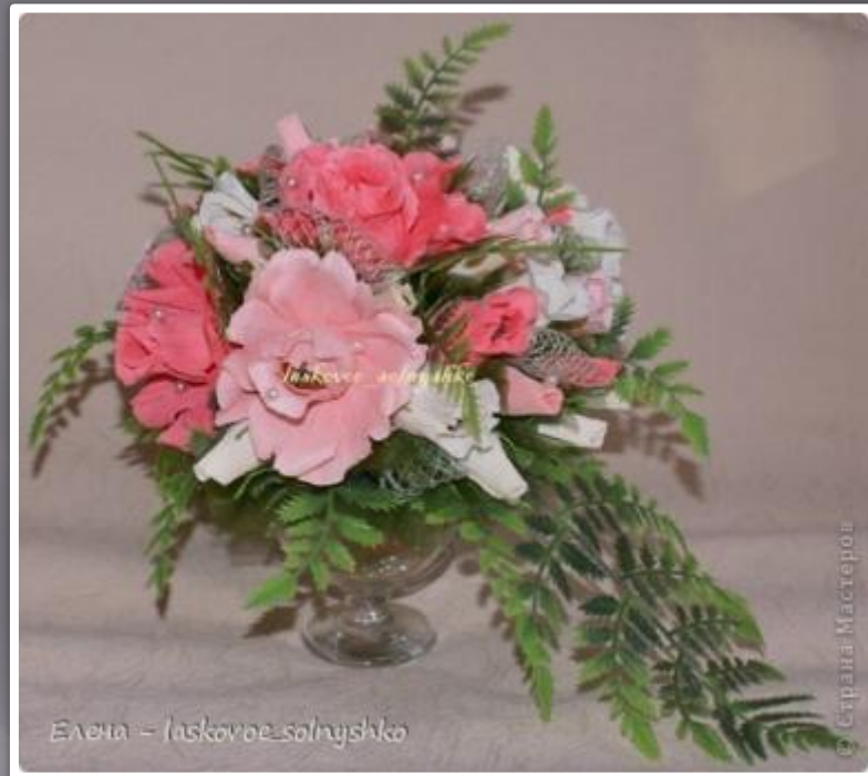
Елена - laskovoe_solnyshko