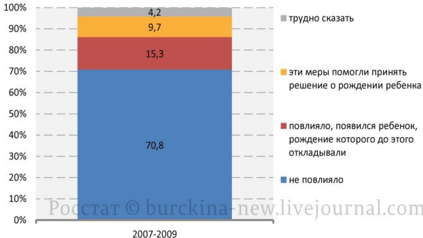
Оценка женщинами влияния маткапитала на решение о рождении 2-го ребенка (%)