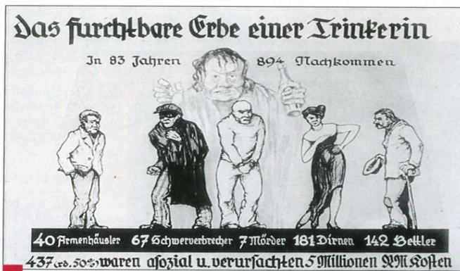
2 « L'effroyable héritage d'une alcoolique ». Dessin de propagande nazie, diffusé dans les écoles. Le texte indique comment, en 83 ans, une femme alcoolique a eu 894 descendants dont 40 ont dû être hébergés dans des hospices pour pauvres, 67 ont été criminels récidivistes, 7 des meurtriers, 181 des prostituées, 142 des mendiants. En tout « 437 (environ 50 %) ont été des asociaux qui occasionnèrent des dépenses d'un montant de 5 millions de Reichsmarks ».

Ce dessin extrait d'un livre pour enfants met en scène un couple qui se rend à la mairie. Quatre situations sont évoquées : – le couple est constitué de 2 personnes de sang allemand : leur enfant est allemand ; – le couple est constitué d'un Allemand et d'une femme de sang aux trois quarts allemand : l'enfant est alors considéré comme allemand ; – le couple est constitué de 2 personnes juives : l'enfant est juif ; – le couple est constitué d'un juif et d'une demi-juive : l'enfant est juif.