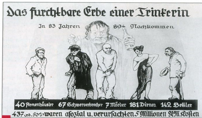
2 « L'effroyable héritage d'une alcoolique ». Dessin de propagande nazie, diffusé dans les écoles. Le texte indique comment, en 83 ans, une femme alcoolique a eu 894 descendants dont 40 ont dû être hébergés dans des hospices pour pauvres, 67 ont été criminels récidivistes, 7 des meurtriers, 181 des prostituées, 142 des mendiants. En tout « 437 (environ 50 %) ont été des asociaux qui occasionnèrent des dépenses d'un montant de 5 millions de Reichsmarks ».

Ce dessin extrait d'un livre pour enfants met en scène un couple qui se rend à la mairie. Quatre situations sont évoquées : – le couple est constitué de 2 personnes de sang allemand : leur enfant est allemand ; – le couple est constitué d'un Allemand et d'une femme de sang aux trois quarts allemand : l'enfant est alors considéré comme allemand ; – le couple est constitué de 2 personnes juives : l'enfant est juif ; – le couple est constitué d'un juif et d'une demi-juive : l'enfant est juif.