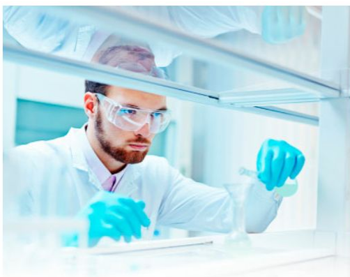
РЕКОМЕНДАЦИЯ НОВЫХ ТЕСТОВ ДЛЯ ДИАГНОСТИКИ РАЗЛИЧНЫХ ЗАБОЛЕВАНИЙ

Спросить совета – это профессионально. Эксперты клинической лабораторной диагностики СИТИЛАБ помогут профильным врачам: