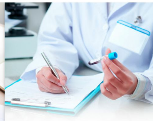
ПРЕДОСТАВЛЕНИЕ УСЛУГИ «ВТОРОЕ МНЕНИЕ»