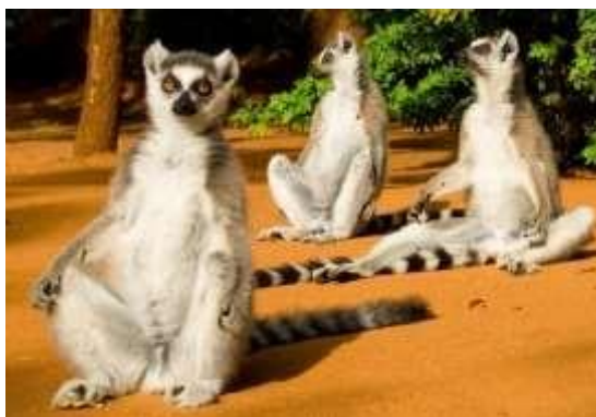
КОШАЧИ ЛЕМУРЫ ПРИНИМАЮТ СОЛНЕЧНЫЕ ВАННЫ