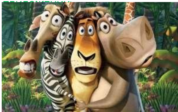
ГЕРОИ МУЛЬТФИЛЬМА «МАДАГАСКАР»

НАБОР КАРТИНОК ДЛЯ БЛОКНЕТОВ-ДНЕВНИКОВ (по КОЛИЧЕСТВУ ДЕТЕЙ) и НАБОР КАРТИНОК для ГРУППОВОГО ПОРТРЕТА (1 ЭКЗЕМПЛЯР) (см. в