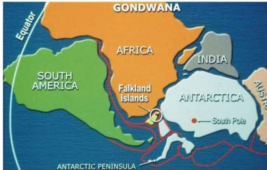
Gondwanaland reconstruction c.400 million years ago