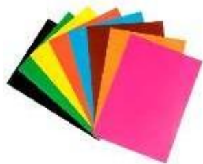
ЦВЕТНАЯ БУМАГА ДЛЯ ФОНА