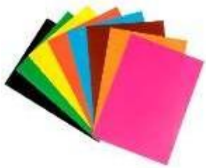
ЦВЕТНАЯ БУМАГА ДЛЯ ФОНА