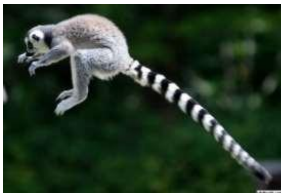
КОШАЧИЙ ЛЕМУР ПРЫГАЕТ