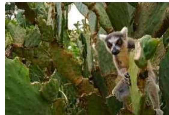
КОШАЧИЙ ЛЕМУР ЗАВТРАКАЕТ КАКТУСОМ