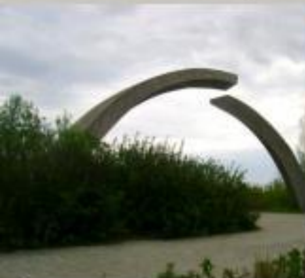
Памятник в честь разрыва блокады Ленинграда!