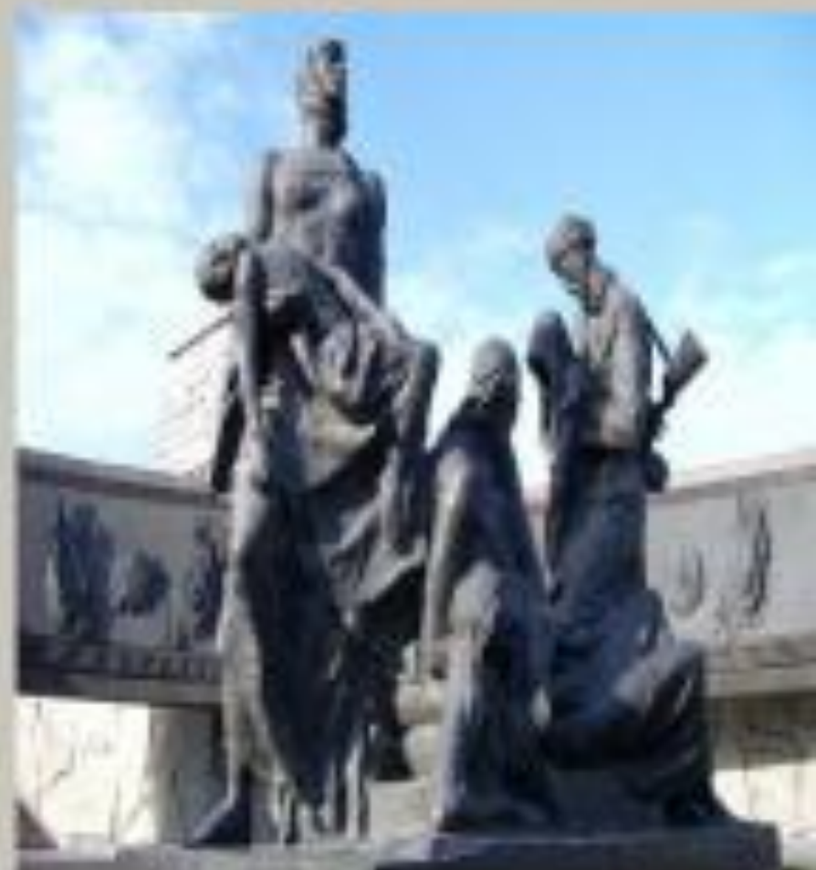
Памятник героическим защитникам блокадного Ленинграда