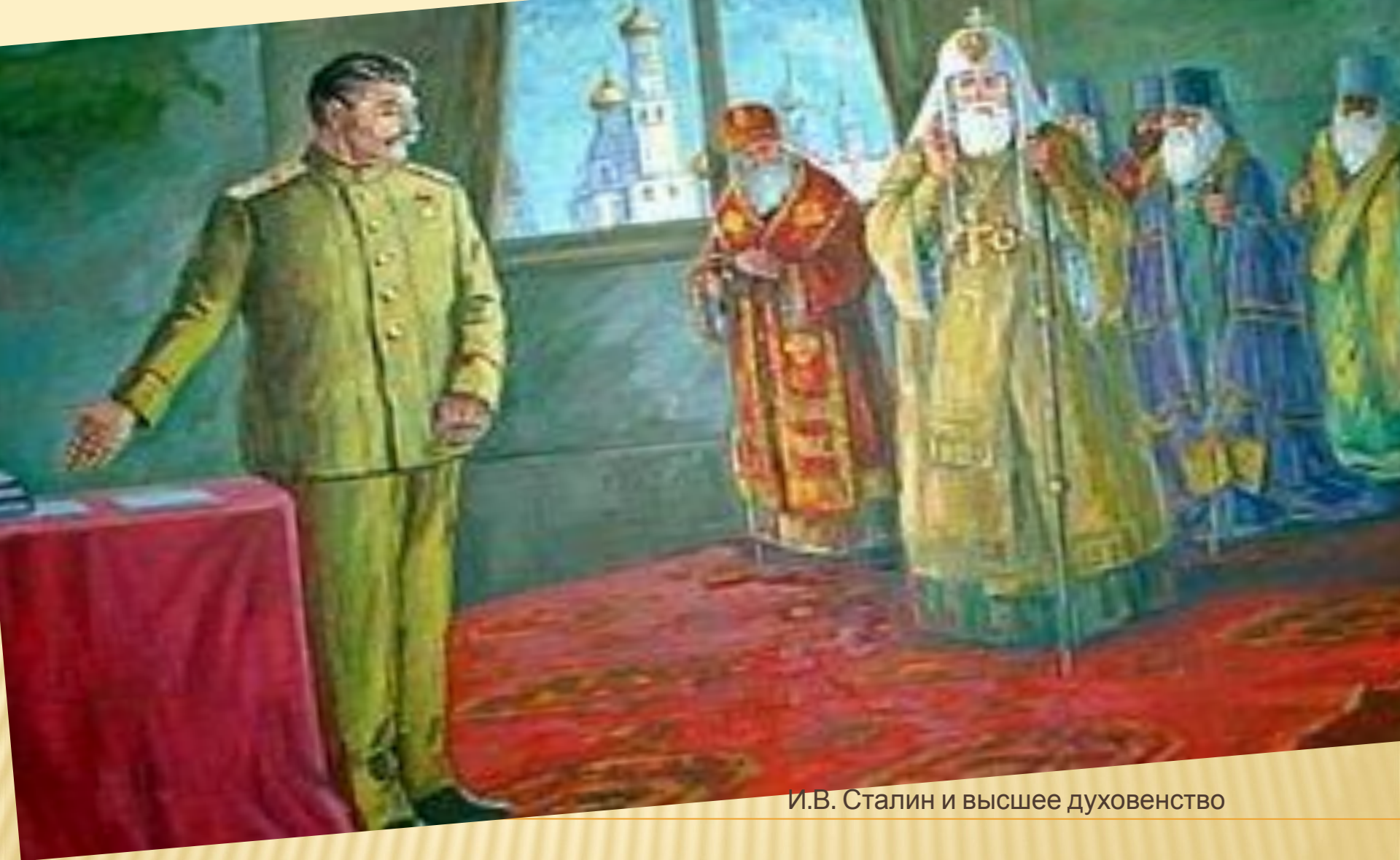
И.В. Сталин и высшее духовенство

Война заставила Советскую власть изменить отношение к Православной Церкви