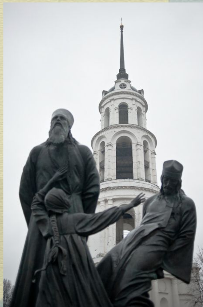
Памятник священнослужителям и мирянам Русской Православной Церкви

Руководившие страной революционеры – большевики объявили Церковь и религию своими врагами. На долгие годы воцарил в стране атеизм – отрицание веры и Бога