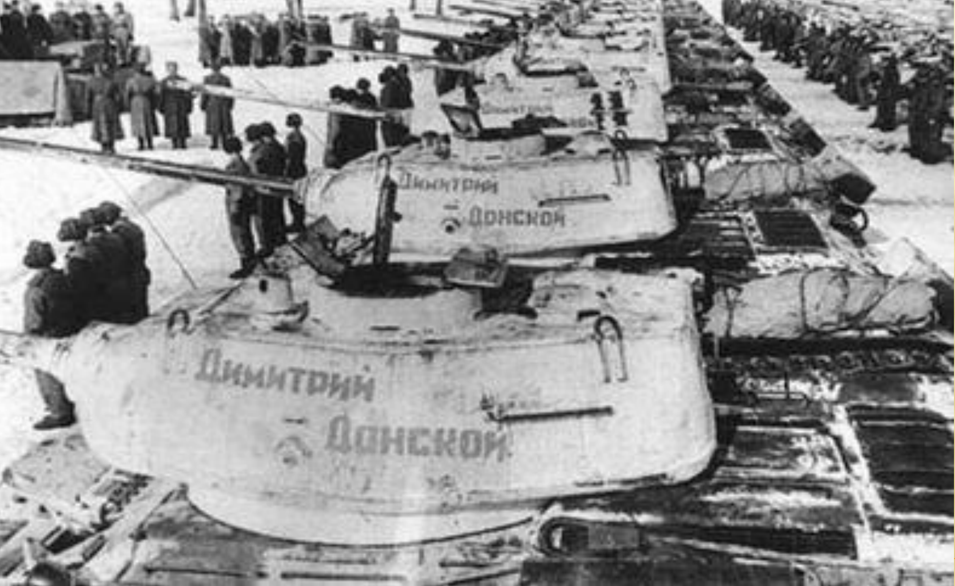
Танковая колонна Димитрия Донского, построена на собранные церковью средства прихожан