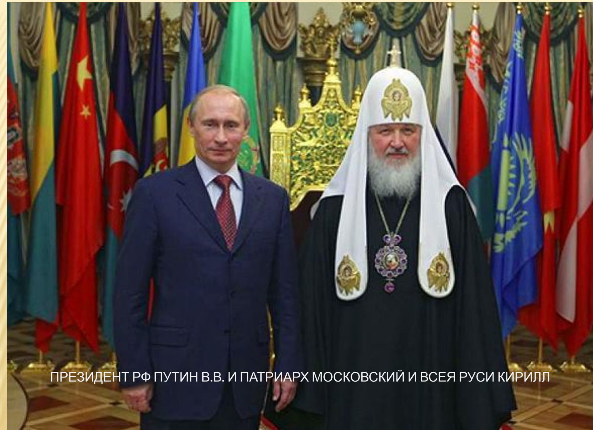
ПРЕЗИДЕНТ РФ ПУТИН В.В. И ПАТРИАРХ МОСКОВСКИЙ И ВСЕЯ РУСИ КИРИЛЛ