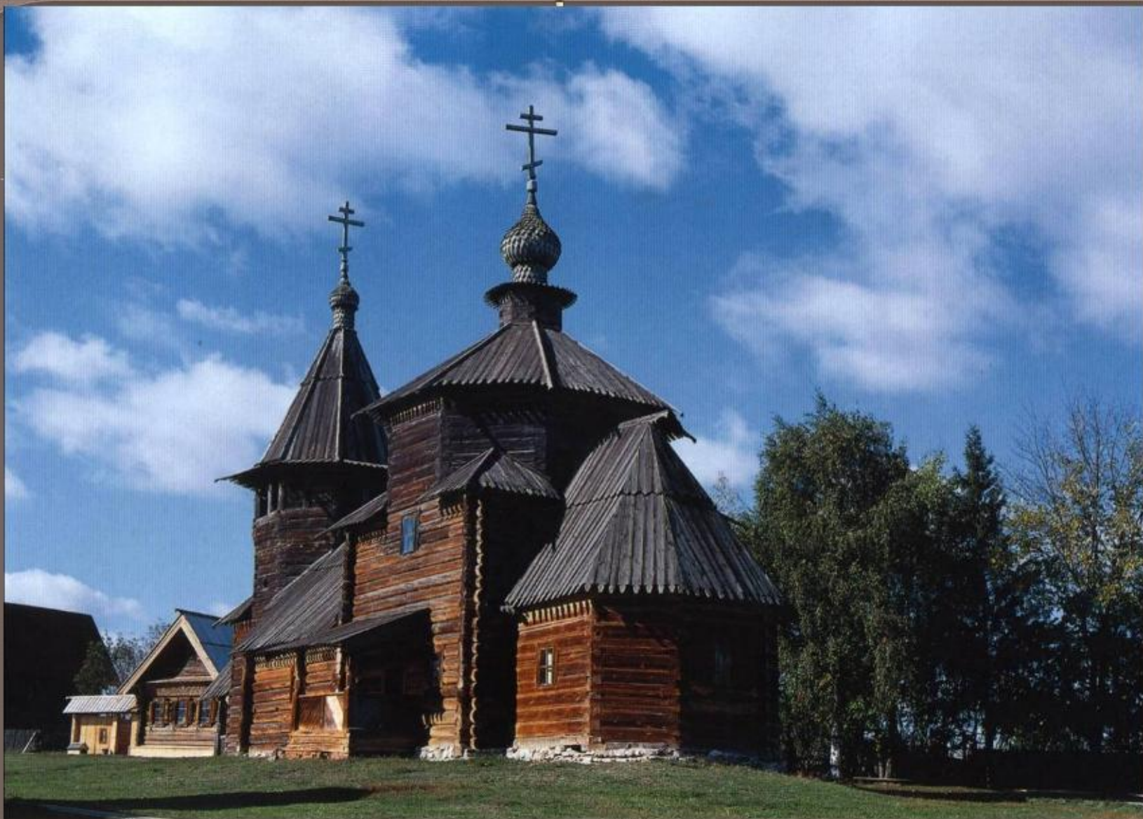
Церковь Воскресения. 1776 год. Суздаль. Музей деревянного зодчества