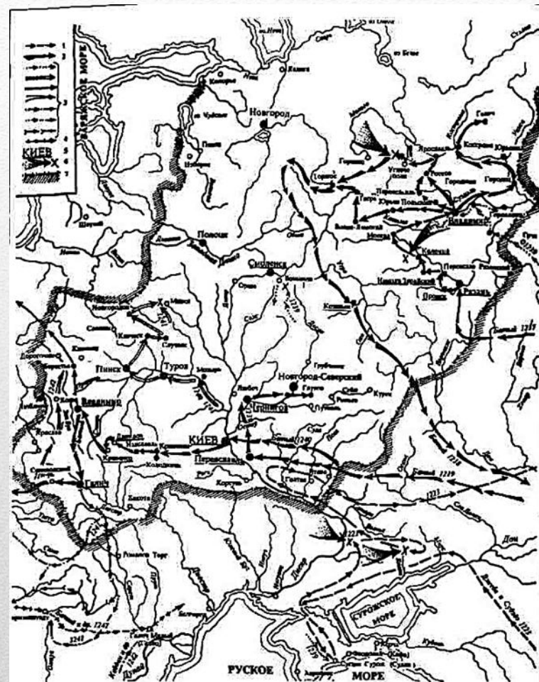
Рис. 42. Монголо-татарское нашествие на Русь.

В 1054 г., в год смерти Ярослава Мудрого на южных рубежах Руси появилась новая опасность – многочисленные племена половцев , или куманов, как их называли в Европе. Отношения с этими степными племенами со временем менялись - от жестокого противоборства, особенно в начале XII века - до создания совместных военно-политических и династических союзов в начале XIII века. В первой трети XIII века на рубежах северо-восточной Руси появились полчища татаро-монголов . Осенью 1237 года они вошли в пределы Рязанского княжества и в течение осени–зимы 1237/38г. подвергли опустошительному разорению Рязанщину и весь Владимиро- Суздальский край. Летом 1240 года татаро-монголы двинулись на запад.