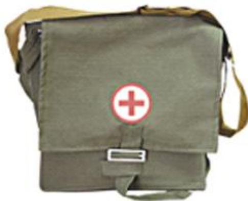
Сумка санитарная санинструктора сандружинника