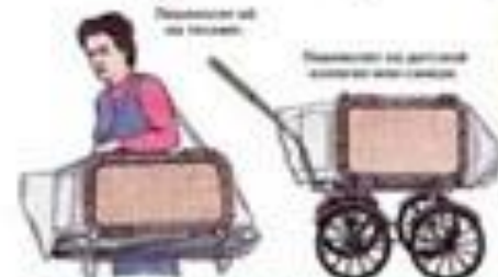
Пользоваться так же как и взрослым.

В комплект входит: 1 - корпус; 2 - корпус дачки-предохранителя; 3 - защитный козырек; 4 - корпус; 5 - корпус; 6 - корпус; 7 - корпус;