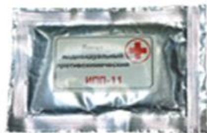
Пакет перевязочный индивидуальный ИПП-11