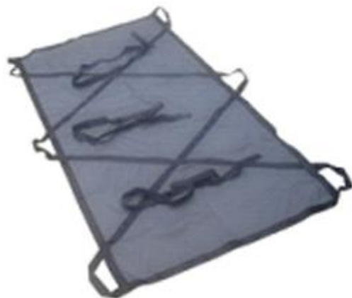
Носилки тканевые МЧС