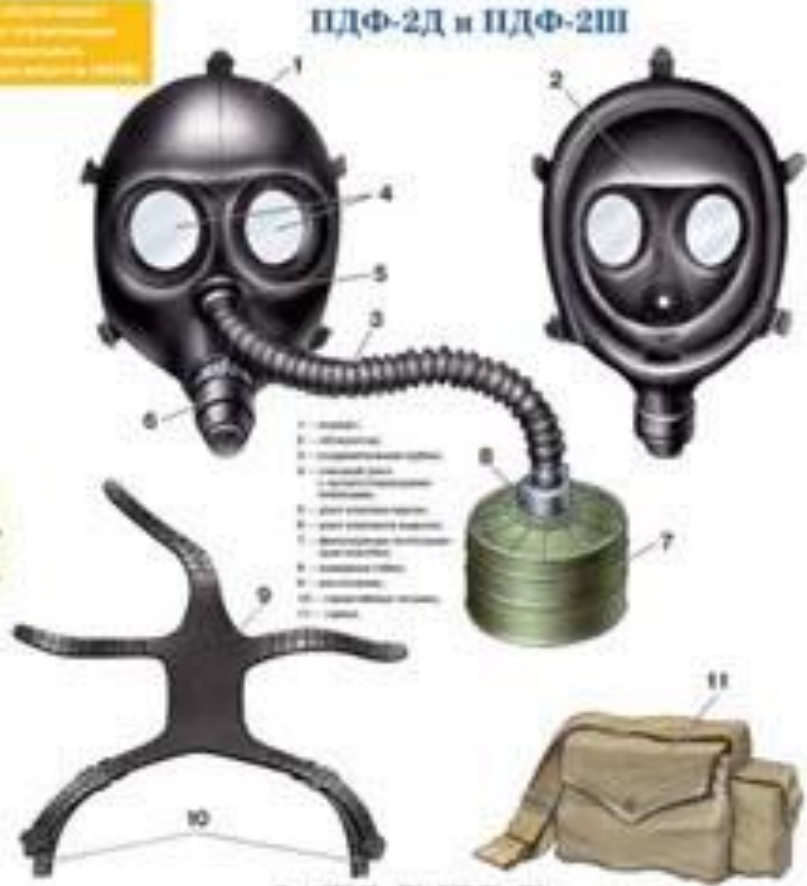
ПДФ-2Д и ПДФ-2Ш

В комплект входит: 1 - корпус; 2 - корпус дачки-предохранителя; 3 - защитный козырек; 4 - корпус; 5 - корпус; 6 - корпус; 7 - корпус;