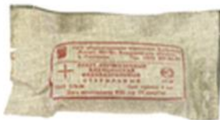
Пакет перевязочный индивидуальный ИПП-1