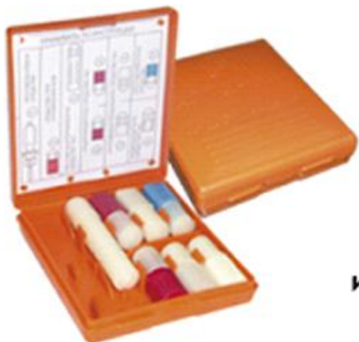
Аптечка индивидуальная АИ-2