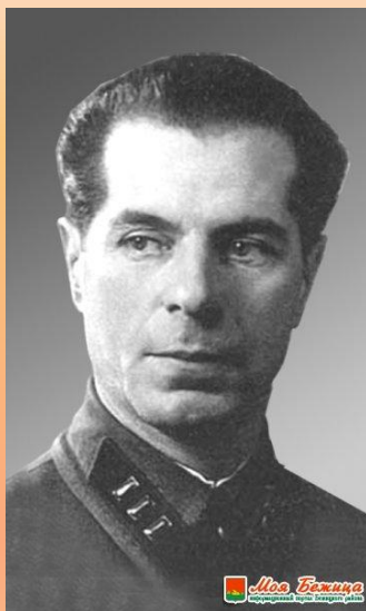
Дмитрий Николаевич Медведев (1898—1954) — чекист, партизан, писатель, Герой Советского Союза (1944)