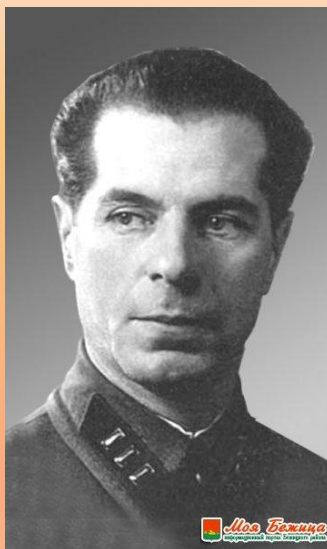
Дмитрий Николаевич Медведев (1898—1954) — чекист, партизан, писатель, Герой Советского Союза (1944)