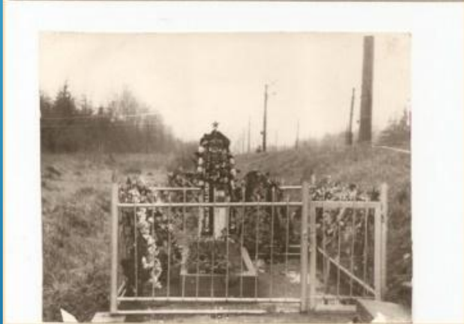
ПАМЯТНИК НА МЕСТЕ ГИБЕЛИ ГЕРОЯ