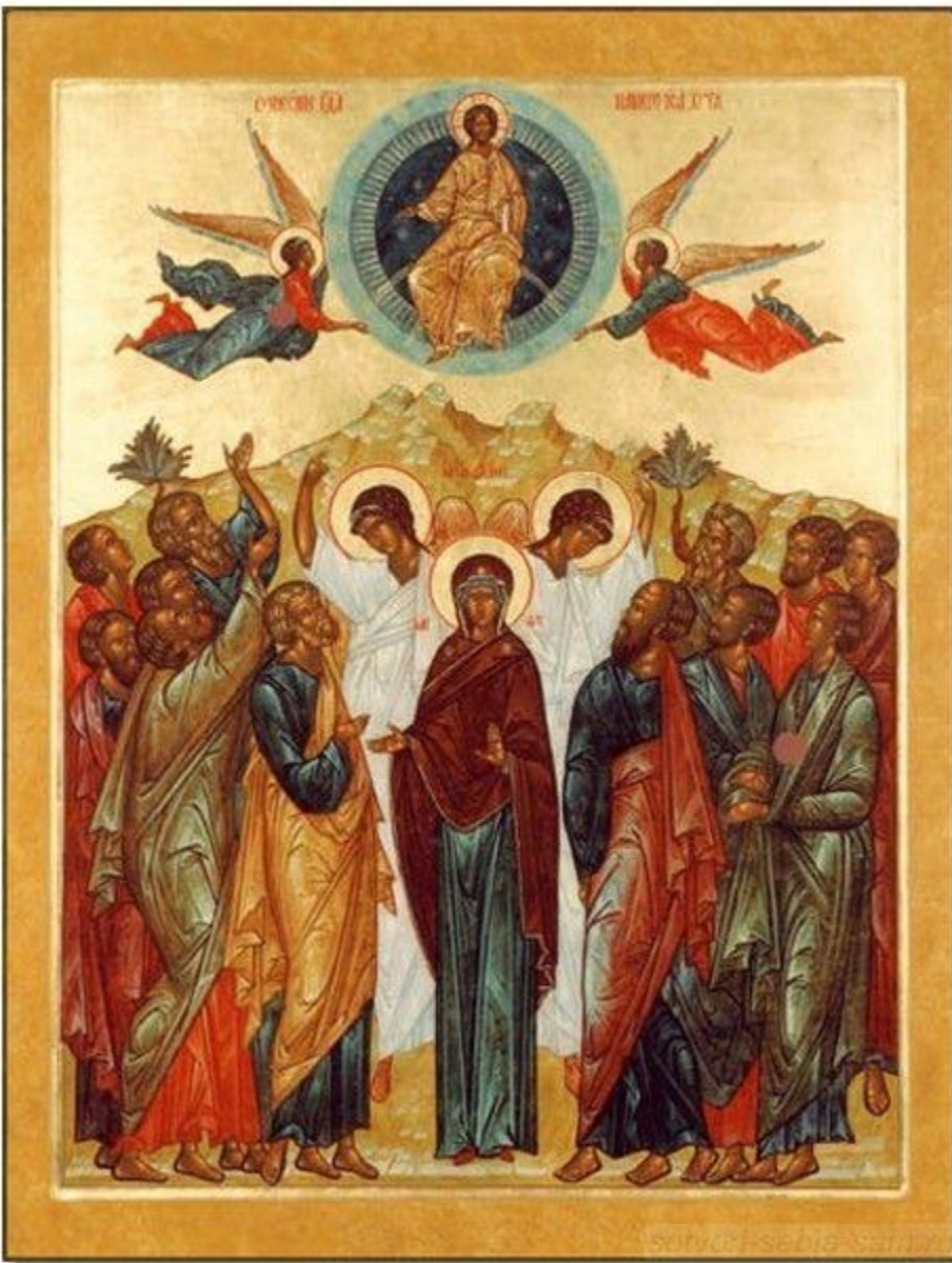
Современная версия иконы Андрея Рублева "Вознесение"

Иконографическая традиция праздника Вознесения имеет одну важную особенность – она следует не за Евангелием, а за праздничным богослужением, в котором центральной фигурой является Богородица, хотя согласно Евангелию Ее в момент Вознесения не было рядом с апостолами.