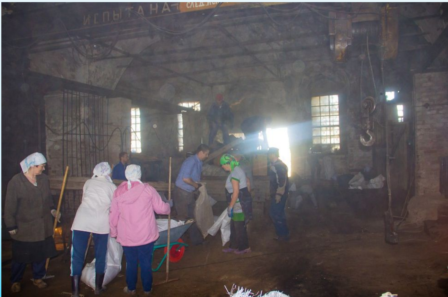
Христорождественская церковь. 11-12 июня 2017 года