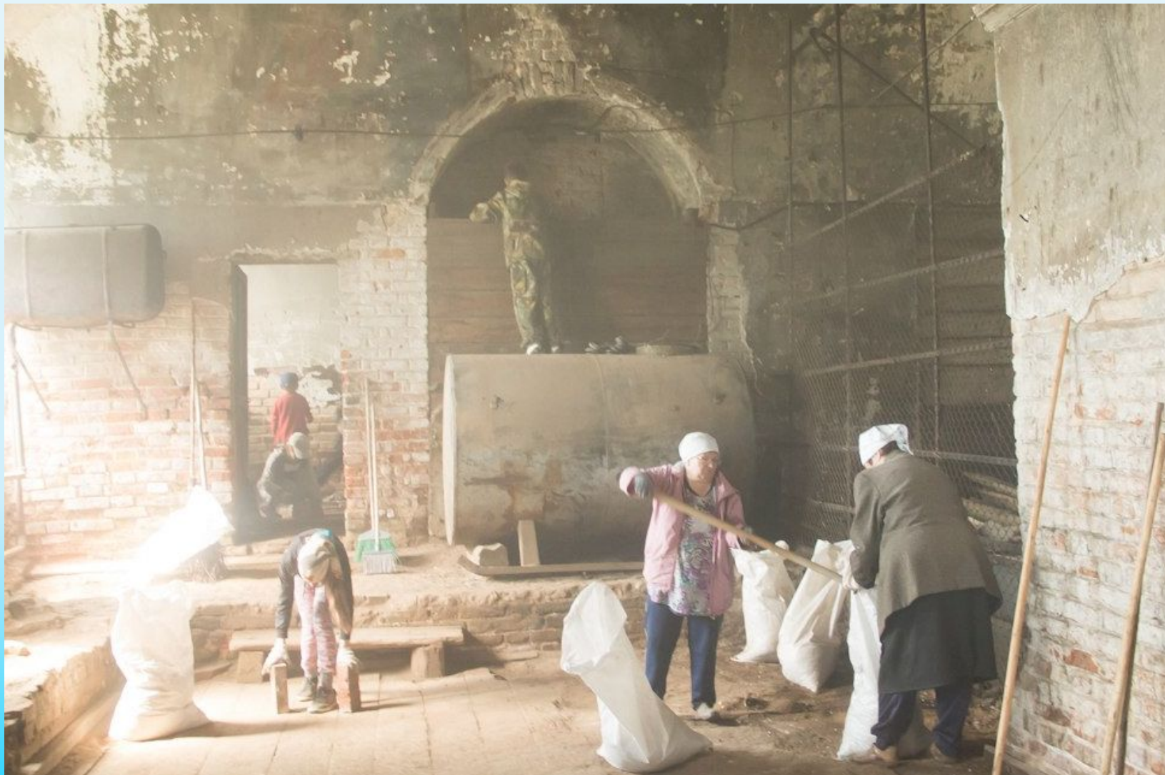
Христорождественская церковь. 11-12 июня 2017 года

В преддверии знаменательного праздника - дня России 11-12 июня 2017 года желающие помочь восстановлению храма люди из городов: Кирова, Слободского, Мурыгино, Кирово-Чепецка, Богородска, республики Коми собрались на генеральную уборку заброшенного храма и прихрамовой территории.