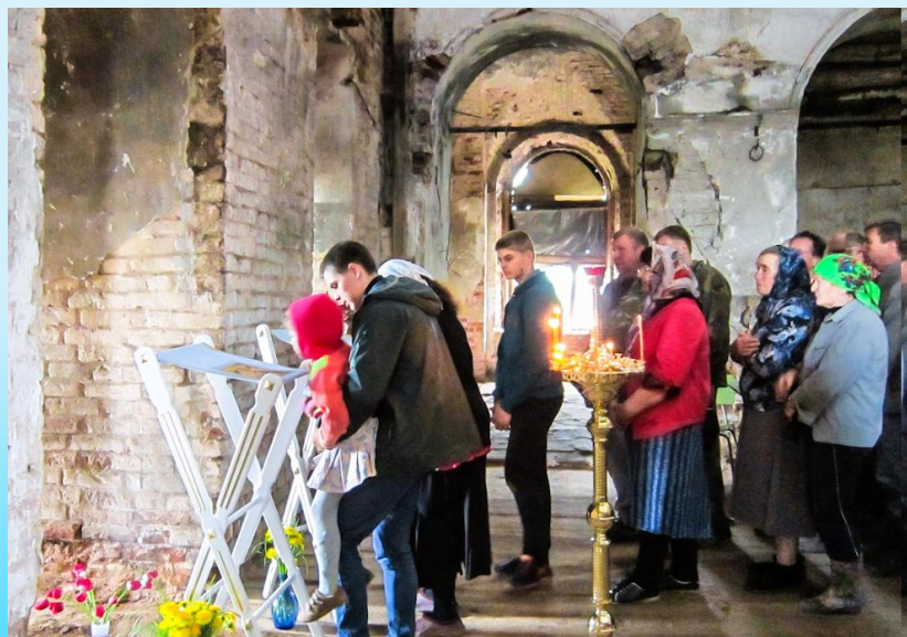
23 февраля, 8 мая, 12 июня 2017 года состоялись первые Молебны в храме. На фото Молебен Николаю Чудотворцу. Христорождественская церковь. Село Рождественское Богородского района Кировской области. 12 июня 2017 года.