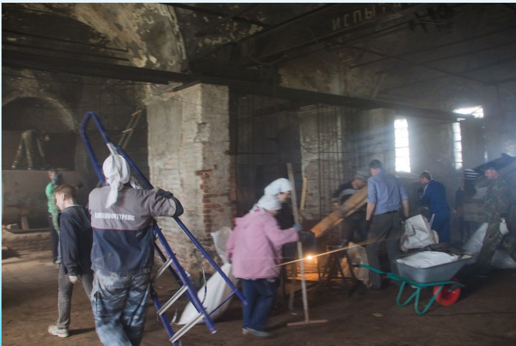
Христорождественская церковь. 11-12 июня 2017 года