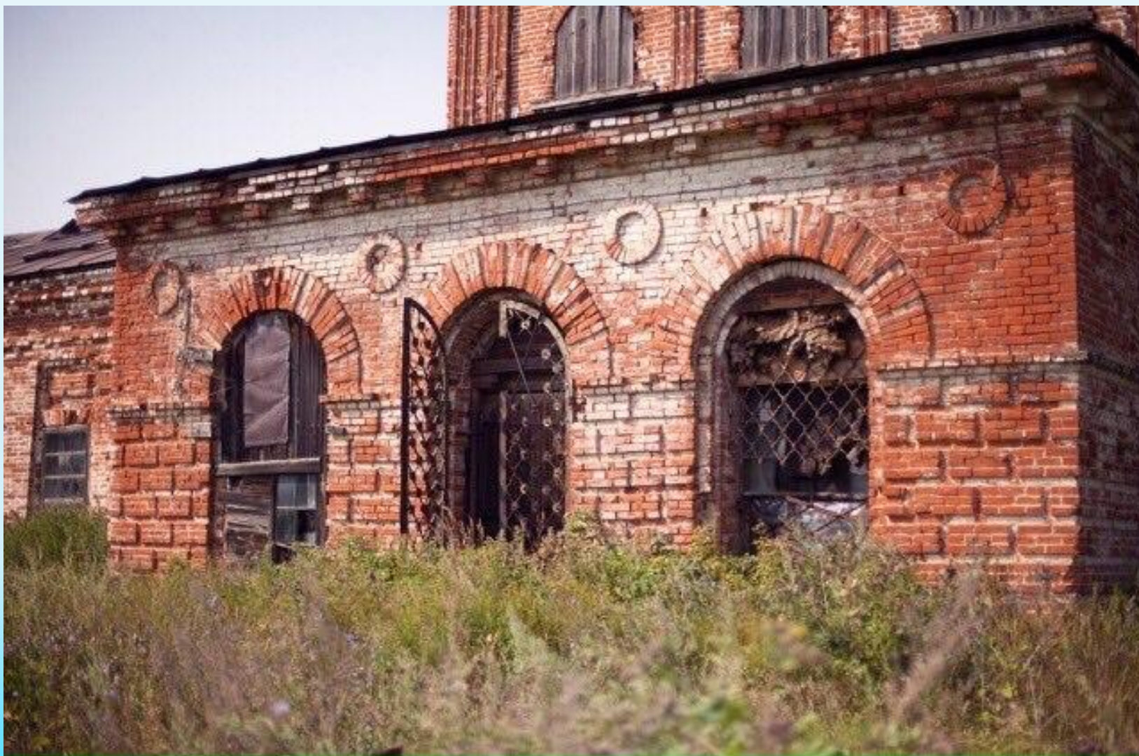
Христорождественская церковь. июнь 2017 года