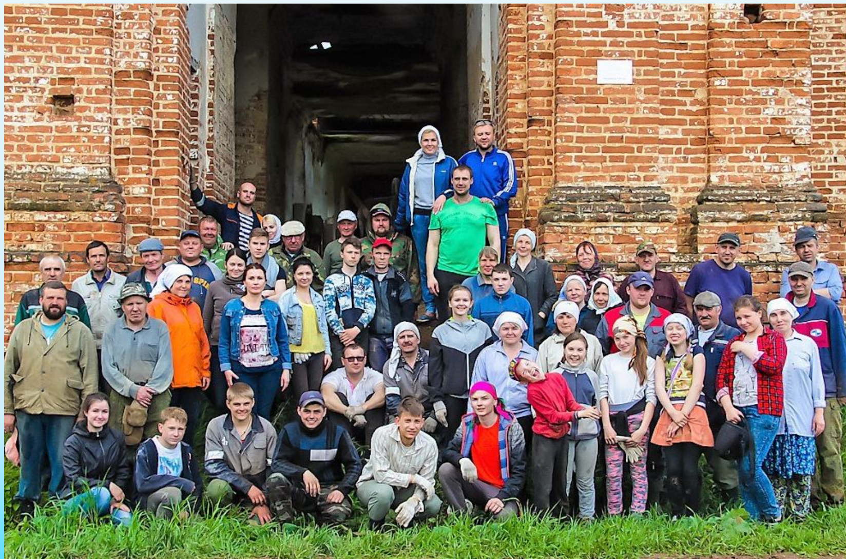
Христорождественская церковь. 11 июня 2017 года