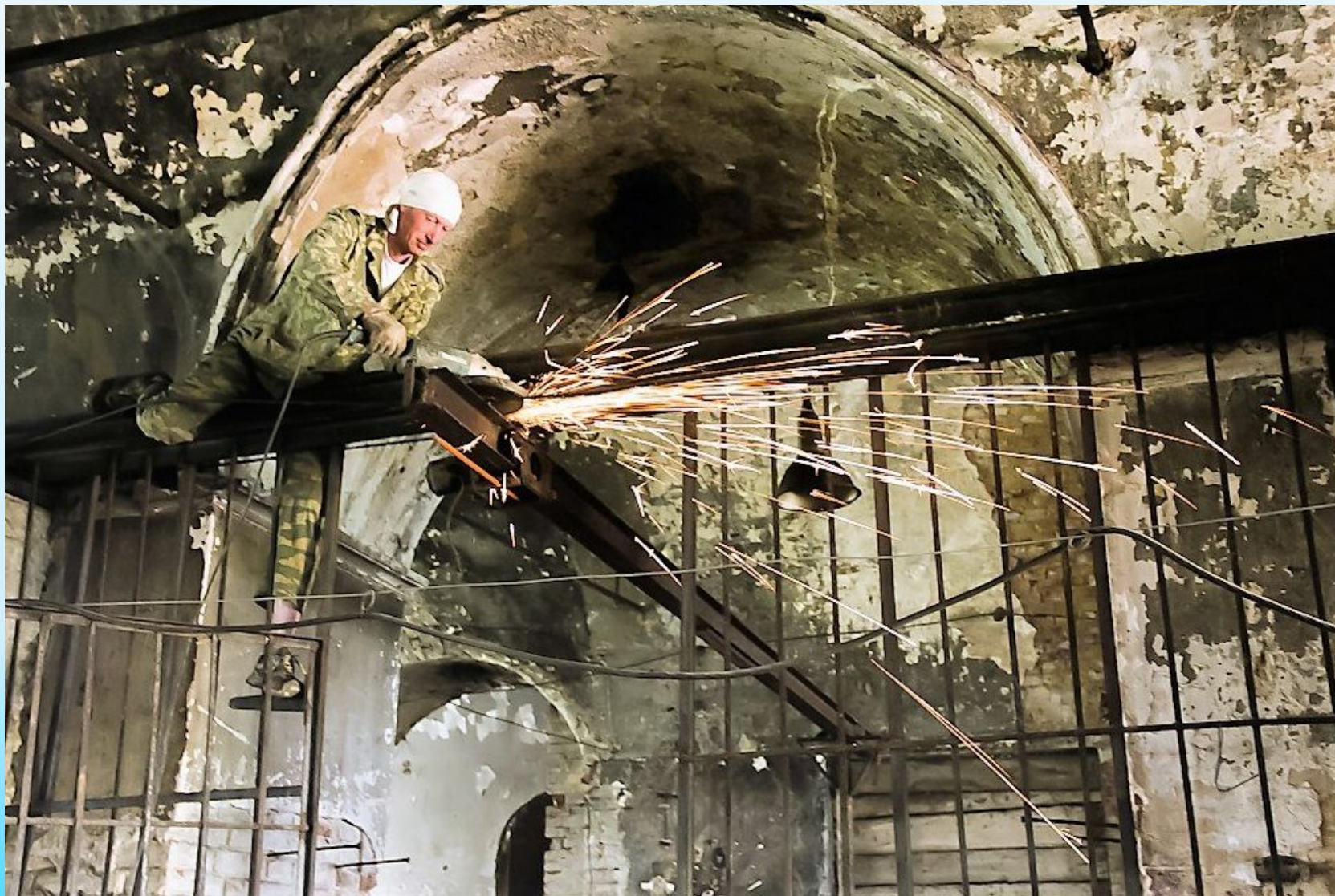
Христорождественская церковь. 11-12 июня 2017 года