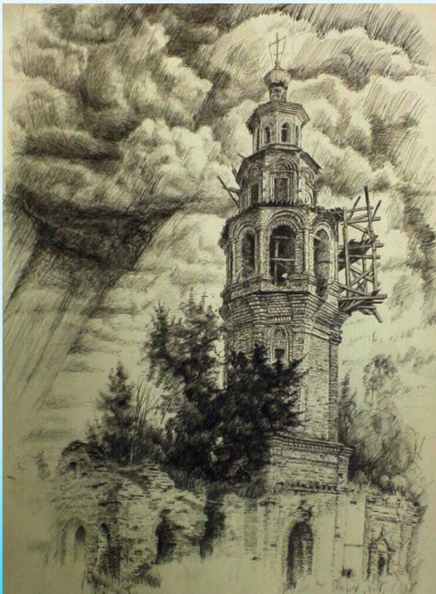
Кировская область. Богородский район. Село Рождественское. Христорожественская церковь.