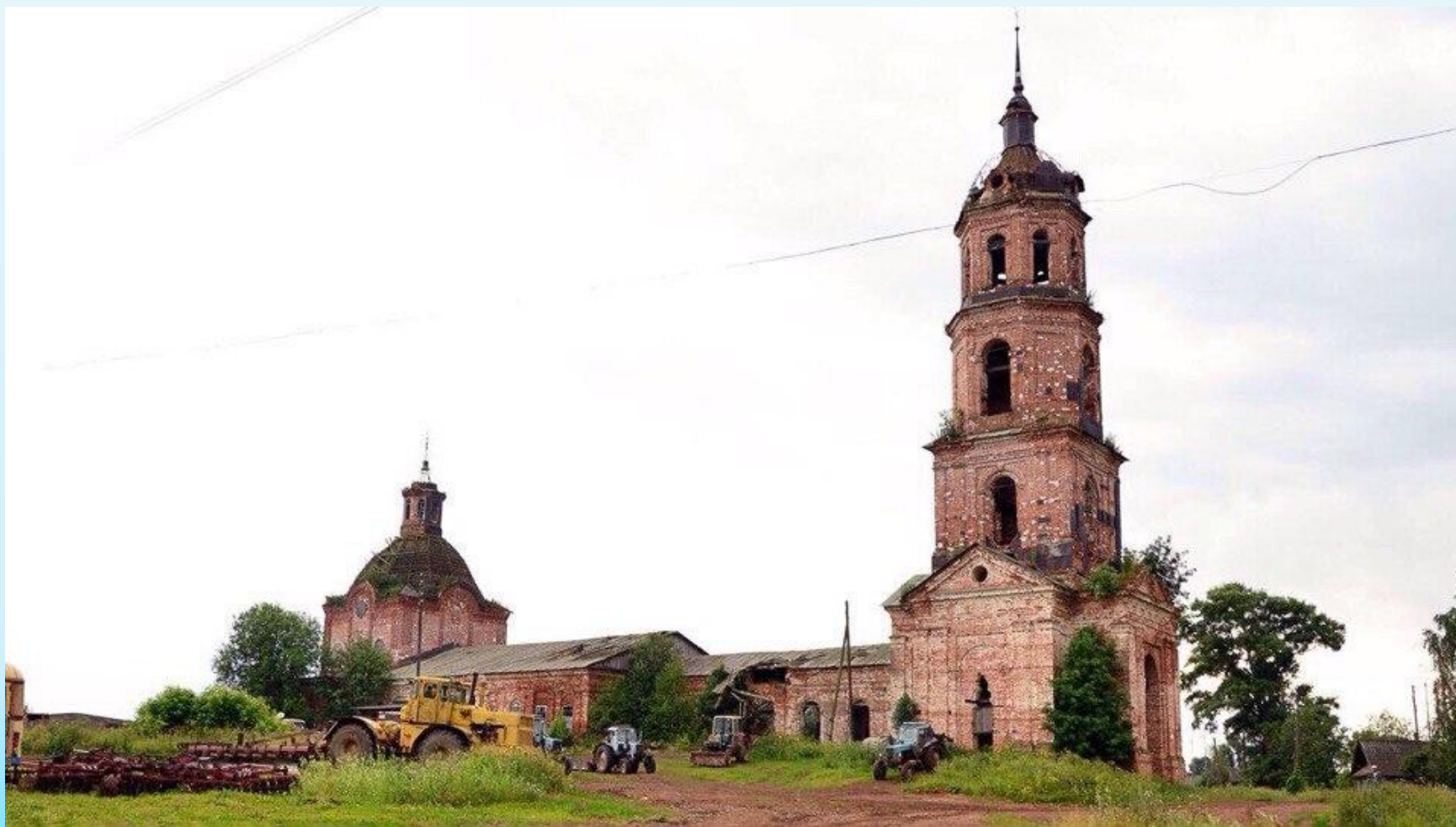
Христорождественская церковь в наши дни. Фото 2017 г.