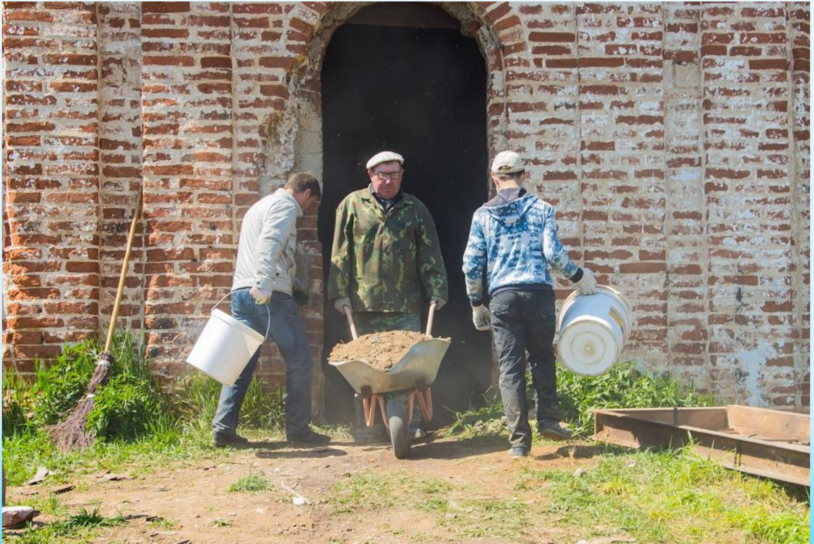
Христорождественская церковь. 11-12 июня 2017 года