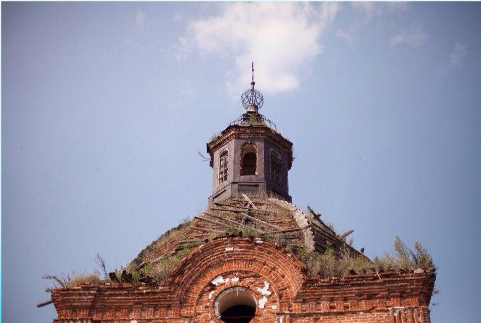
Христорождественская церковь. июнь 2017 года