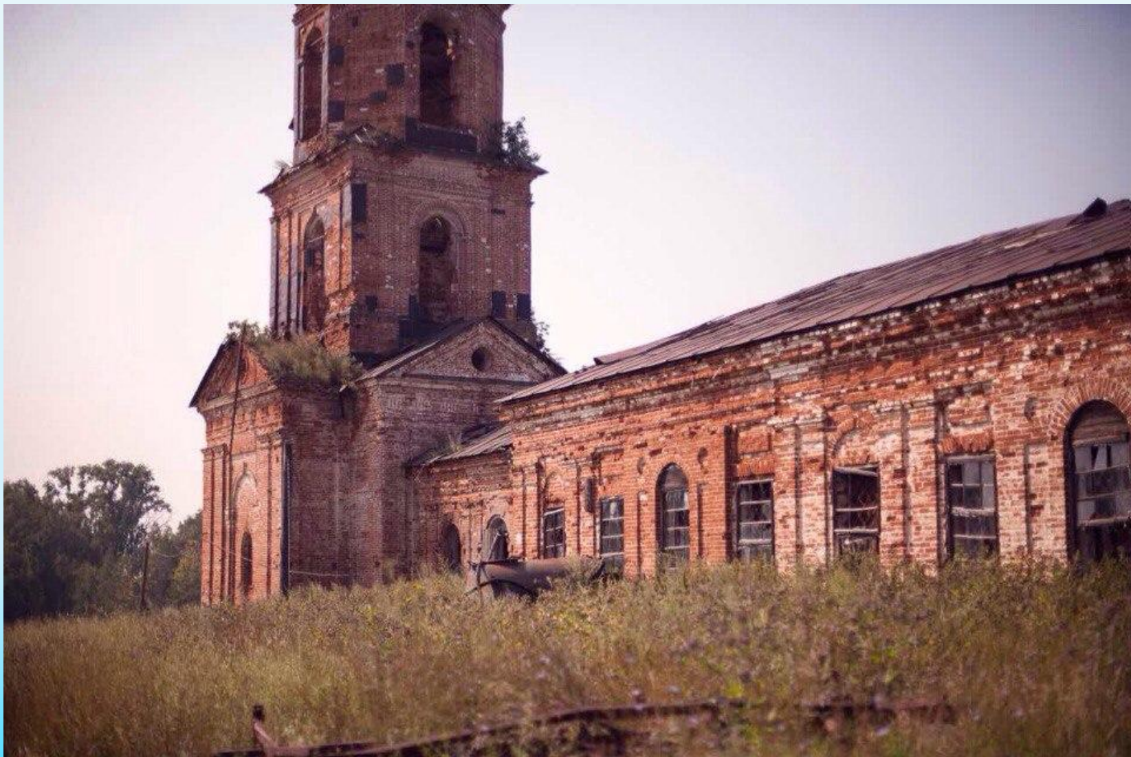
Христорождественская церковь. июнь 2017 года