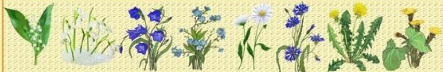
Ландыш Подснежник Колокольчик Незабудка Ромашка Василёк Одуванчик Мать-и-мачеха