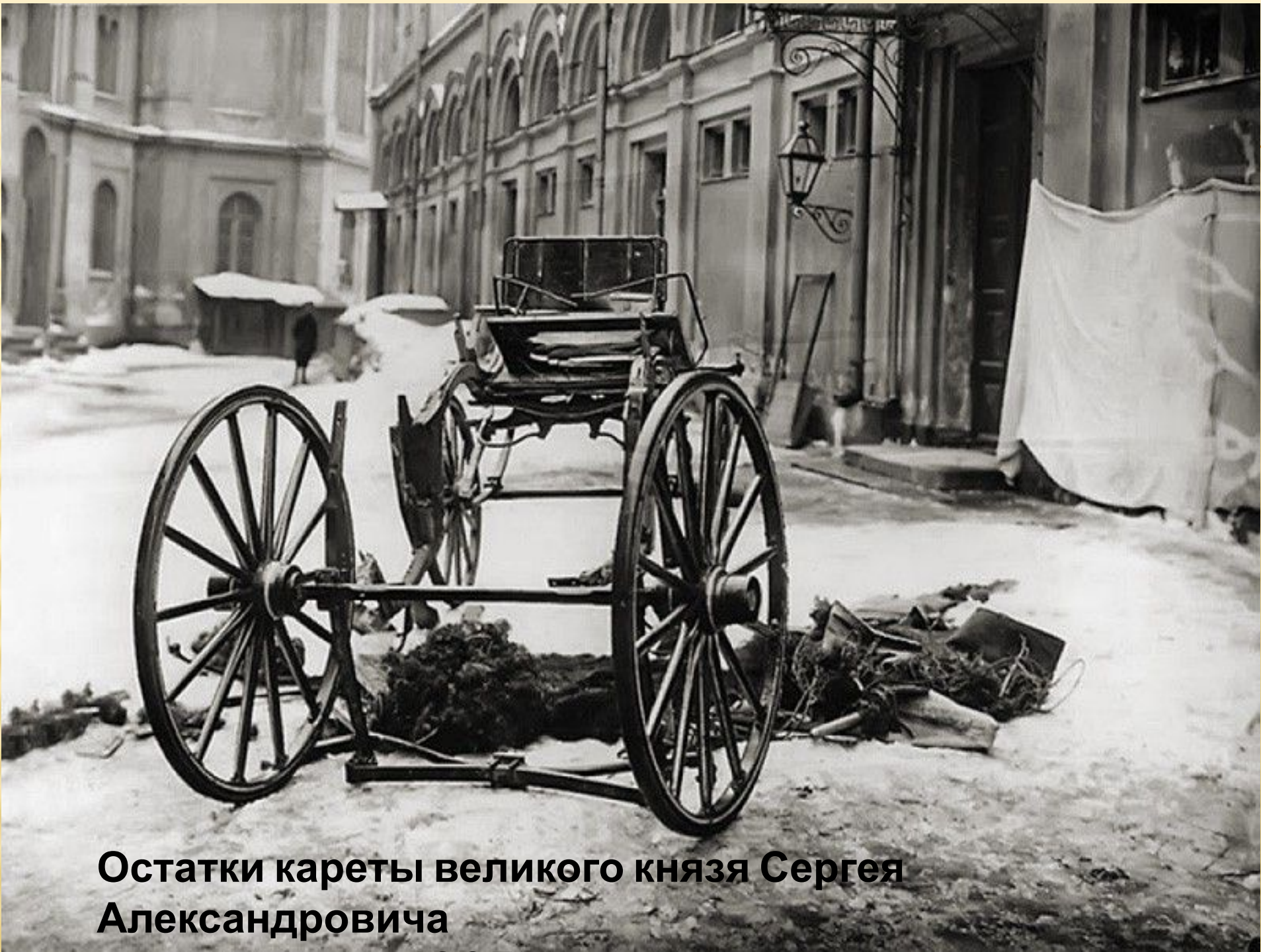
Остатки кареты великого князя Сергея Александровича