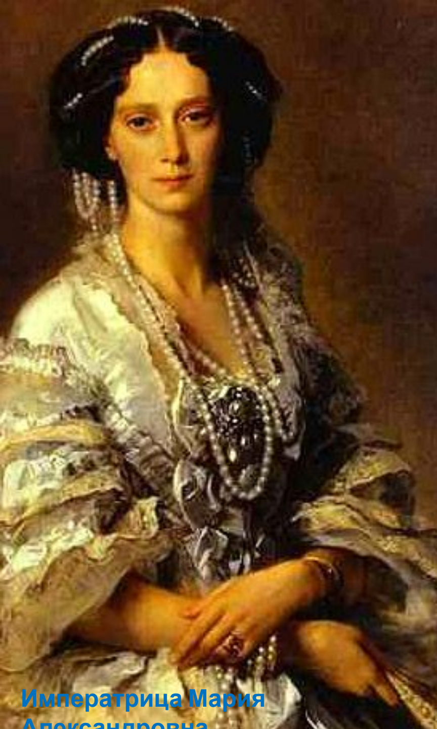
Императрица Мария Александровна