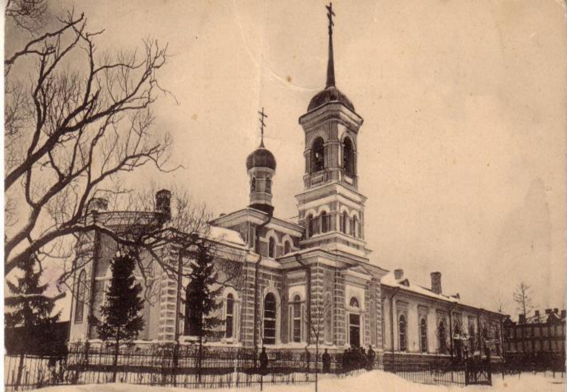
Царское-село. Церковь 2 го Царскосельскаго Стрѣлк. полка.