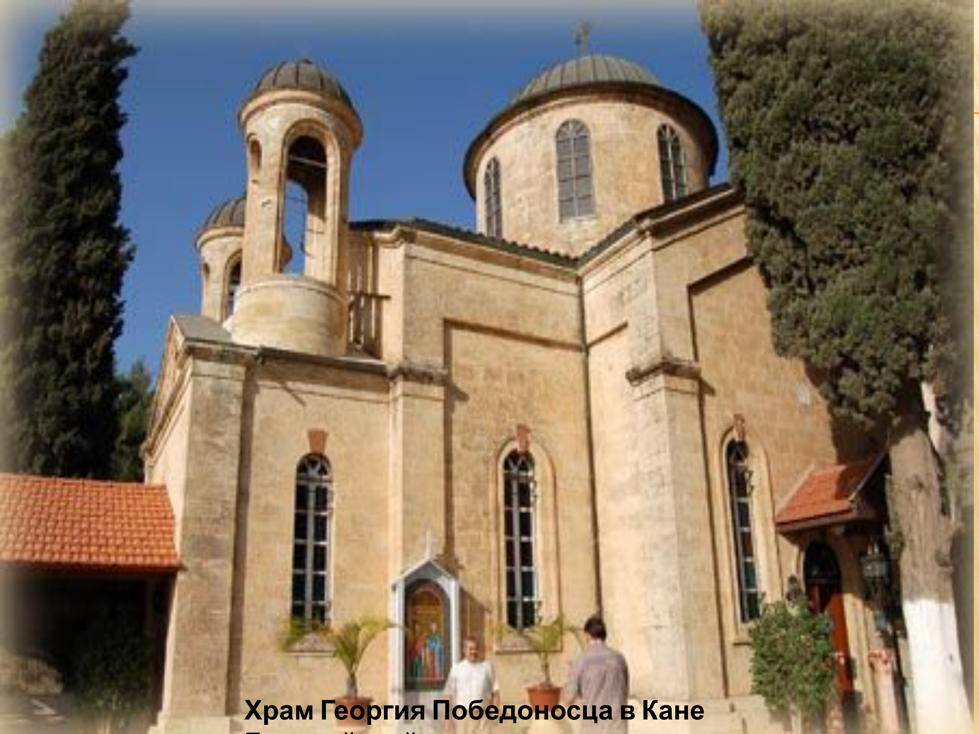
Храм Георгия Победоносца в Кане