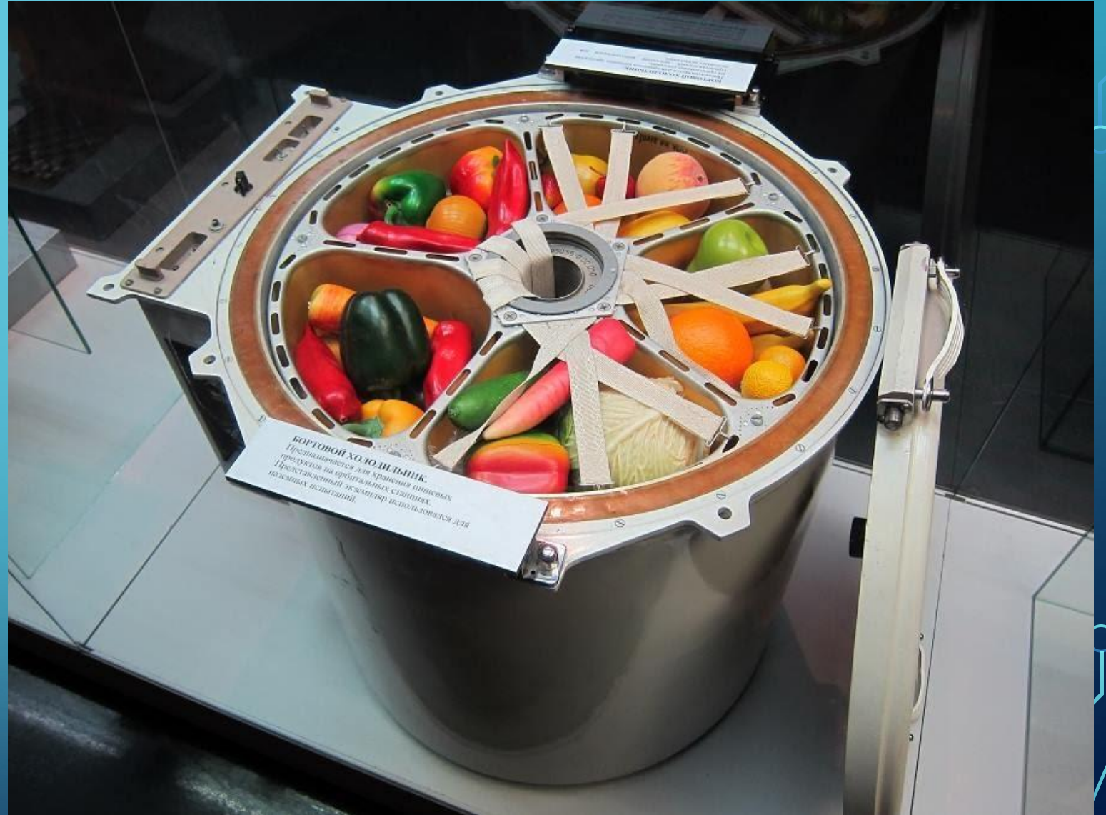
БОРТОВОЙ ХОЛОДИЛЬНИК. Предназначен для хранения пищевых продуктов на орбитальной станции. Представленный экземпляр использовался для интерьерных испытаний.

ТАК ВЫГЛЯДИТ ХОЛОДИЛЬНИК НА КОСМИЧЕСКОМ КОРАБЛЕ.