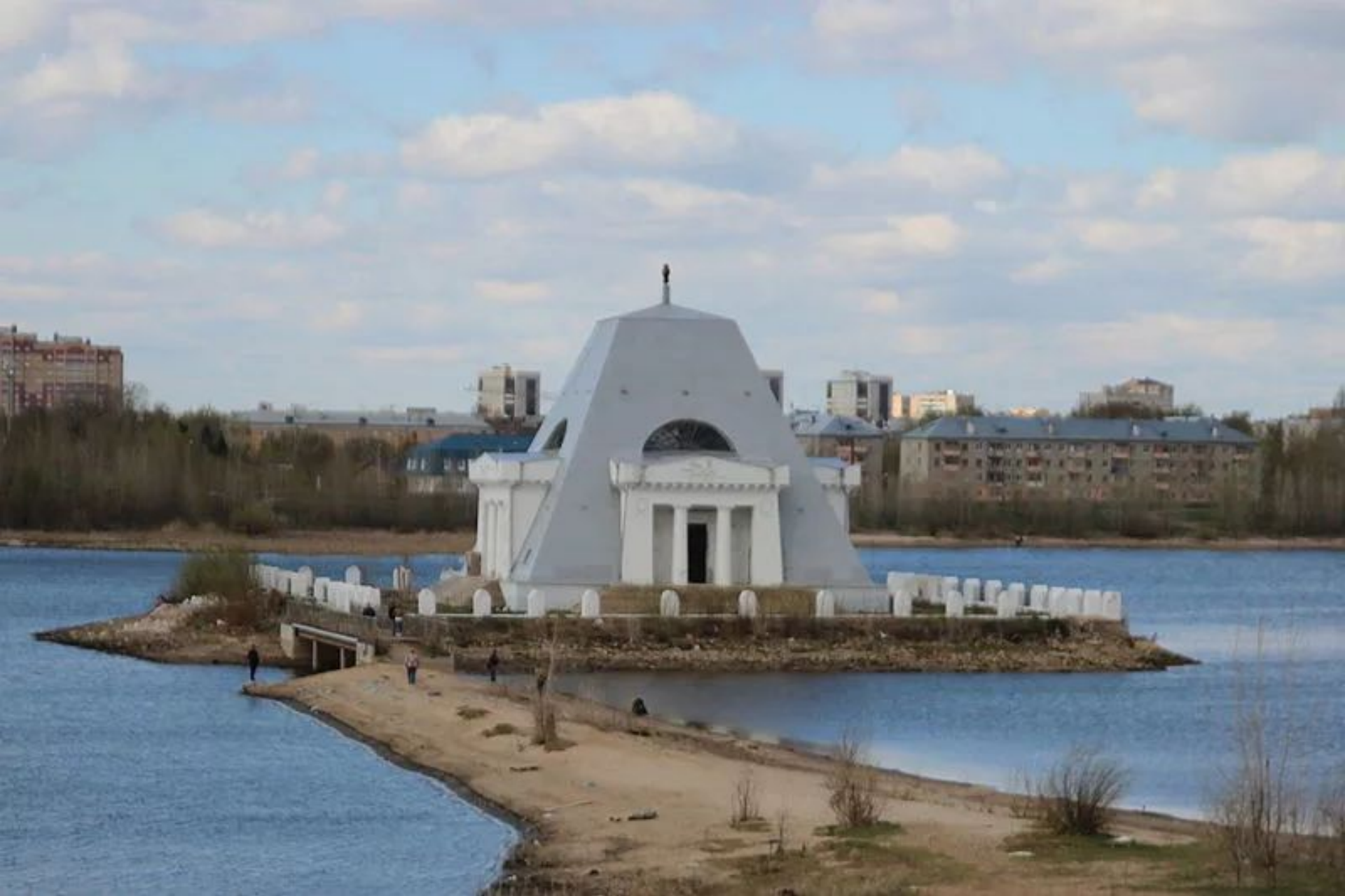
Храм-памятник воинам, павшим при взятии Казани в 1552 году (на братской могиле) (Храм-памятник в честь Нерукотворённого Образа Спасителя) 1813-1823