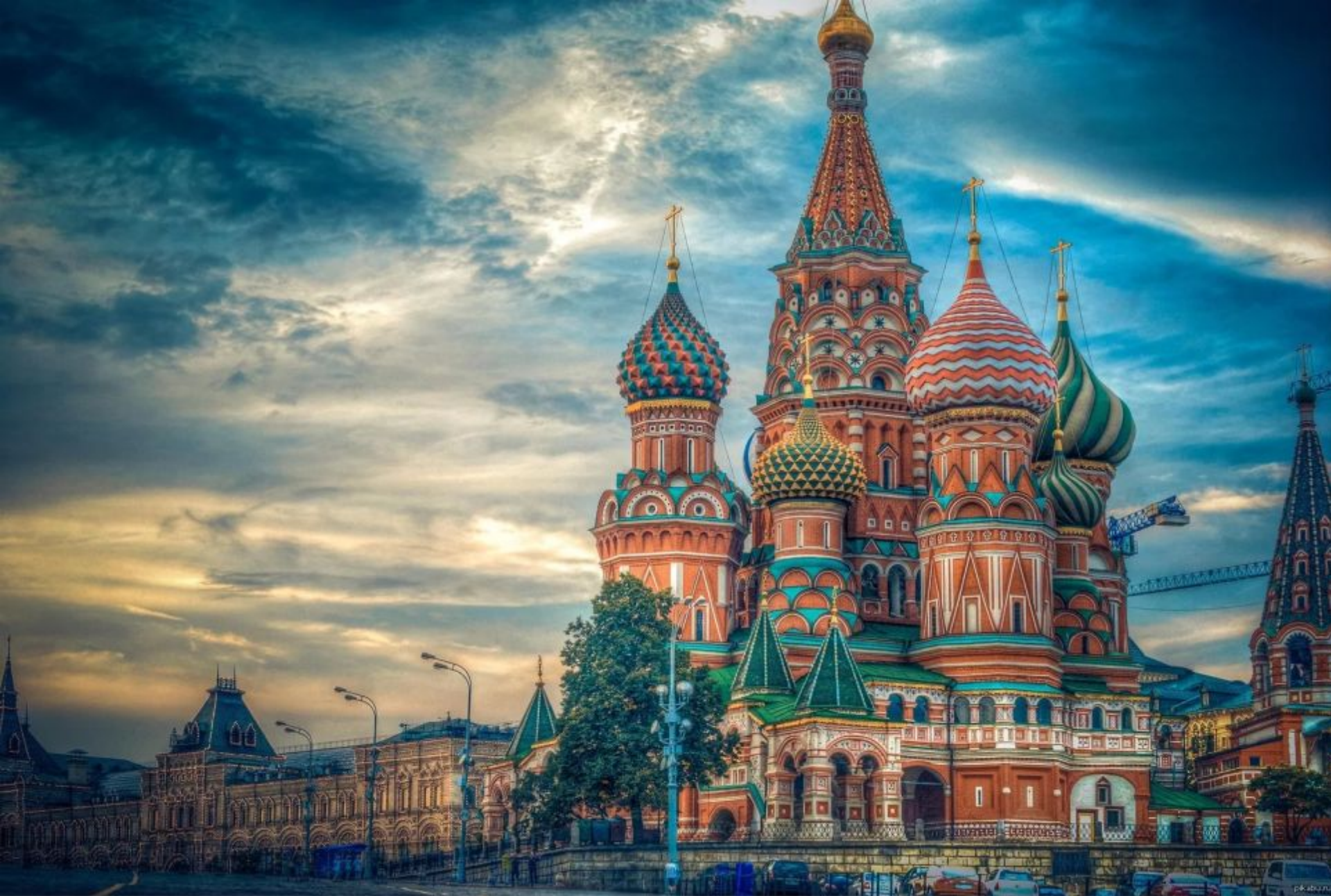
Собор Покрова Пресвятой Богородицы, что на Рву (Покровский собор, разговорное - собор Василия Блаженного) 1556-1561