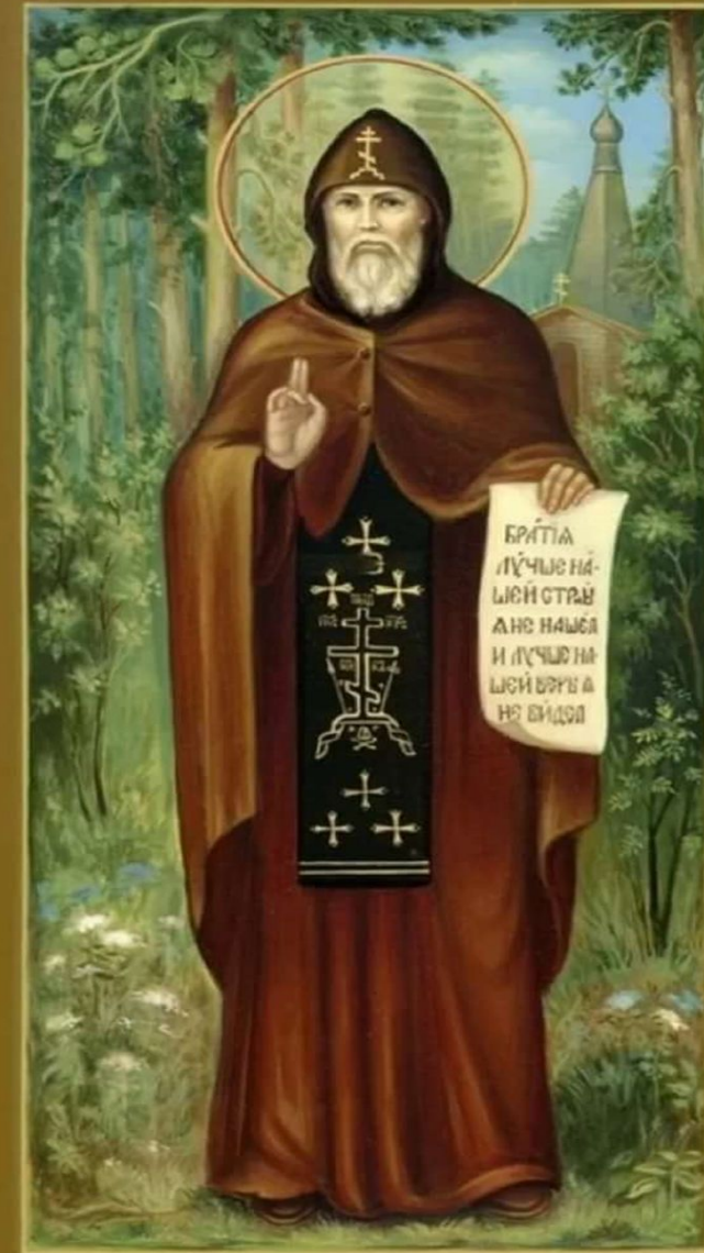
СВ. ПРП. СЕРАФИМЪ ВЪРІЦКІИ

В 2000 году православная церковь причислила иеромонаха к лику святых