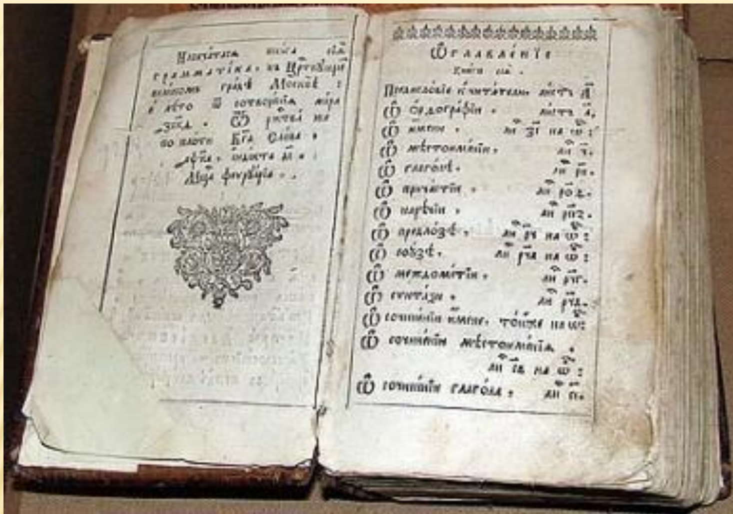
«ГРАМАТИКИ СЛАВЕНСКІЯ ПРАВИЛНОЕ СИНТАГМА» (1619) — НАЙДОСКОНАЛІША ГРАМАТИКА, НАПИСАНА МЕЛЕТІЄМ СМОТРИЦЬКИМ У ВІДНОС