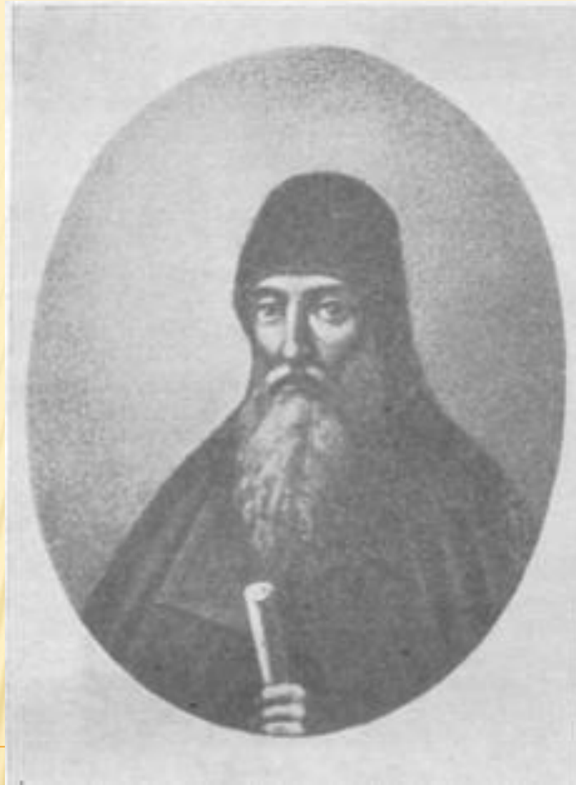
ЗАХАРІЙ КОПИСТЕНСЬКИЙ – ВІДОМИЙ ПРАВОСЛАВНИЙ БОГОСЛОВ