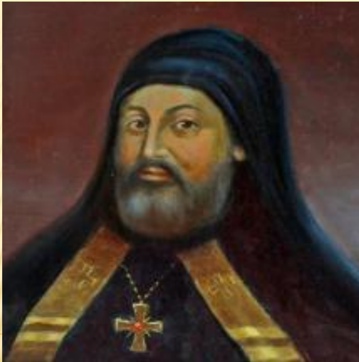
МЕЛЕТІЙ СМОТРИЦЬКИЙ – ПИСЬМЕННИК-ПОЛЕМІСТ І ВЧЕНИЙ