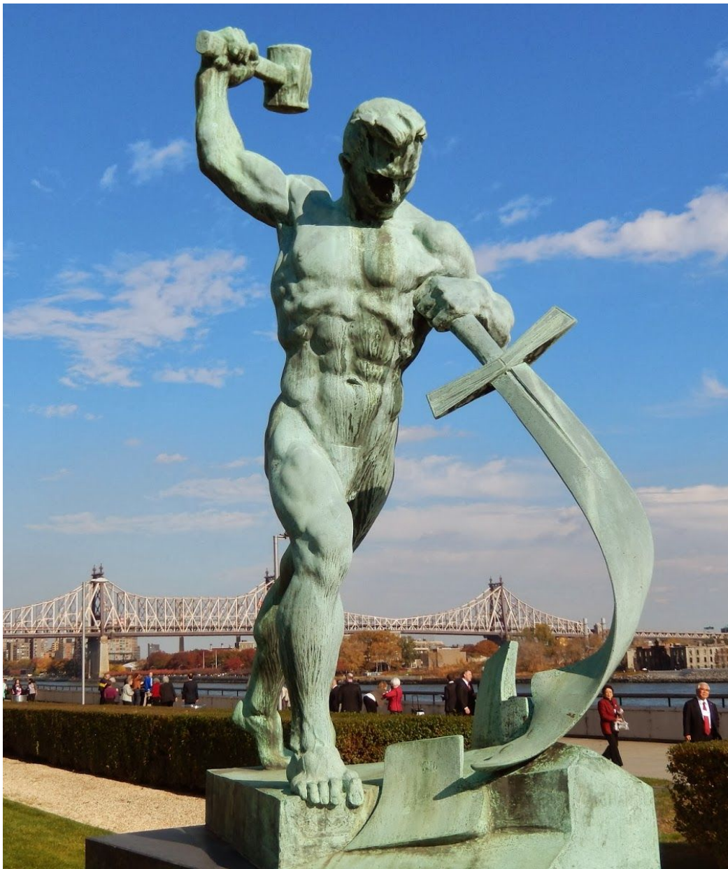
«Перекуём мечи на орала», 1957

В 1957 году Вучетич стал автором аллегорической статуи «Перекуём мечи на орала», установленной у здания ООН в Нью-Йорке (США). Название статуи — призыв к отказу от распрей и вражды, к мирной, созидательной жизни — взято из Старого завета (Ис. 2:4, Иоил. 3:10, Мих. 4:3), где предсказывается, что народы мира перестанут воевать, а оружие переделают в плуги и серпы.