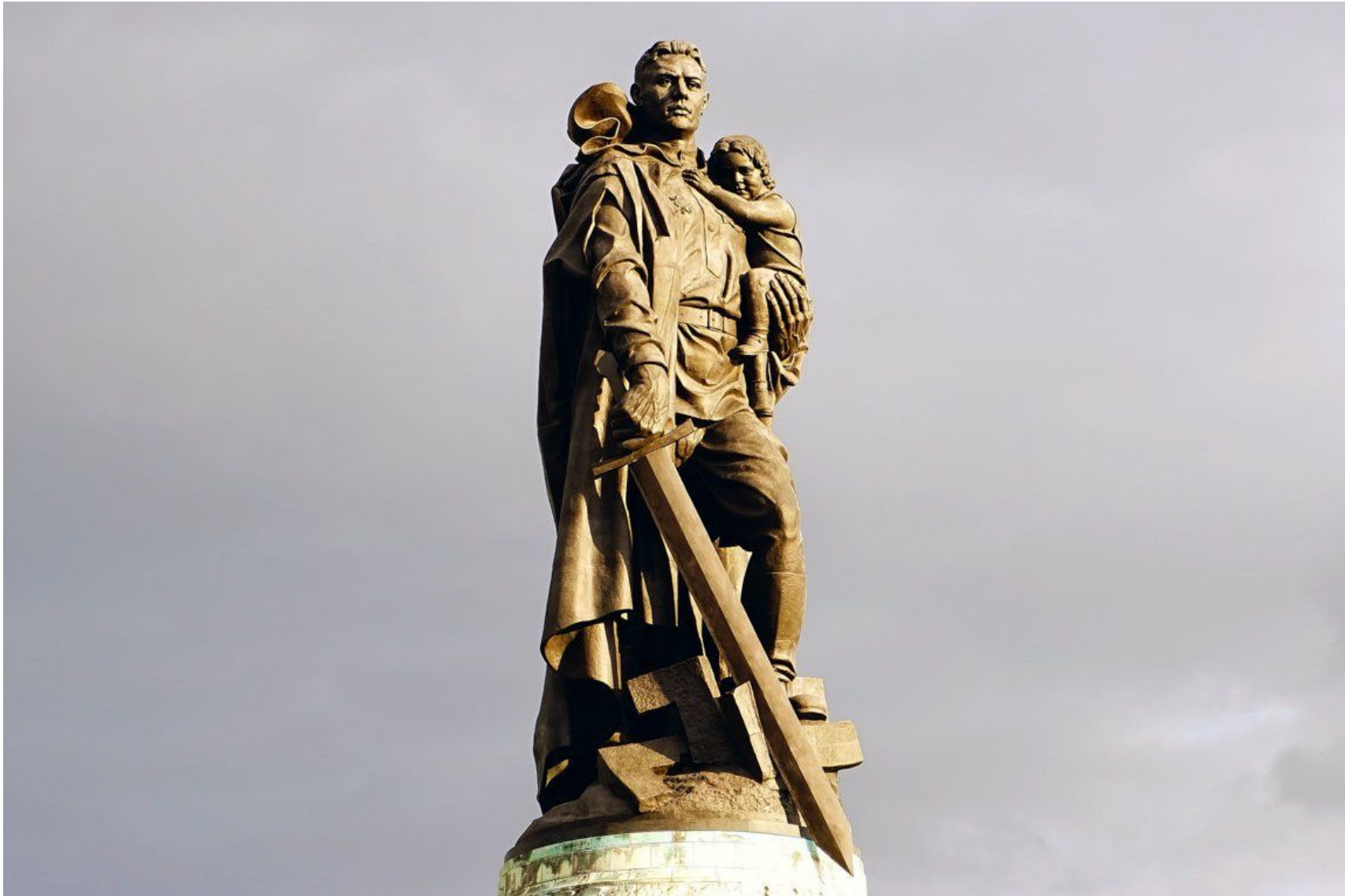
«Воин-освободитель» в берлинском Трептов-парке, 1949