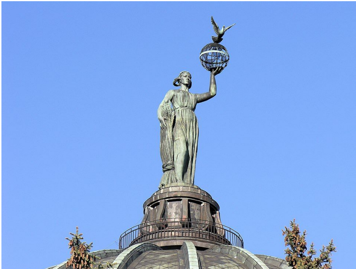
Скульптура на крыше планетария в Волгограде - «Мир»