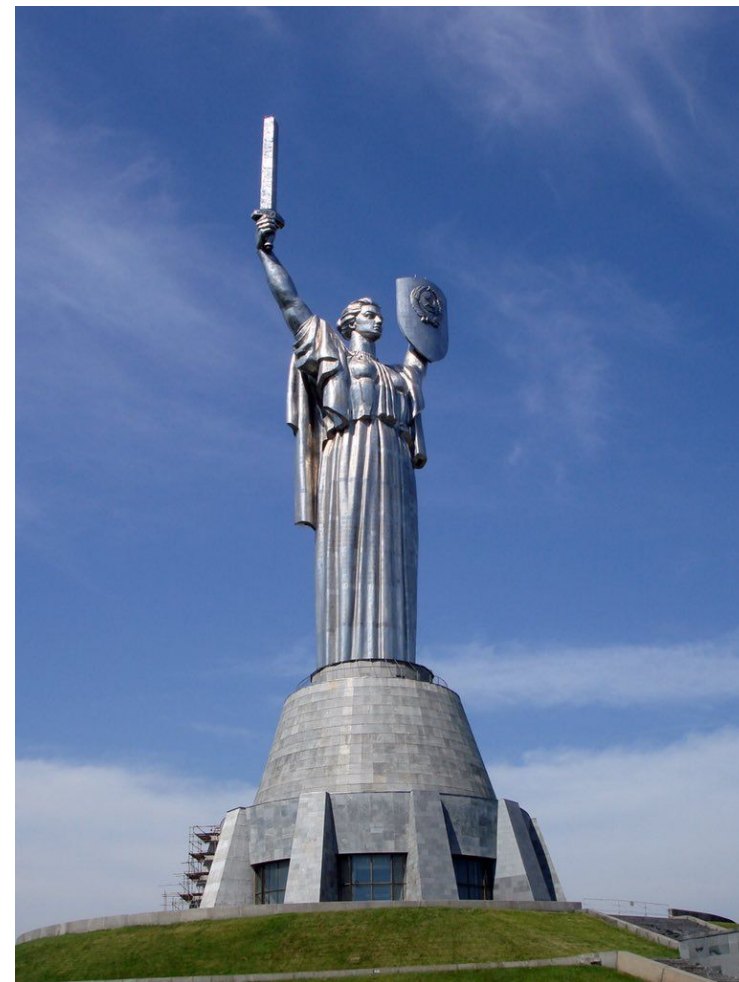
«Родина-мать», Киев 1972