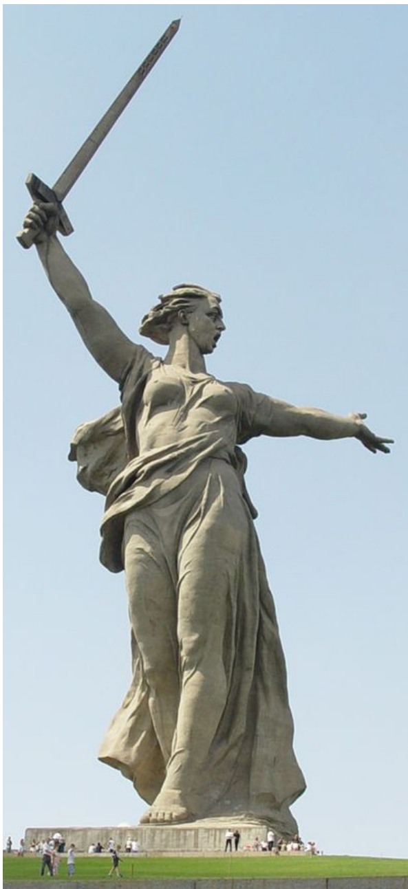
«Родина-мать зовет», 1958, Волгоград, Мамаев курган, бетон