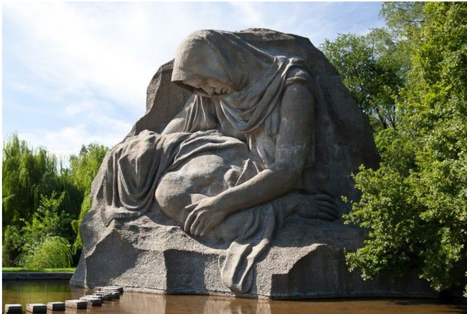
«Скорбящая мать» на Площади скорби Сделана в виде «Пьеты» Микеланджело