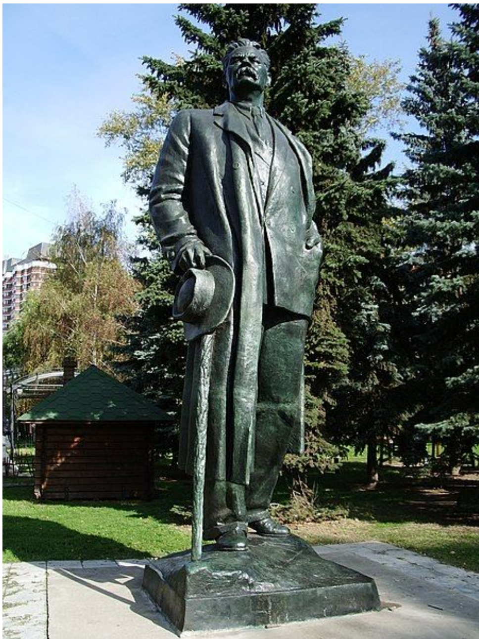
Памятник Максиму Горькому, 1939, бронза