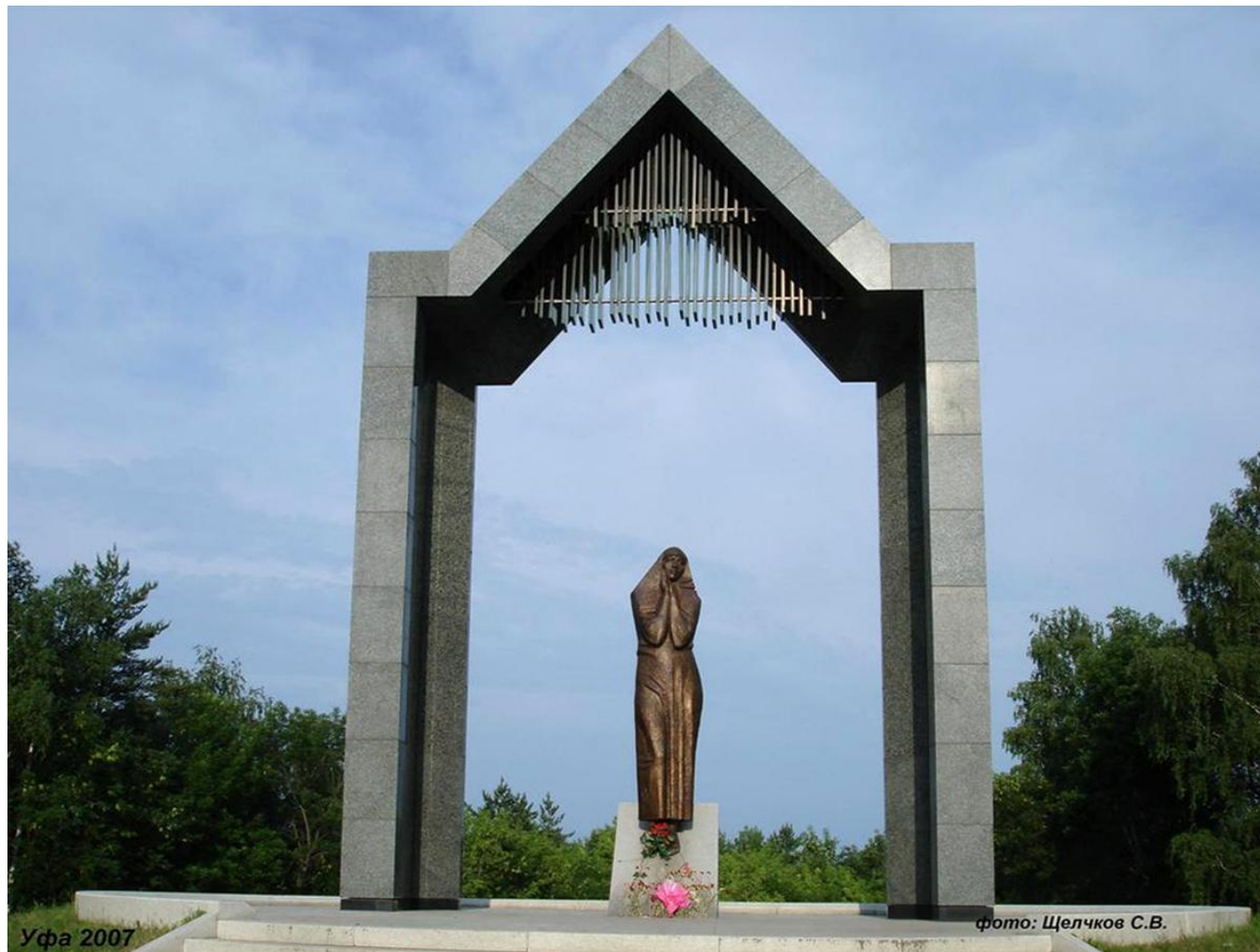
«Скорбящая мать», Уфа, 2003, Калинушкин, посвящён воинам-уроженцам Башкортостана, погибшим в локальных военных конфликтах.