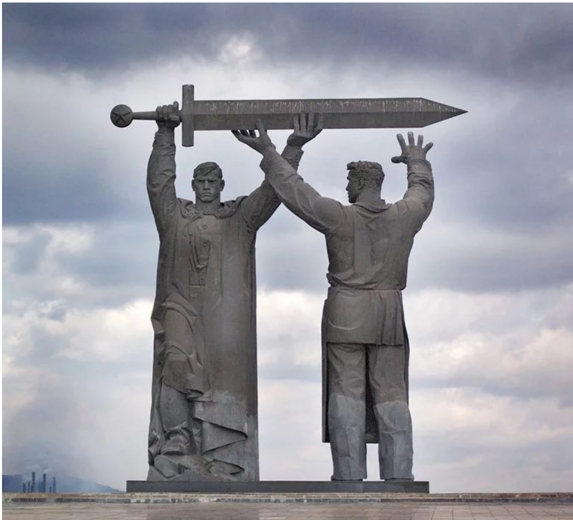
«Тыл – фронту» , Магнитогорск, 1979 Лев Николаевич Головницкий

Памятник представляет собой двухфигурную композицию рабочего и воина. Рабочий ориентирован на восток, в сторону Магнитогорского металлургического комбината. Воин — на запад, в сторону где во время войны находился враг. Подразумевается, что меч, выкованный на берегу Урала, потом был поднят Родиной-матерью в Сталинграде и опущен после Победы в Берлине. В композицию также входит каменный цветок из карельского гранита с вечным огнём.