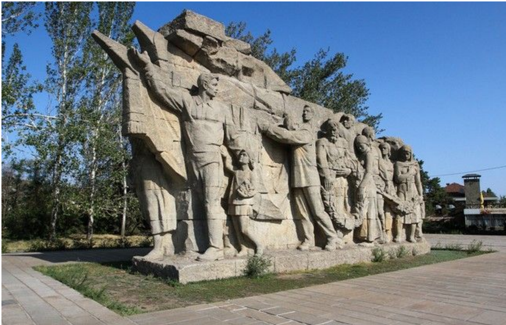
Горельеф «Память поколений» - вечная память о подвиге русских солдат под Сталинградом