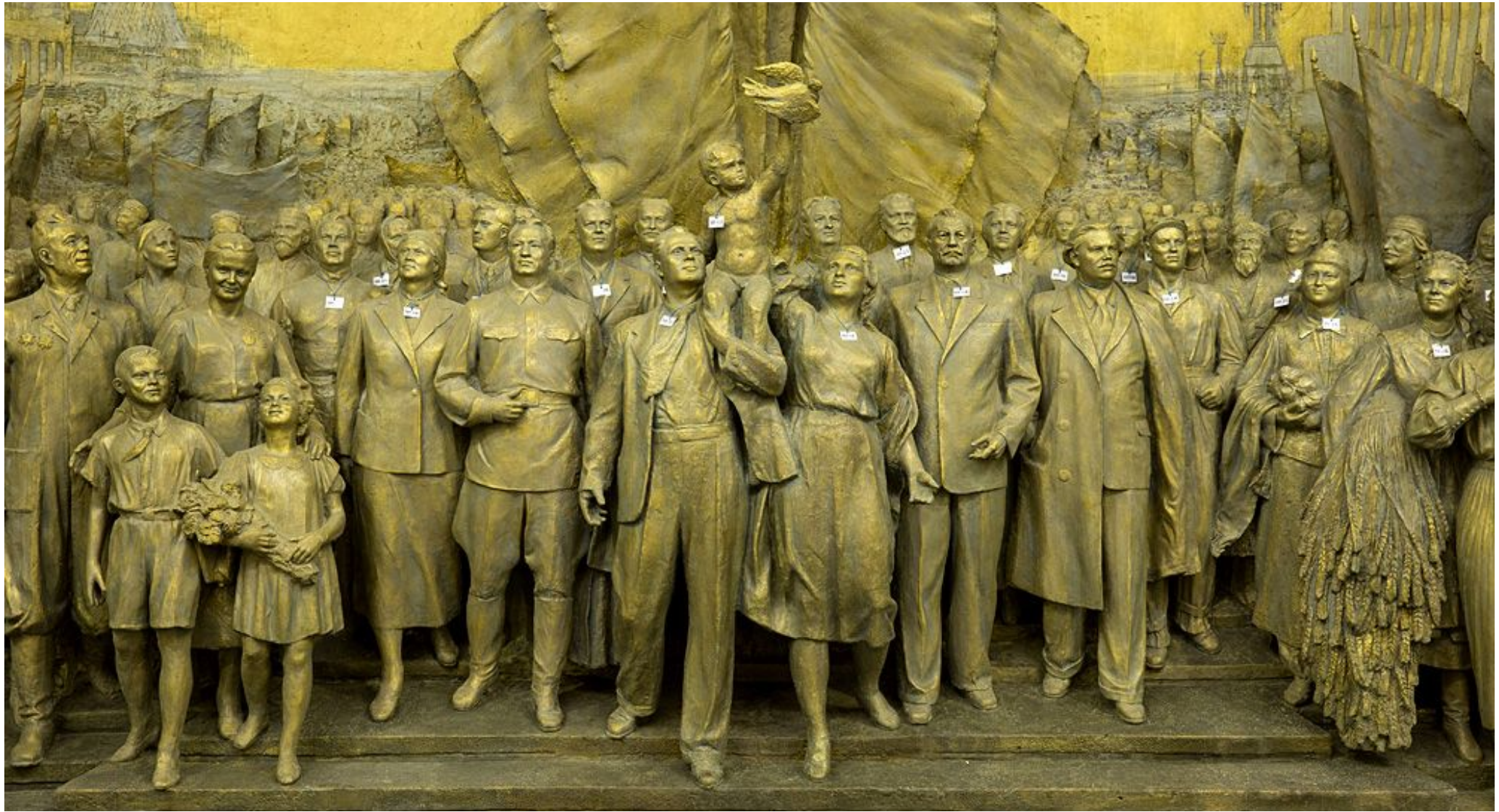
«Советскому народу слава», ВДНХ, 1950-1953