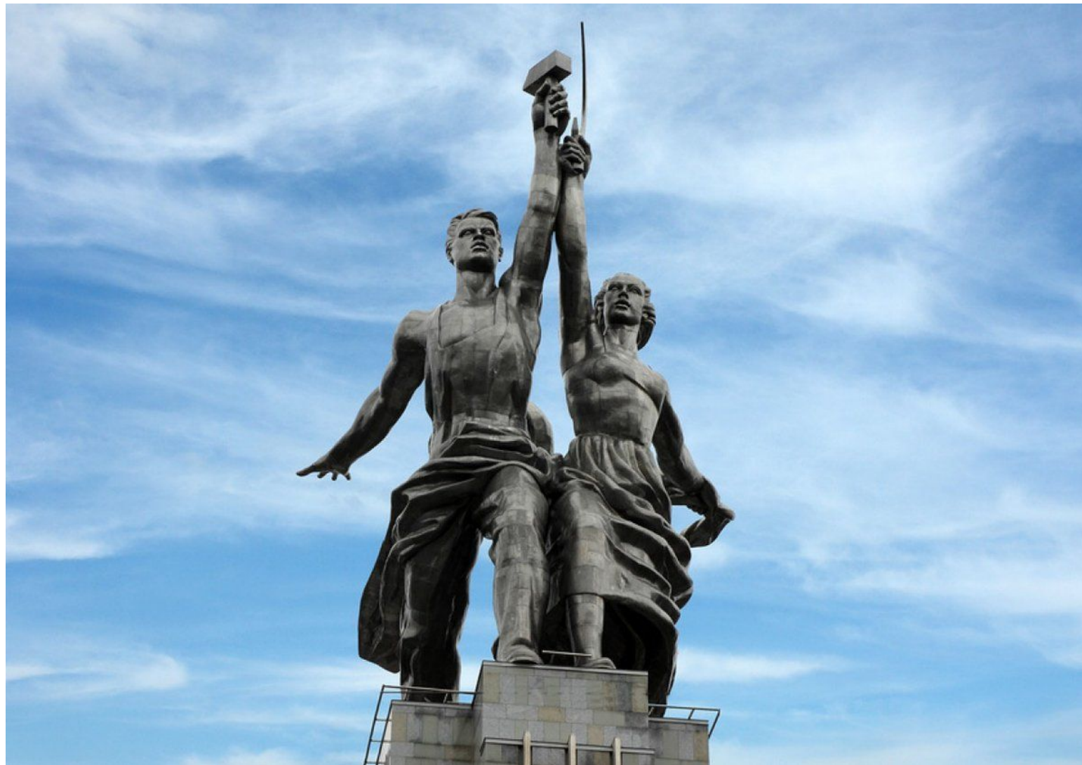
Монумент «Рабочий и колхозница». С 1939 года находится на ВДНХ. С 1947 года – символ «Мосфильма».