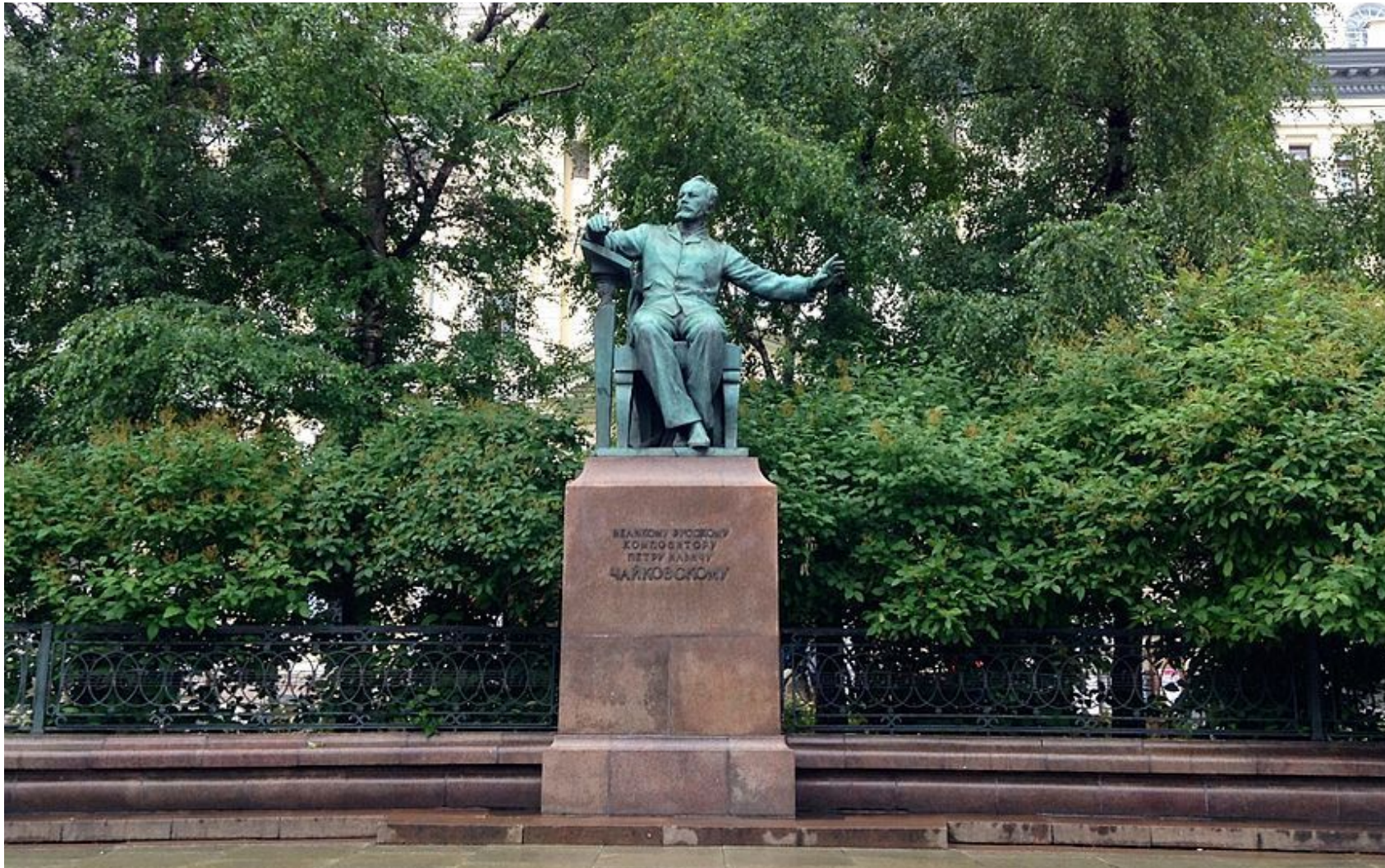
Памятник Петру Ильичу Чайковскому у здания Московской консерватории, 1944-1954, бронза