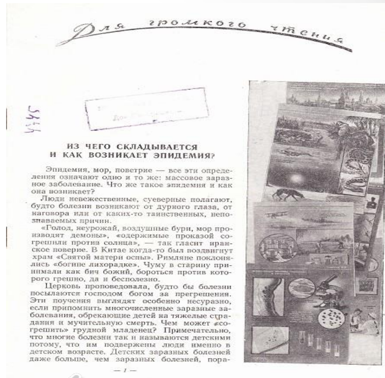
Фото. Материал для громкого чтения «Из чего складывается и как возникает эпидемия?». Издательство «Советская Россия»