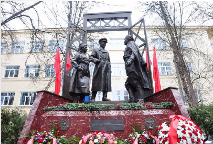
Памятник «Медикам – героям Великой Отечественной войны 1941–1945» в Москве, Россия

Памятник военным врачам и медицинским сестрам в Химках, Московская обл., Россия (открыт 23 февраля 2016 года около Московского государственного института культуры, здесь во время войны был госпиталь)