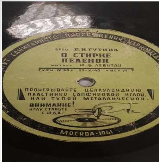
Фото. Грампластинка с текстами, озвученными Ю.Б. Левитаном. «О стирке пеленок» и «О постели ребенка». Выпуск Института санитарного просвещения Наркомздрава СССР, 1941 г.