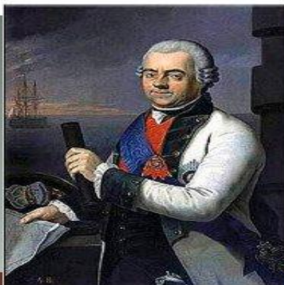
Адмирал Григорий Андреевич Спиридов (1713-1790)