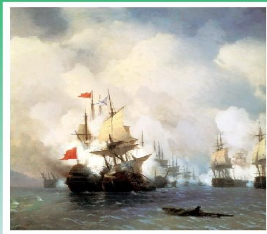
Бой в Хиосском проливе 24 июня 1770 года

● Турки напротив, были расположены встретить балтийскую эскадру правильным орудийным боем и, в случае неудачи, отойти в Чесменскую бухту под прикрытие многочисленной береговой артиллерии.