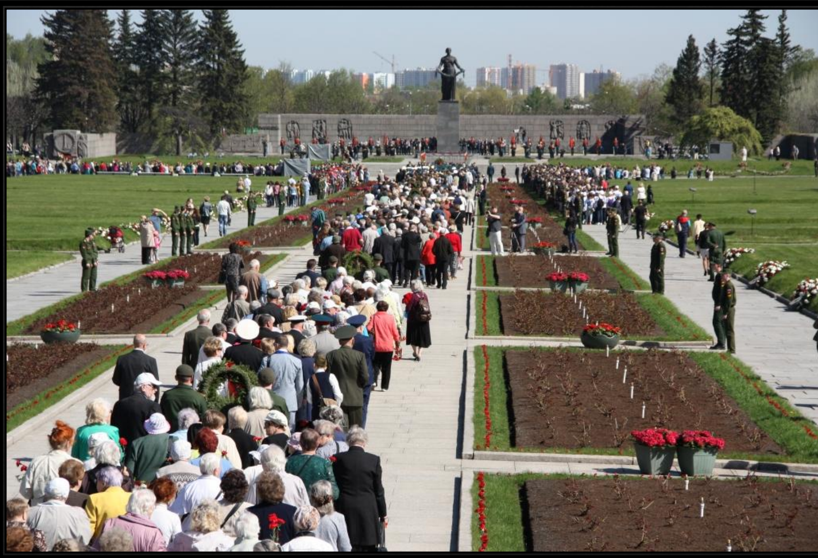
Братские могилы Пискаревского кладбища