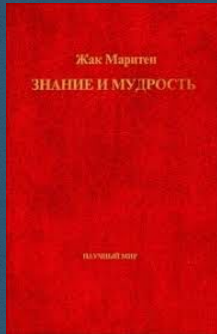
«Знание и мудрость»