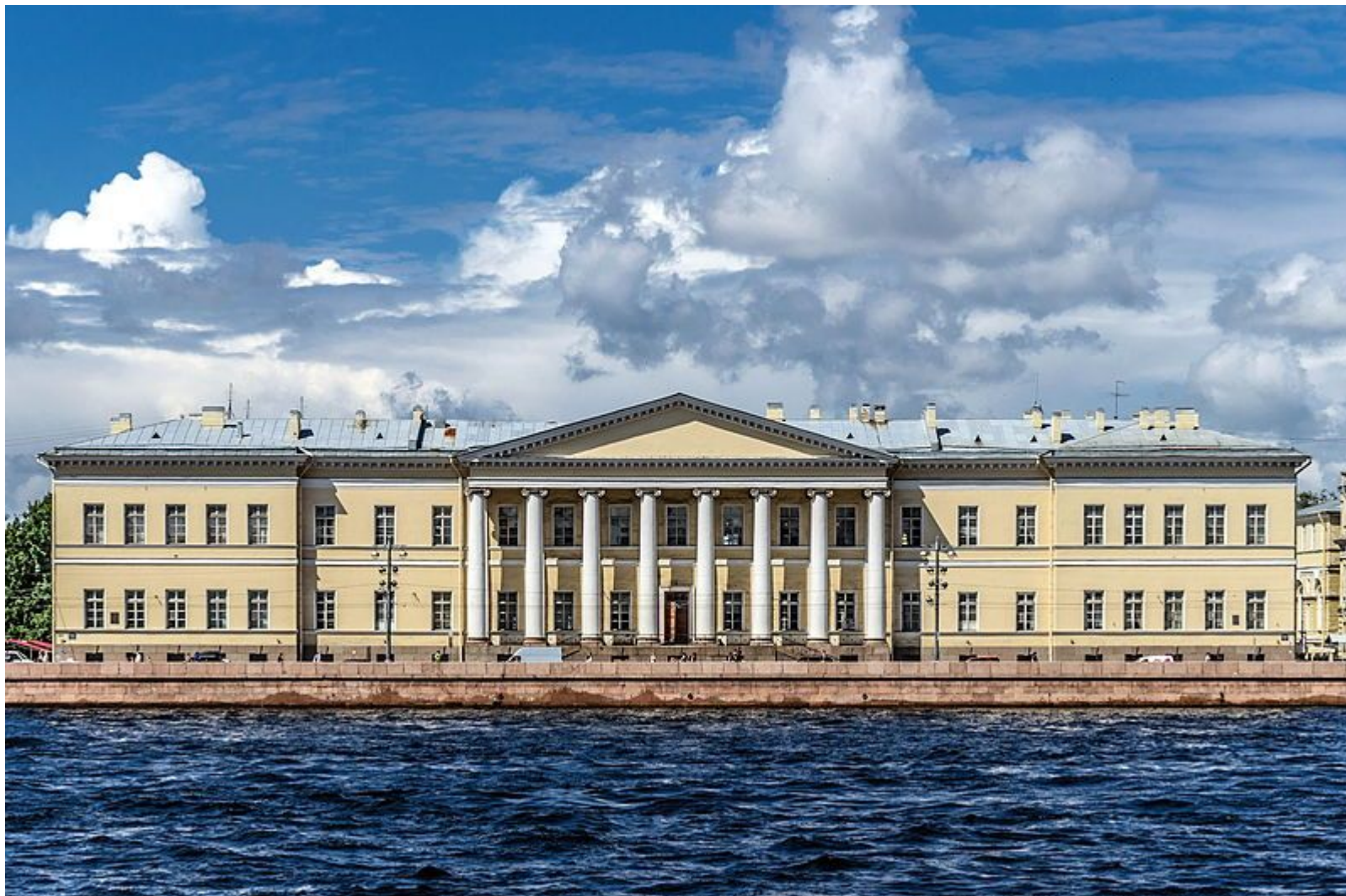
Российская Академия наук - 1725 Здание РАН в Петербурге на Васильевском острове