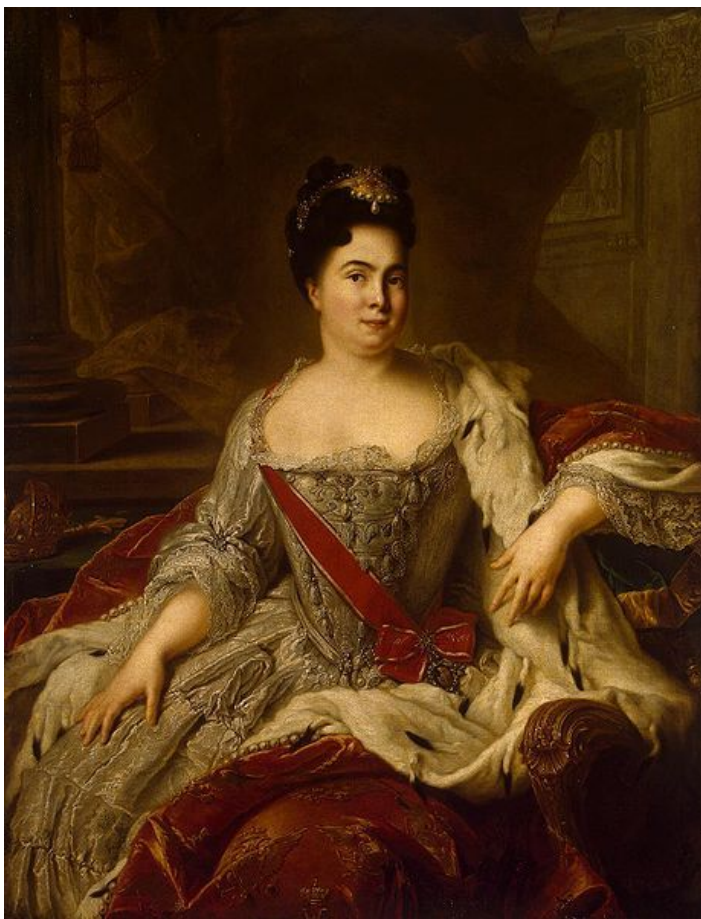
Екатерина I (1725-1727)