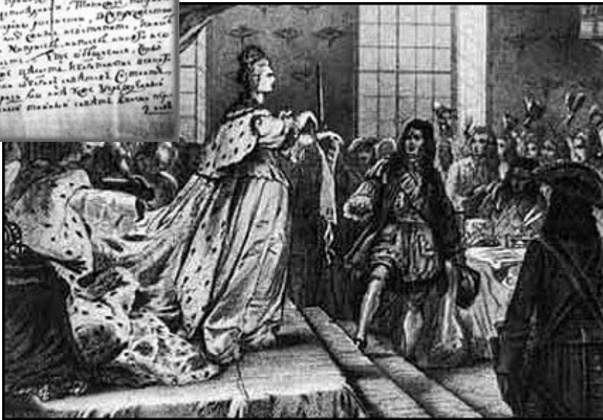
Гравюра. Анна Иоанновна разрывает кондиции.