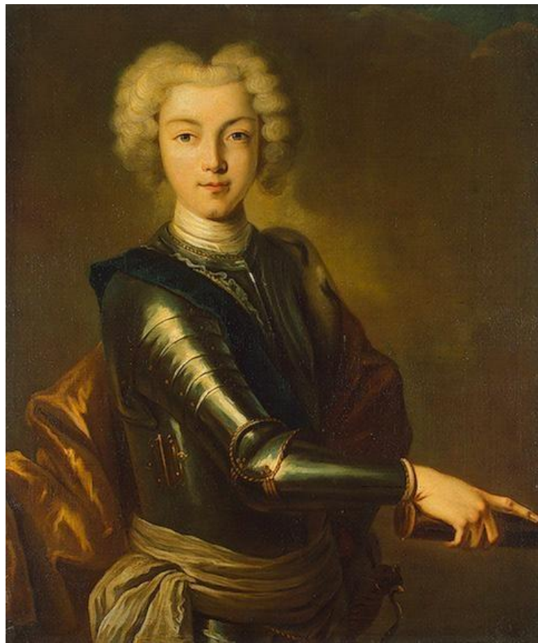
Петр II (1727-1730)