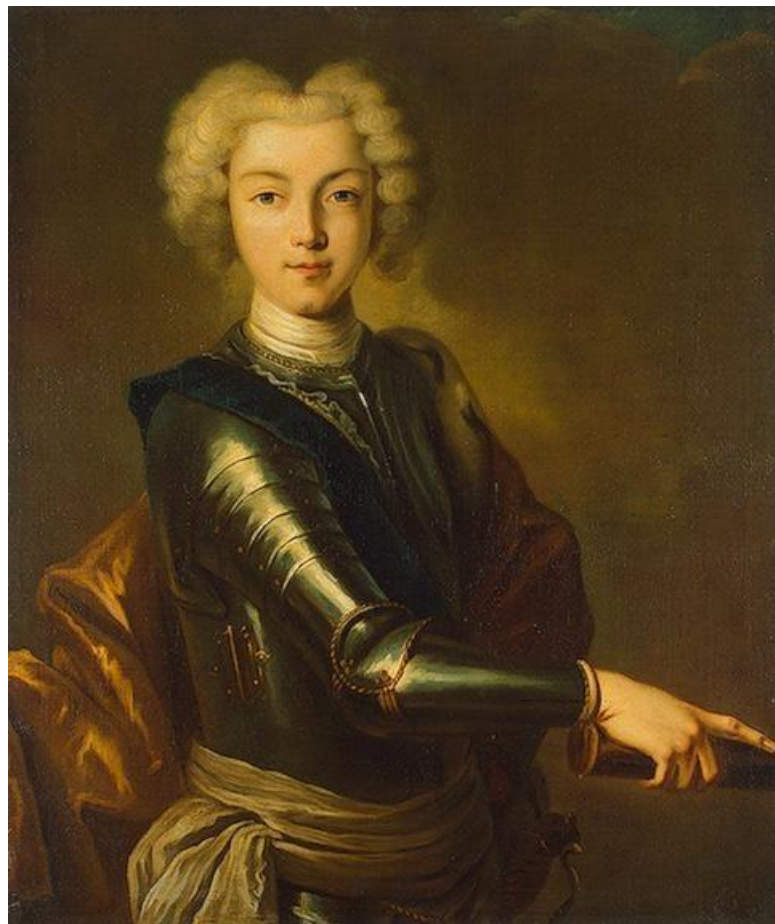
Петр II (1727-1730)