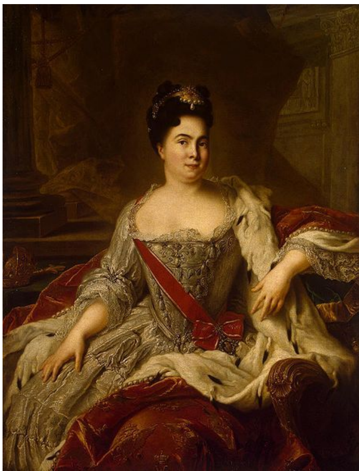
Екатерина I (1725-1727)