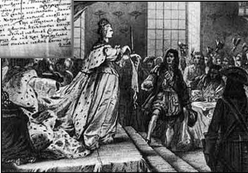
Гравюра. Анна Иоанновна разрывает кондиции.