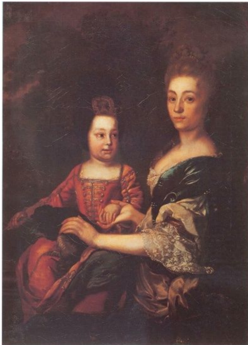
Иван Антонович с Анной Леопольдовной (1740-1741)