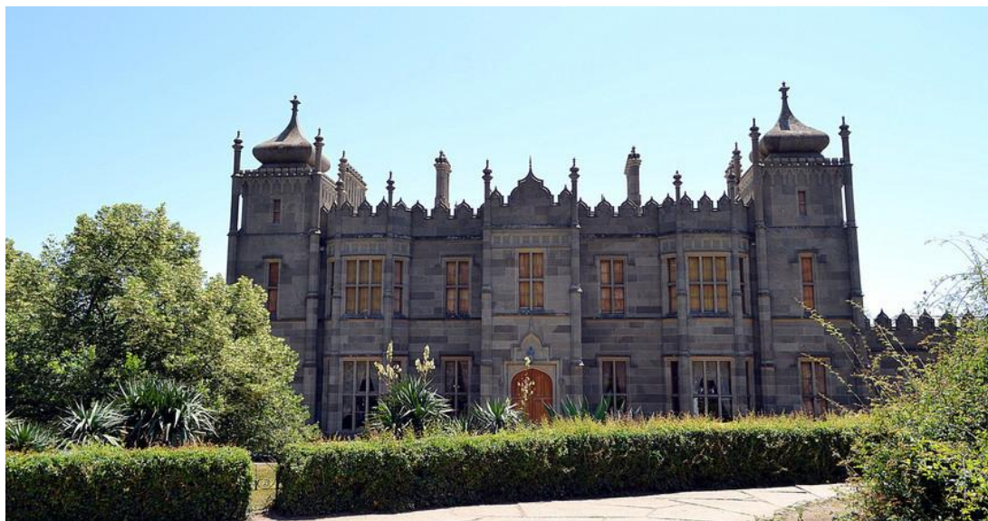
Граф Михаил Семенович Воронцов, Воронцовский Дворец, Массандра