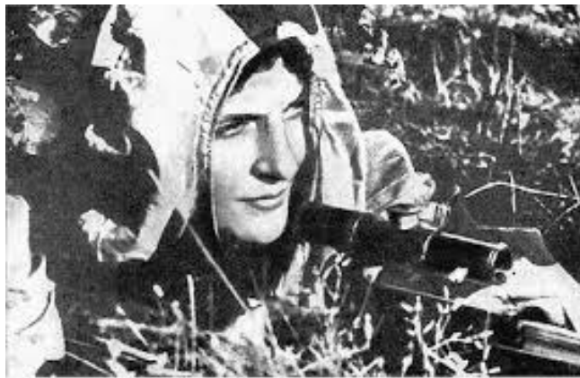
Снайпер Людмила Павличенко. 1942 г.