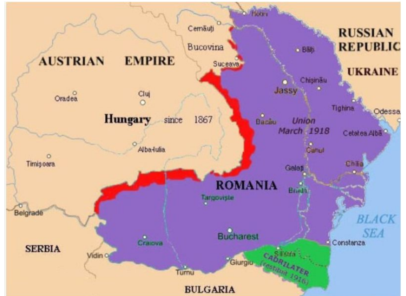
Harta cedărilor teritoriale ale României conform Păcii de la Paris (24 aprilie 1918 / 7 mai 1918), roșu către Austro-Ungaria, verde către Bulgaria, sursă: ro.wikipedia.org