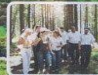
Пешеходные экскурсии: вольеры, экологическая тропа, каменная плита, зверными тропами.