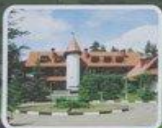
Гостиничный комплекс "Плавно"