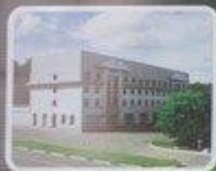
Гостиничный комплекс "Сергуч"