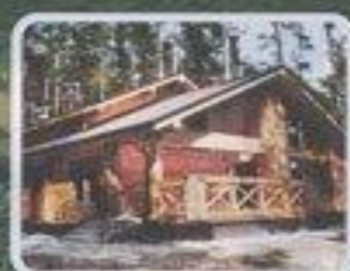
Гостевые домики "Плавно"