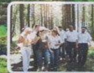
Пешеходные экскурсии: вольеры, экологическая тропа, каменная плита, зверными тропами.