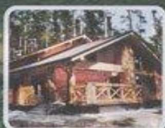
Гостевые домики "Плавно"