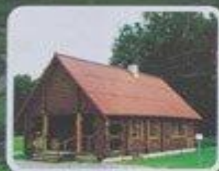
Гостевые домики "Нивки"