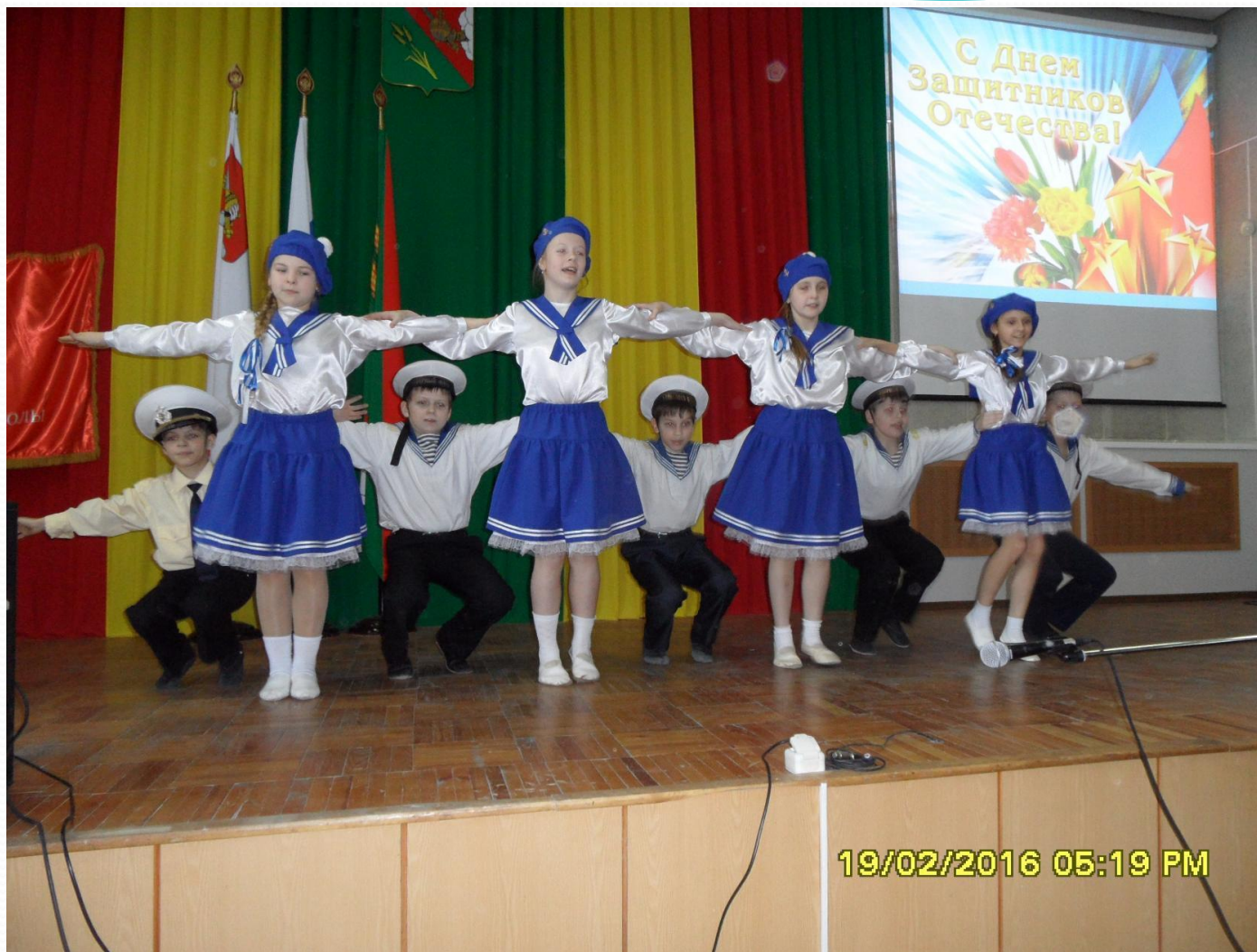
Матросский танец в исполнении кадетов на празднике, приуроченному Дню защитника Отечества, в администрации Вологодского района