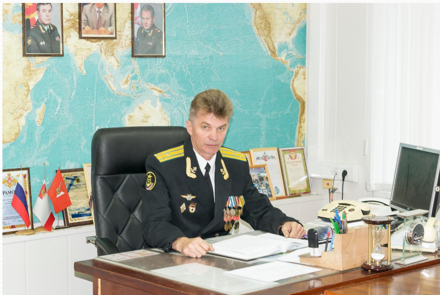
Начальник гарнизона Федотово гвардии полковник Толпыго И. В.