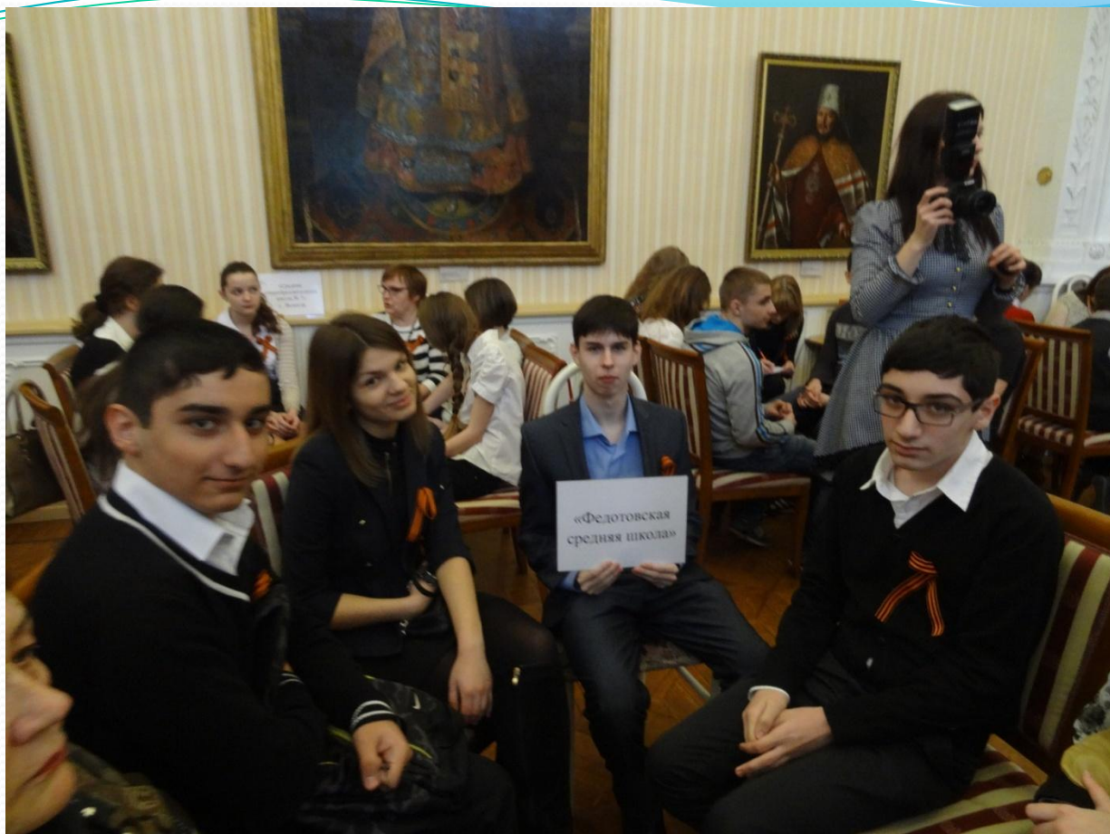
Участники областного интеллектуально-краеведческого конкурса «Вологодская земля в годы Великой Отечественной войны», посвящённого Дню Победы в Великой Отечественной войне 1941-1945 годов», который состоялся в Вологодском краеведческом музее