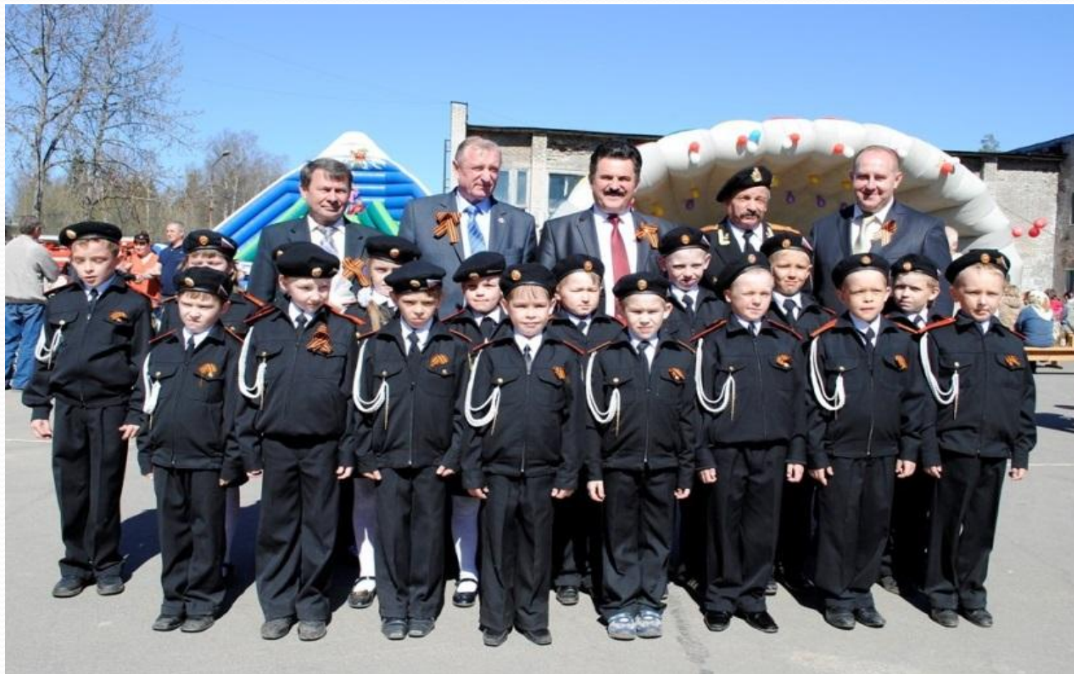
Кадетский класс МБОУ ВМР «Федотовская средняя школа»