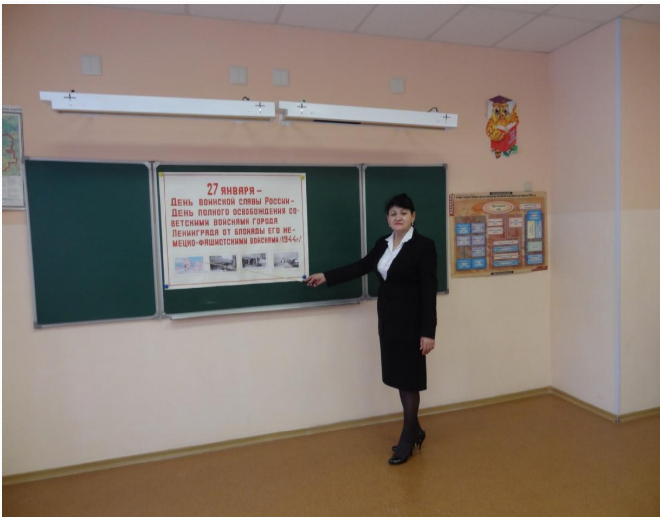
Руководитель клуба «Поиск» знакомит с Днём воинской славы России