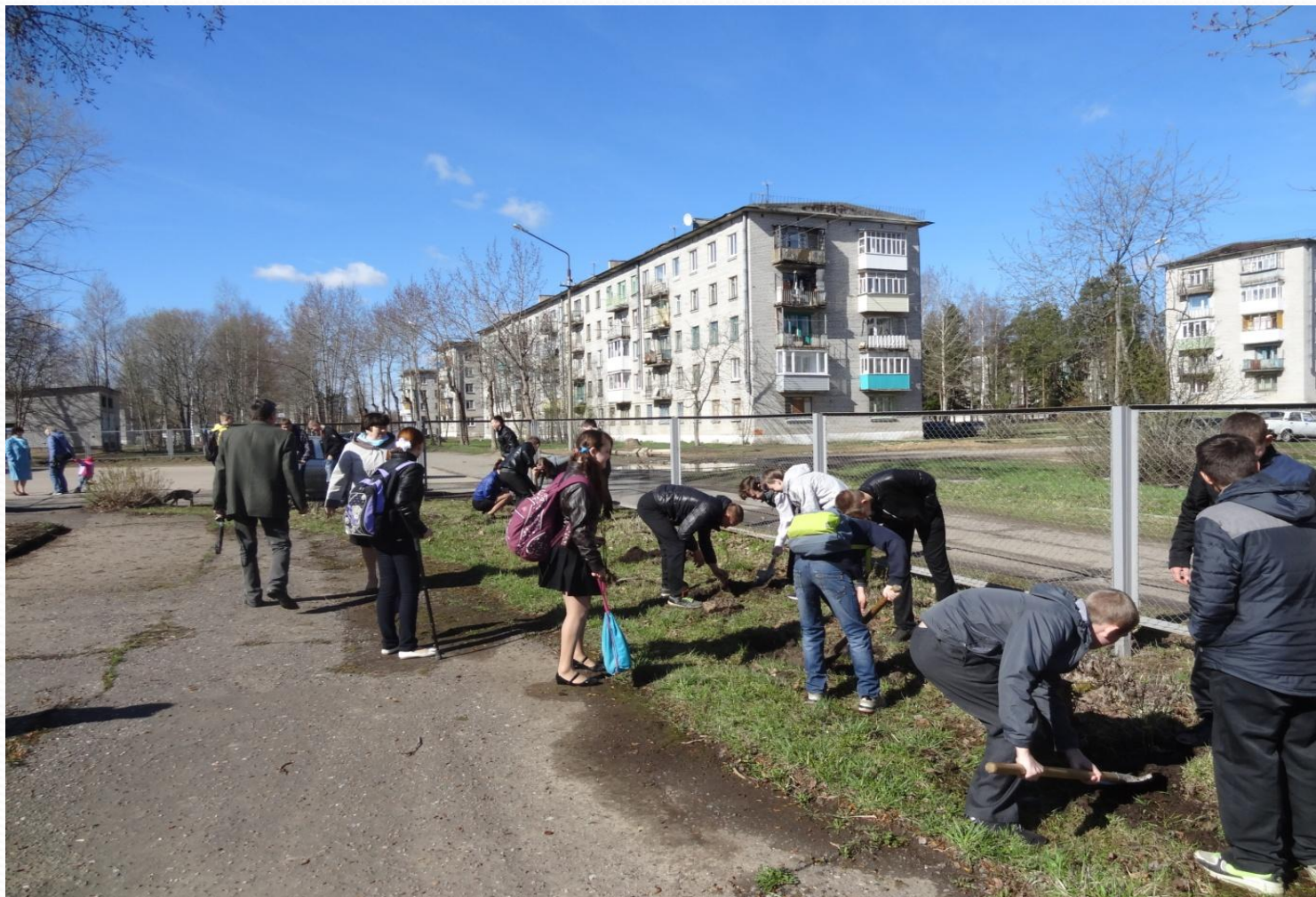
Акция «Дерево Победы»