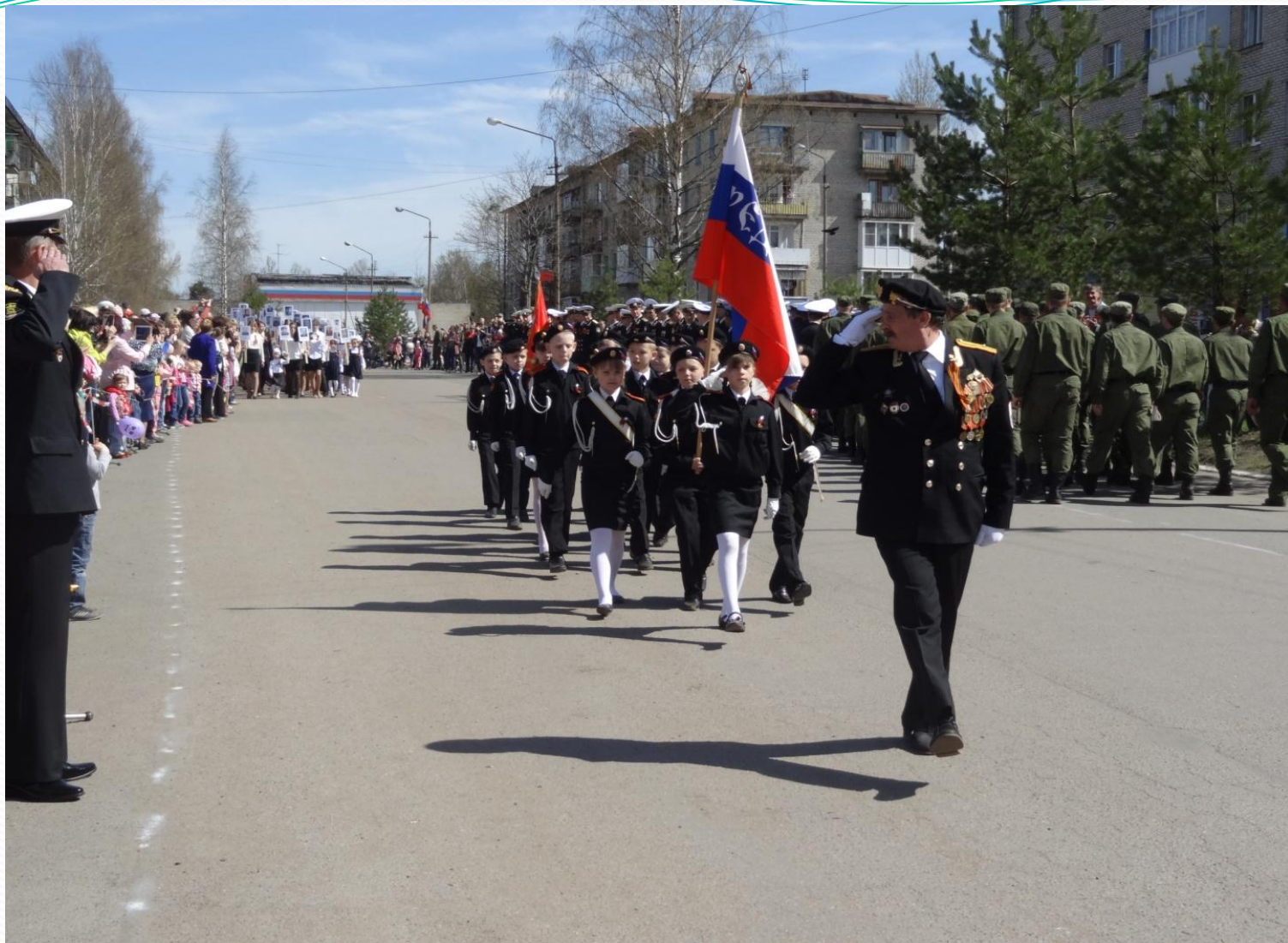
Участие кадетов в параде в День Победы в пос. Федотово