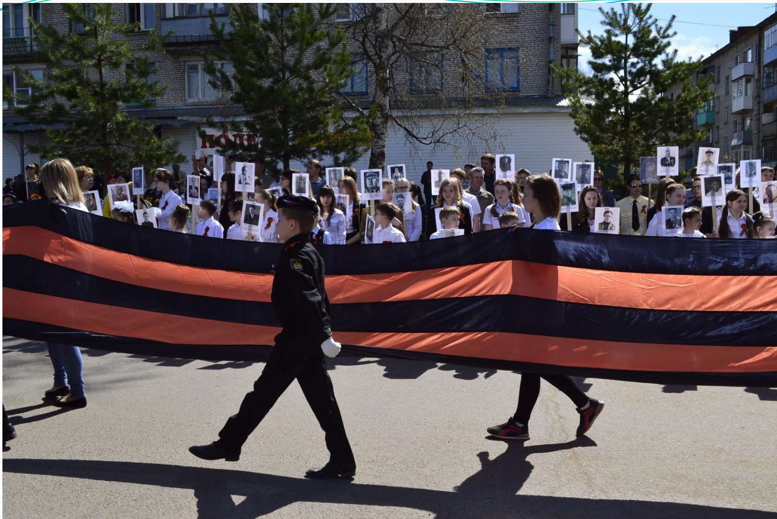
Участие в акции «Бессмертный полк» в День Великой Победы