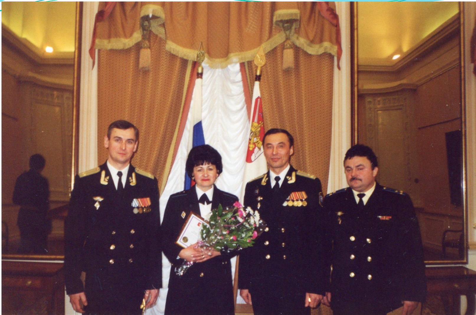
Среди коллег- награждённых в зале Вологодского кремля