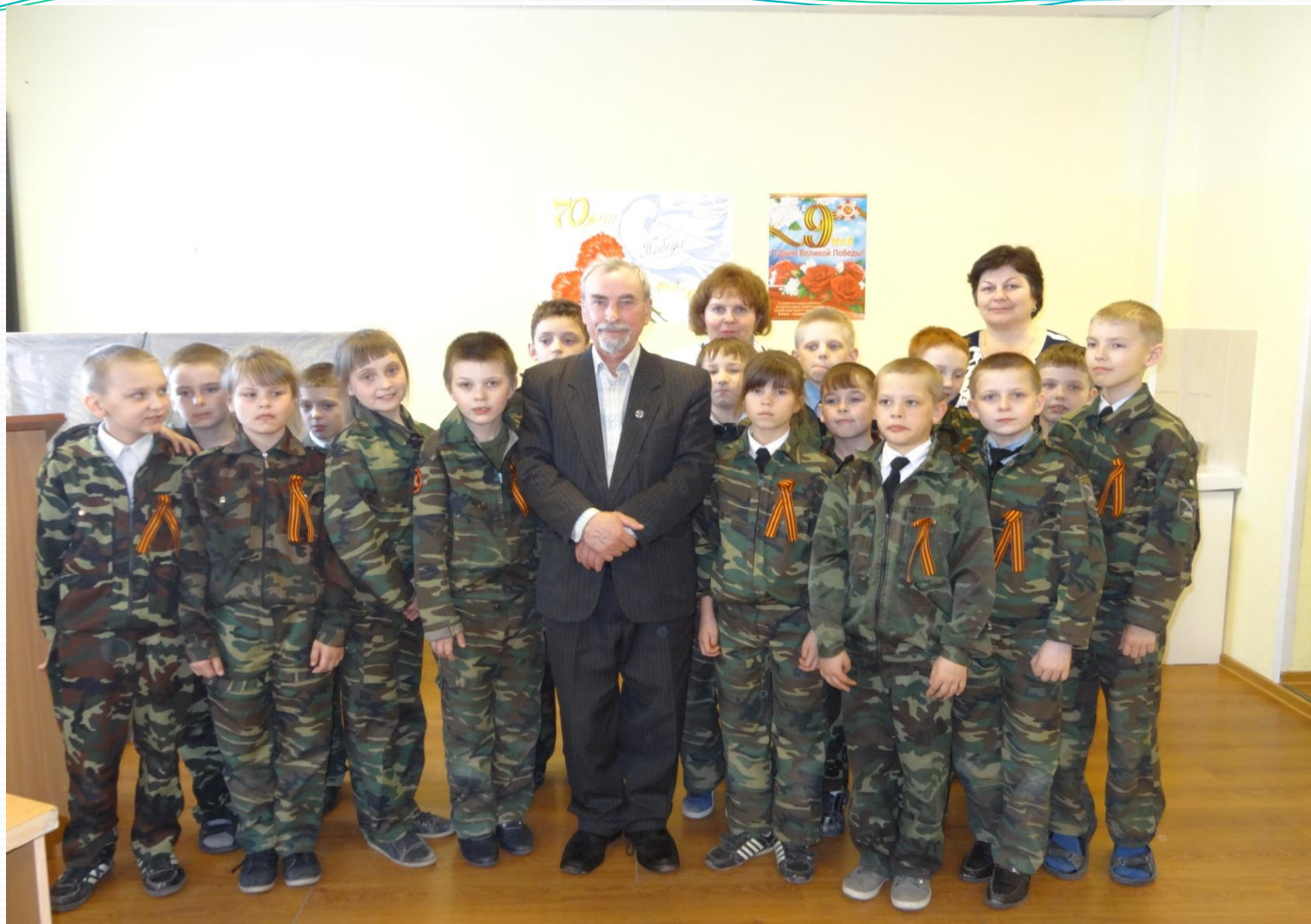
Кадеты с вологодским писателем Сазоновым Г. А.