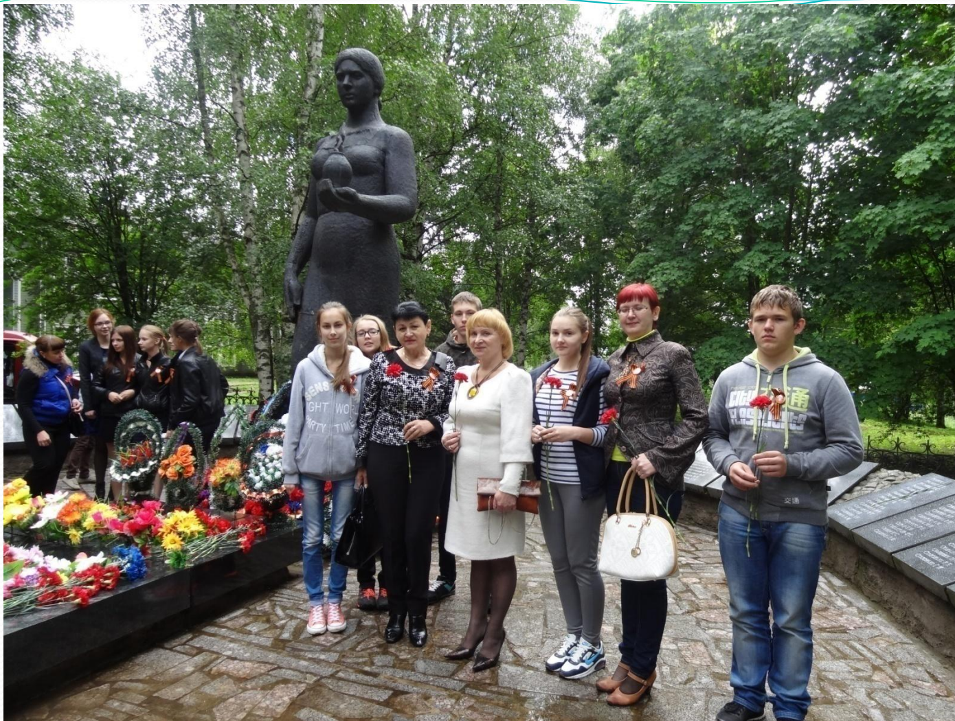
У мемориала «Скорбящая мать» , село Ошта