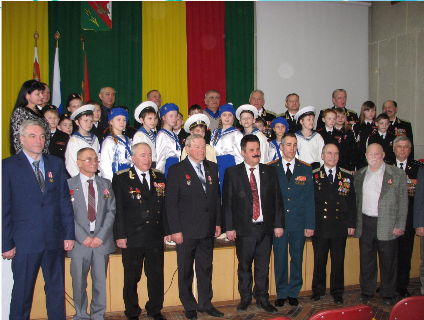
На празднике в администрации Вологодского муниципального района кадеты и воины – члены Союза ветеранов Анголы