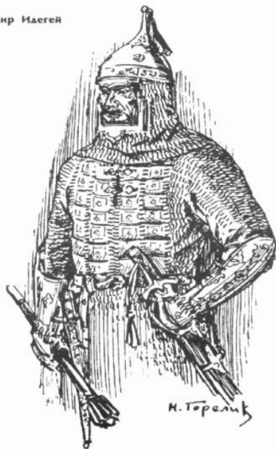
Едіге (1352-1419) — Ноғай ордасы, маңғыт