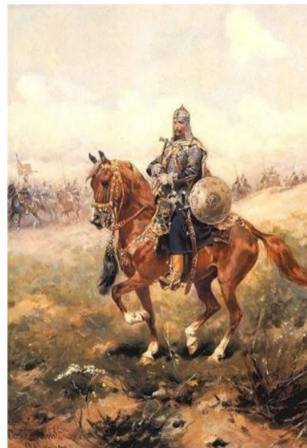
Көшім (1563 – 1598) - Сібір хандығы, Шайбани

Бейнематериалды көріп, сұрақтарға жауап берейік