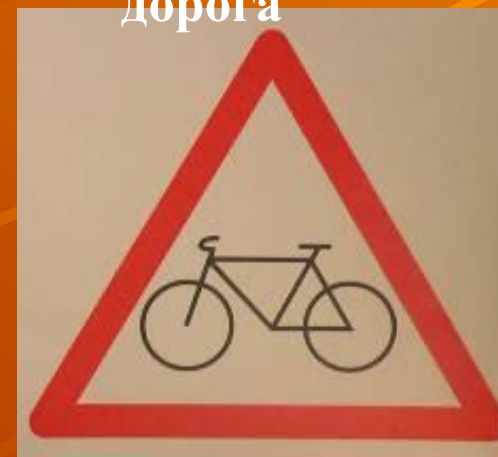
Знак, предупреждающий о наличии велосипедной дорожки