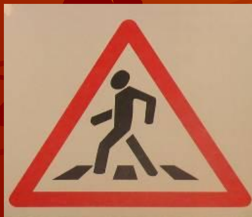
Знак, предупреждающий о наличии пешеходного перехода