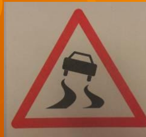
Осторожно, скользкая дорога